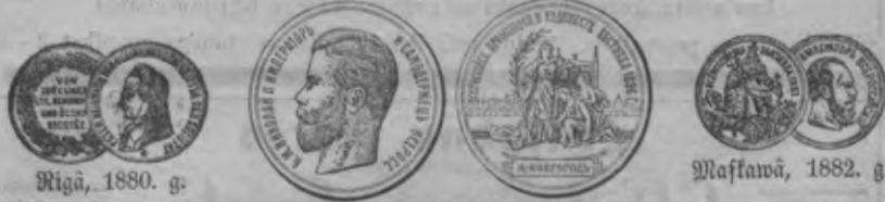
Rigā, 1880. g.