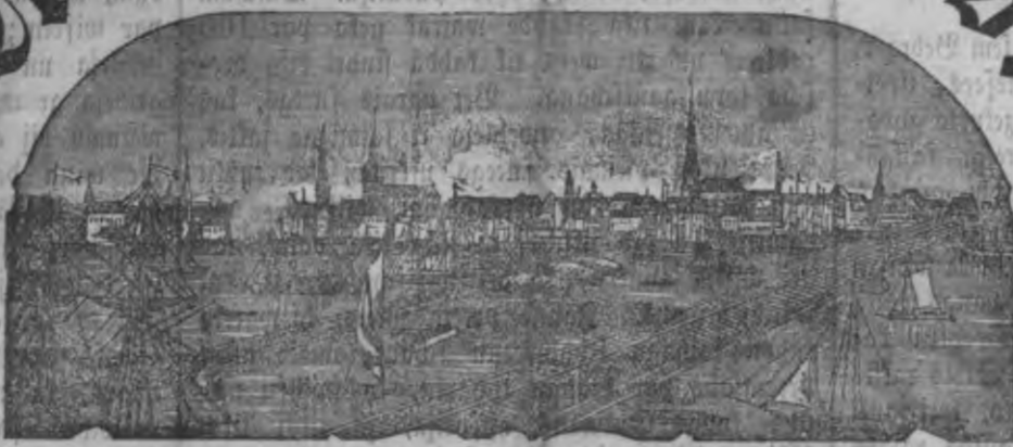
Mahjas weefiz isnah! meentel pa nedeku.

Ar pašā wifusheftiga augsta Reifara wehlešanu.