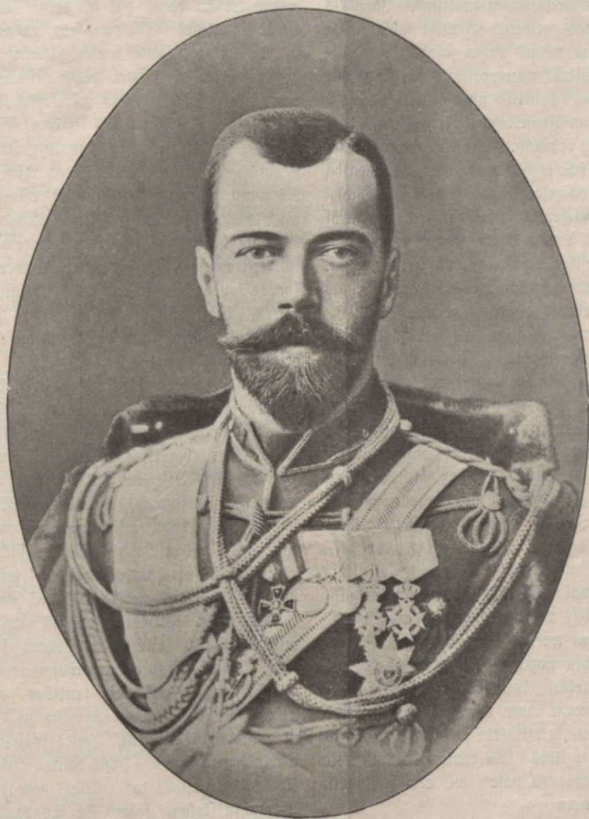
Wina Majestate Kungs un Keisars Nikolajs Aleksandrowitschs.