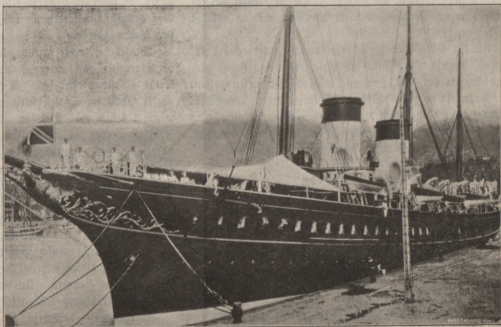
Reiſarilâ jahta „Standart“.

Saprotams, tee ir kawaleeri. Wini dodas taiſni grafam klahk panem ar wišu krehſlu uš pležeem, iſnes no basnizas laukâ un noleek uš basnizas peekalnina ſemê.