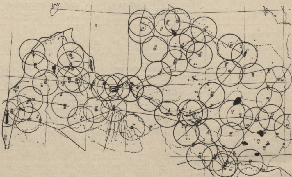
Latvijas pilsētu iespaidu sfairas ar rādiiju 30 km