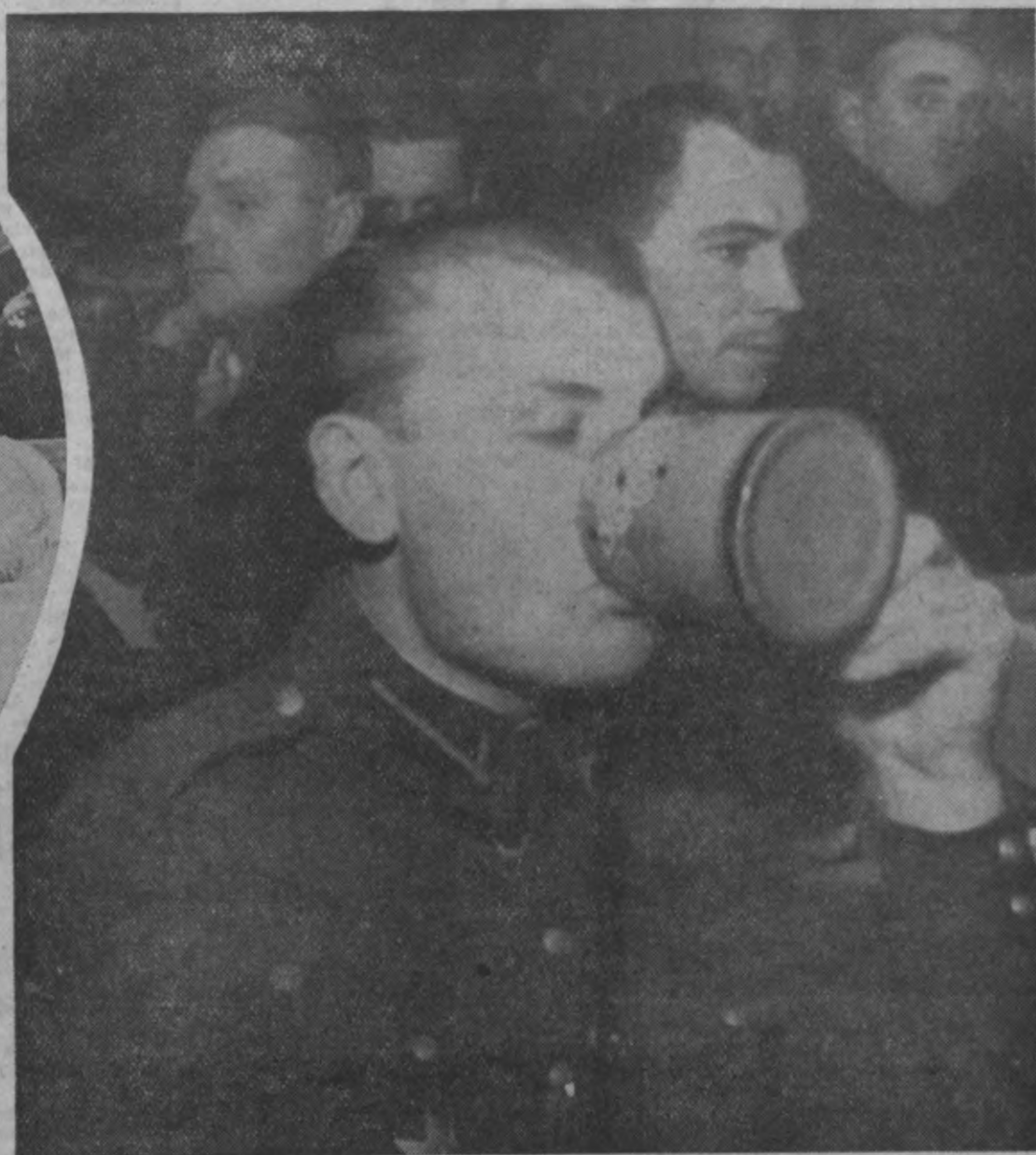
Salds mīestīņš lankandūku dara prātu. Tas tomēr lebaudāms vienmēr ar sātu. Un dāšu lestrāku, ja ceļš zem kājām. Kad jāiet viesoļies uz brūtes mājām.