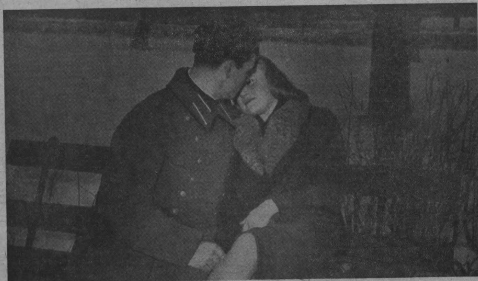
Var jau gadīties, ka piesalst tie pie sola (Māte nikna ir šai meitenei),