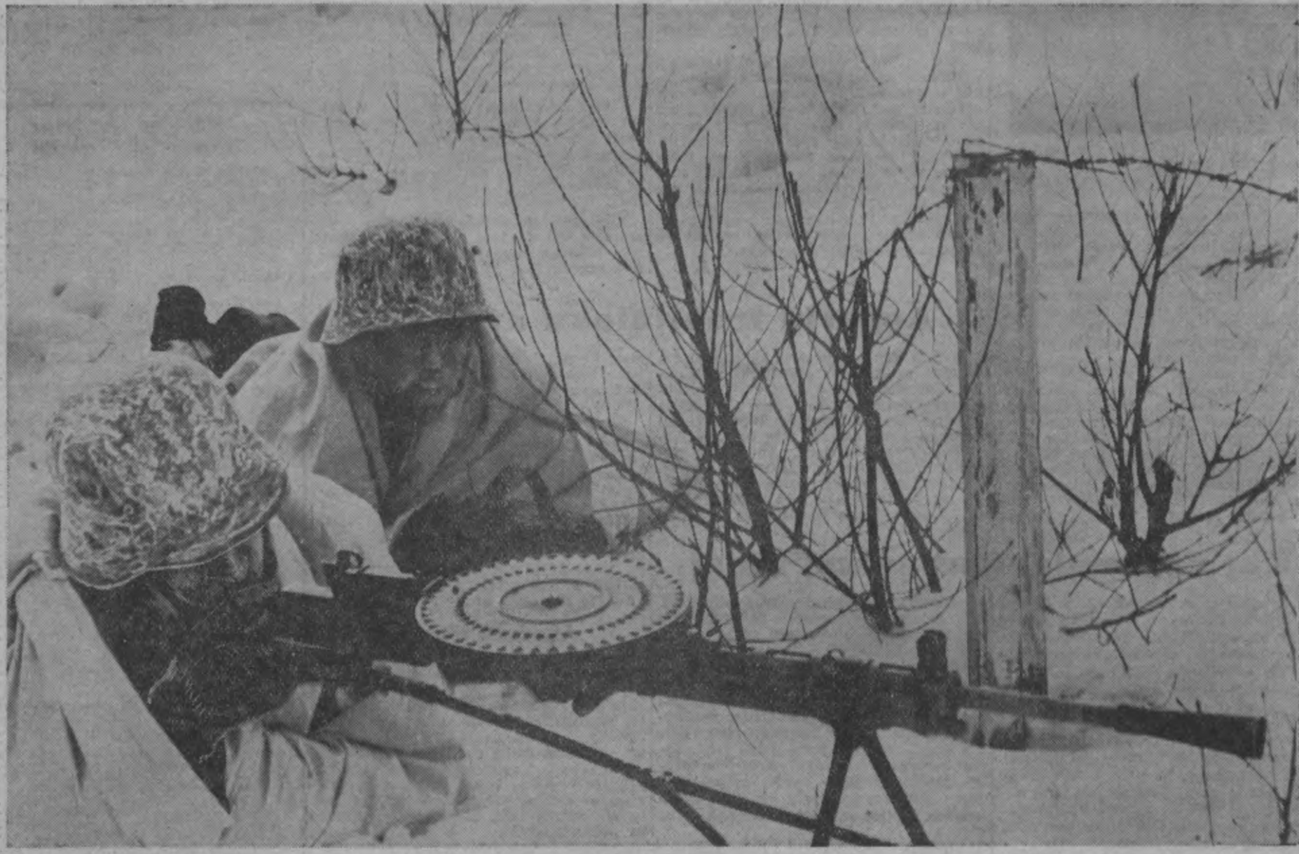
SNIEGA PĀRKLĀJU SLEPTI UN PATŠAUTENES SARGĀTI, LATVJU VIRI JŪTAS DROŠI SAVĀS VIETĀS

Nostādīta šo uzdevumu priekšā, 6. armija beidzot izturēja arī tad, kad, jēlenkumam ielīgstot un operācijām turpinoties, gaisa spēki, neraugoties uz vislielākajām pūlēm un smagākajiem zaudējumiem, vairs nespēja nodrošināt pietiekamu apgādi no gaisa