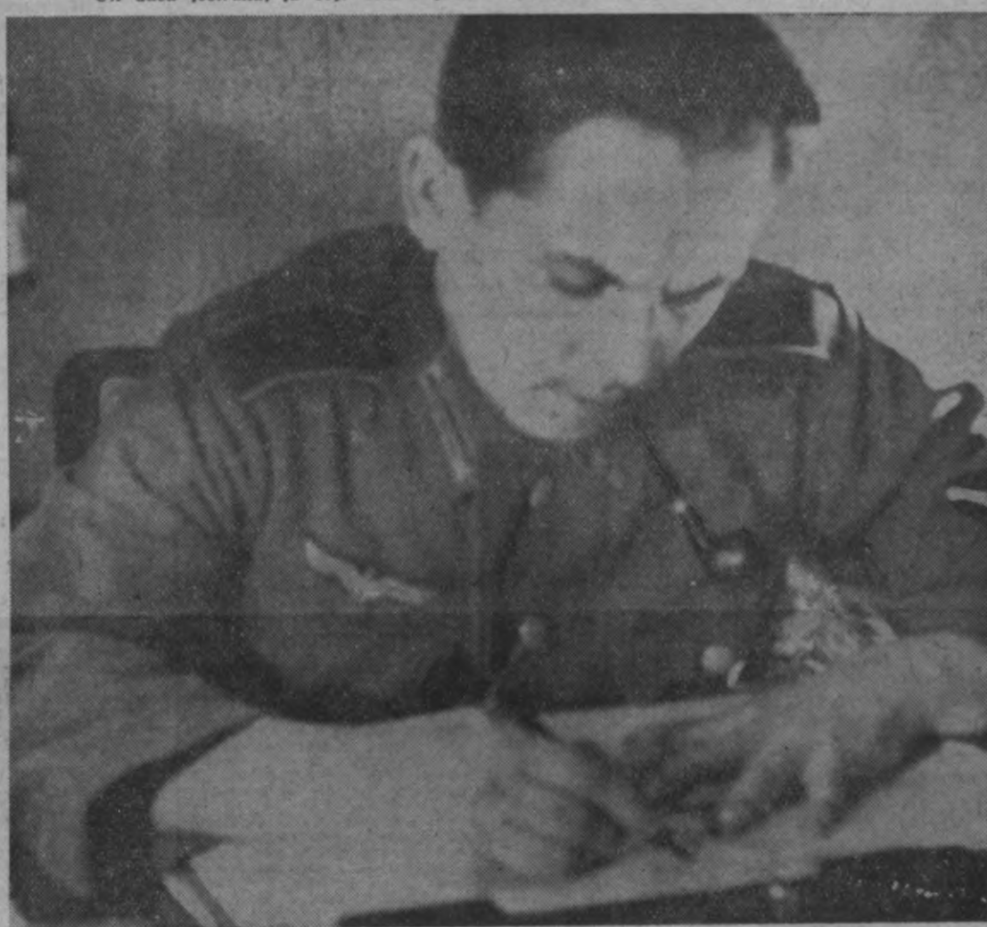
Vēl jāuzraksta ātri Vanagiem, Kā mūsu zēni raujas ciņas laukos,