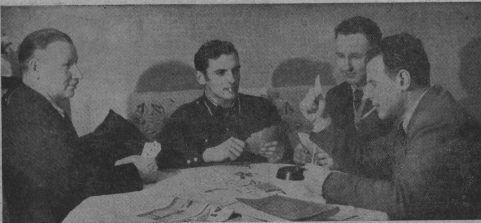
Nieka lieta brašam karēivim Turēt rokā četras meitenes, —