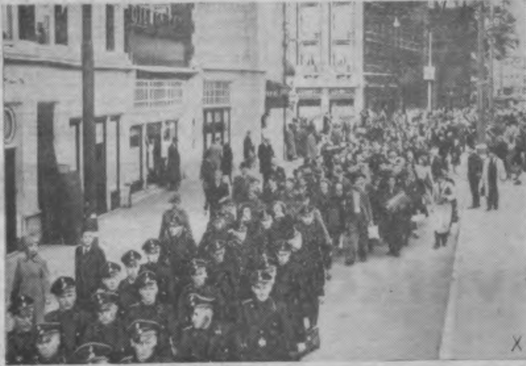
Visa Eiropa cīņā pret vispasaules ienaidnieku — bolševismu Apzinoties lielās briesmas, kas visām Eiropas valstīm draud, izceļoties bolševistiskajam chaosam, arvien no jauna un aizvien vairāk pieteicas brīvprātīgie, kas vēlas stāties kopējā Eiropas frontē pret bolševismu. Attēlā holandiešu brīvprātīgie, kas pēc attiecīgas apmācības soļo uz dzelzceļa staciju, lai no turienes tiešā ceļā dotos uz austrumu fronti. Tālāk citi brīvprātīgie, kas soļo uz kazarmēm, kur tos militāri apmācīs.