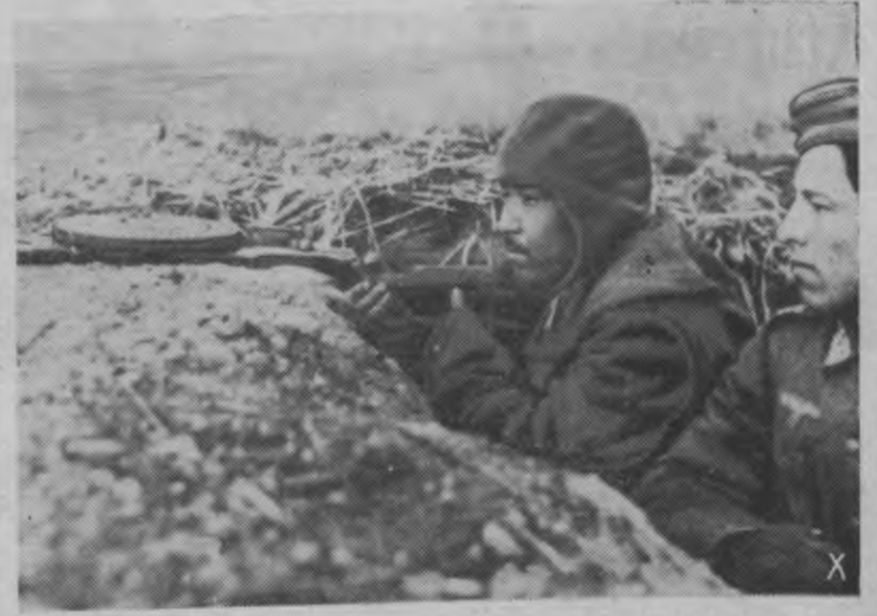
Atbrīvoto zemju kaŗavīri galvenā cīņas līnijā. Kopā ar vācu karēvjiem austrumu frontes pirmajos ierakumos cīnās arī atbrīvoto zemju kaŗavīri; drošsirdīgi un enerģiski tie apkaŗo uzbrūkošo ienaidnieku, kam vienmēr no jauna jāatkāpjas, ciešot asiņainus zaudējumus.

Turpat lūdz griesties nacionālīzēto uzņēmumu agrākos īpašniekus, kuŗiem trūktu ziņu par privatizācijas lietas stāvokli.