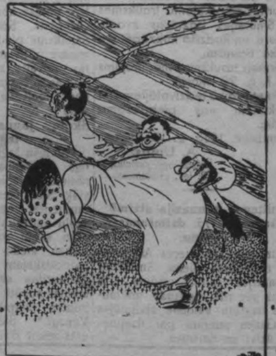
Staļina pēdas iezīmētas ar veltīgā cīņā kritušo padomju kaŗavīru kapu krustiem.

Izdevums, kas atēļos rāda boļševisma zvēra seju, iznācis un pieprasāms Kultūras un sabied-