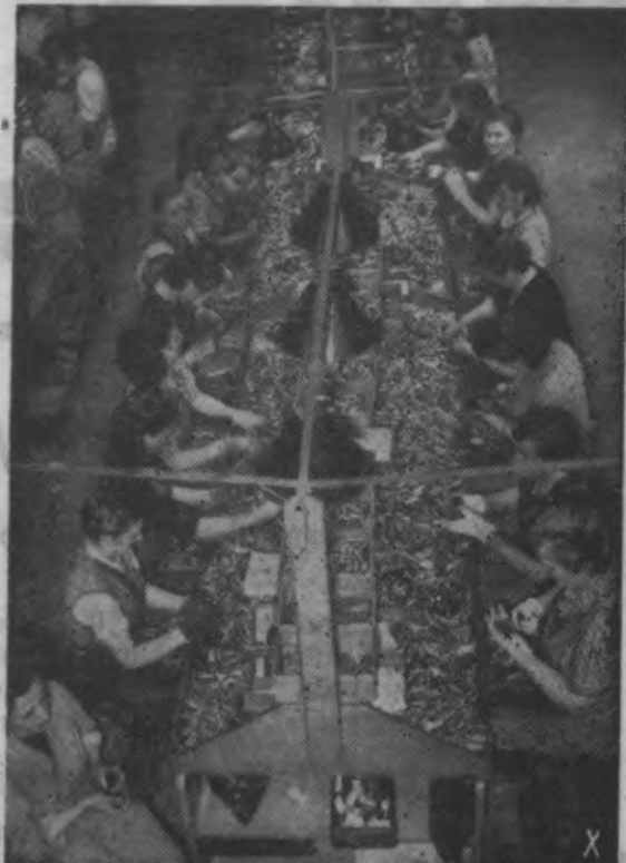
Arī vācu aviācijas rūpniecībā ir nodarbinātas sievietes, kur tās blakus vīriešiem izpilda svarīgu un atbildīgu darbu. Sieviete ir kļuvusi par uzticamu palīdzi, uz kuŗu meistars patiešām var paļauties. Attēlā redzam kādu sievieti, kas strādā pie aviācijas transporta mašīnas elektrības instalācijas darbiem. Attēlā pa labi: Cīņā par Vācijas brīvību un dzīves tiesībām šīs sievietes izgatavo municiju fronti, ar lielu prasmi veidamas šo atbildīgo darbu.