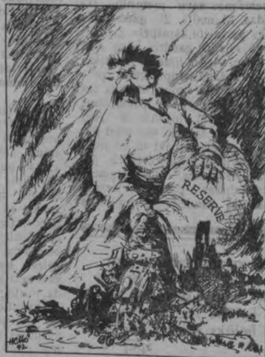
... Maisu pēc maies neprātīgi uguni!