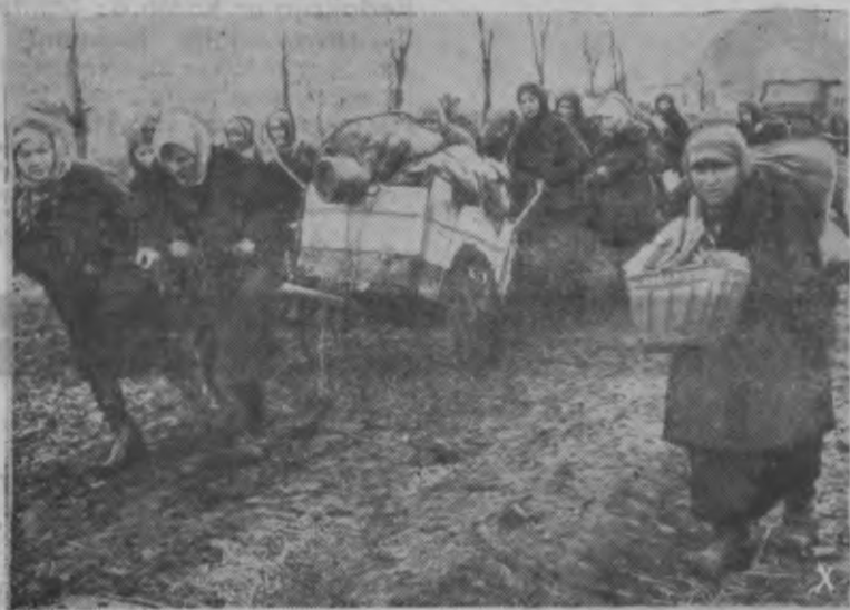
Izbēguši no bolševiku nagiem.

Lai izbēgtu no bolševiku varas darbiem, liels skaits civiliedzīvotāju, vācu armijai mainot savas pozīcijas, atstāja savas mājas. Pēc tam, kad vācu vienības atkal atguvušas šos apgabalus, savās dzimtajās sētās atgriezās arī no bolševikiem aizbēgušie civiliedzīvotāji un ir priecīgi, ka vācu armijas aizsardzībā var atgriezties mājās.