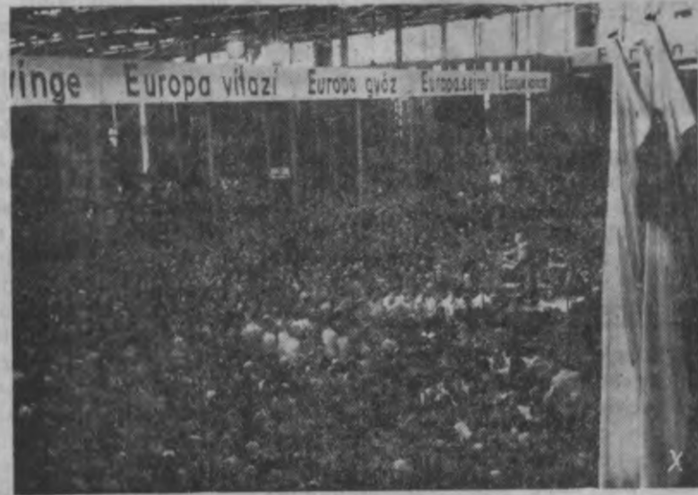
Darbīgās Eiropas cīņas frontē. Kādā lielā vācu bruņotās rūpniecības zālē sakarā ar Vācu darba frontes desmito gada dienu notika plaša sanāksme Visvācijas mērogā. Attēla — Dr. Leija (Ley) uzruna karogiem un transparentiem dažādās valodās greznotā zālē.