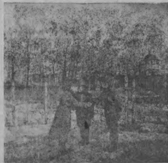
Lieldieņu sveiciens pie pārliecīgo baznīcas

Sprīžot pēc šiem oficiālajiem japāņu ziņojumiem, nav izslēgts, ka vasaras beigās