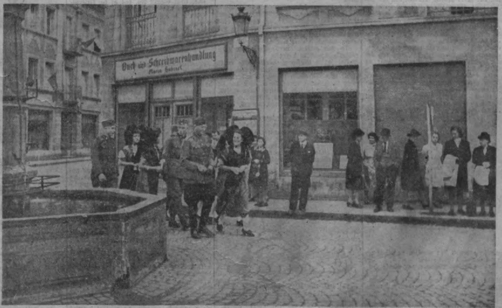
Brīvā laikā interesanti ir iepazīties ar tuvejo pilsētņu. Jaunie leģionāri jau paguvuši noslēgt paziņanos, un mēlēnes savos īpatnījos tautas tērpos ir laipnas pavadones