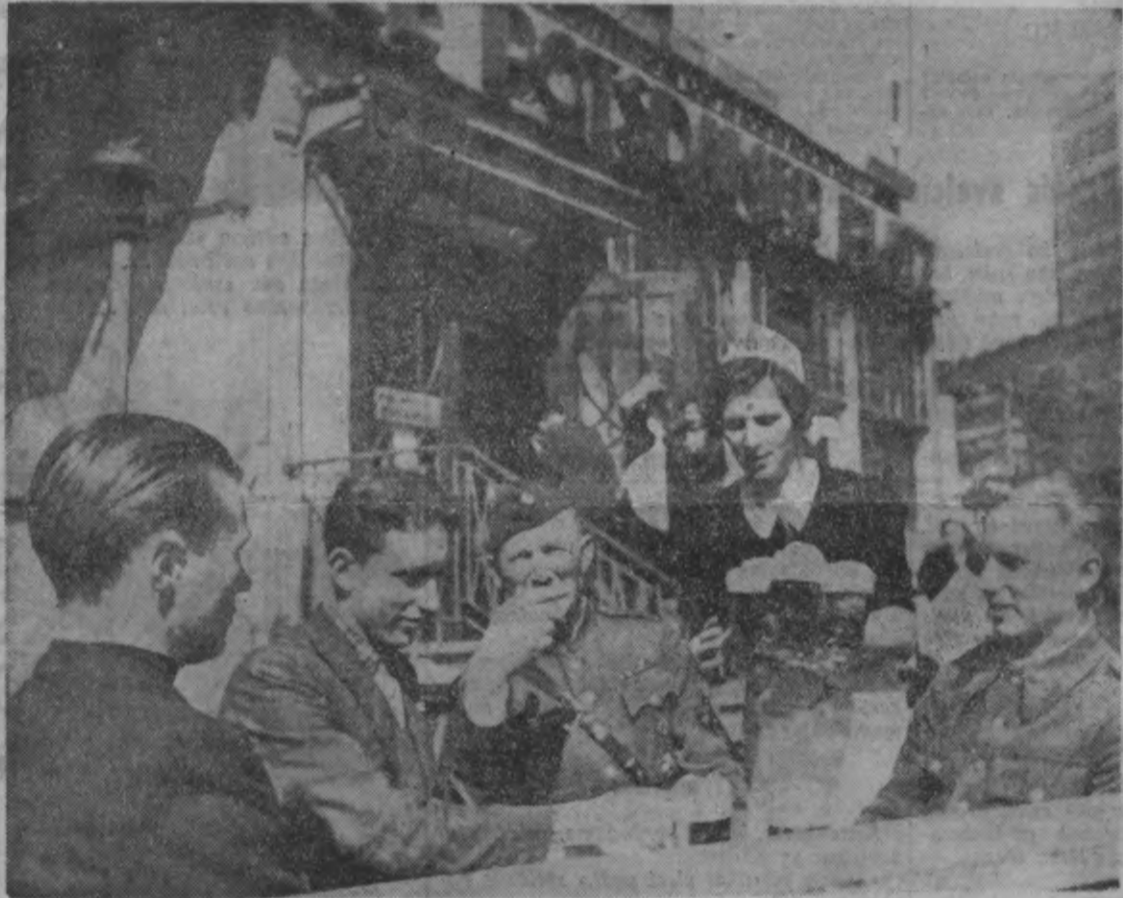
Pēc garas staigāšanas radušās slāpes jādzesē pašā Berlīnes centrā. Glāze alus garšo tikpat labi komandas vadītājam, kā viņa puisiem