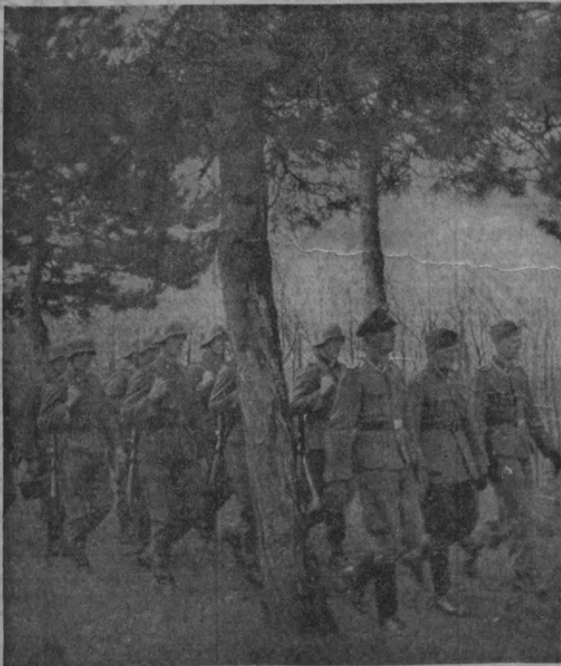
Brašā soli no apmācības vietas uz mītni