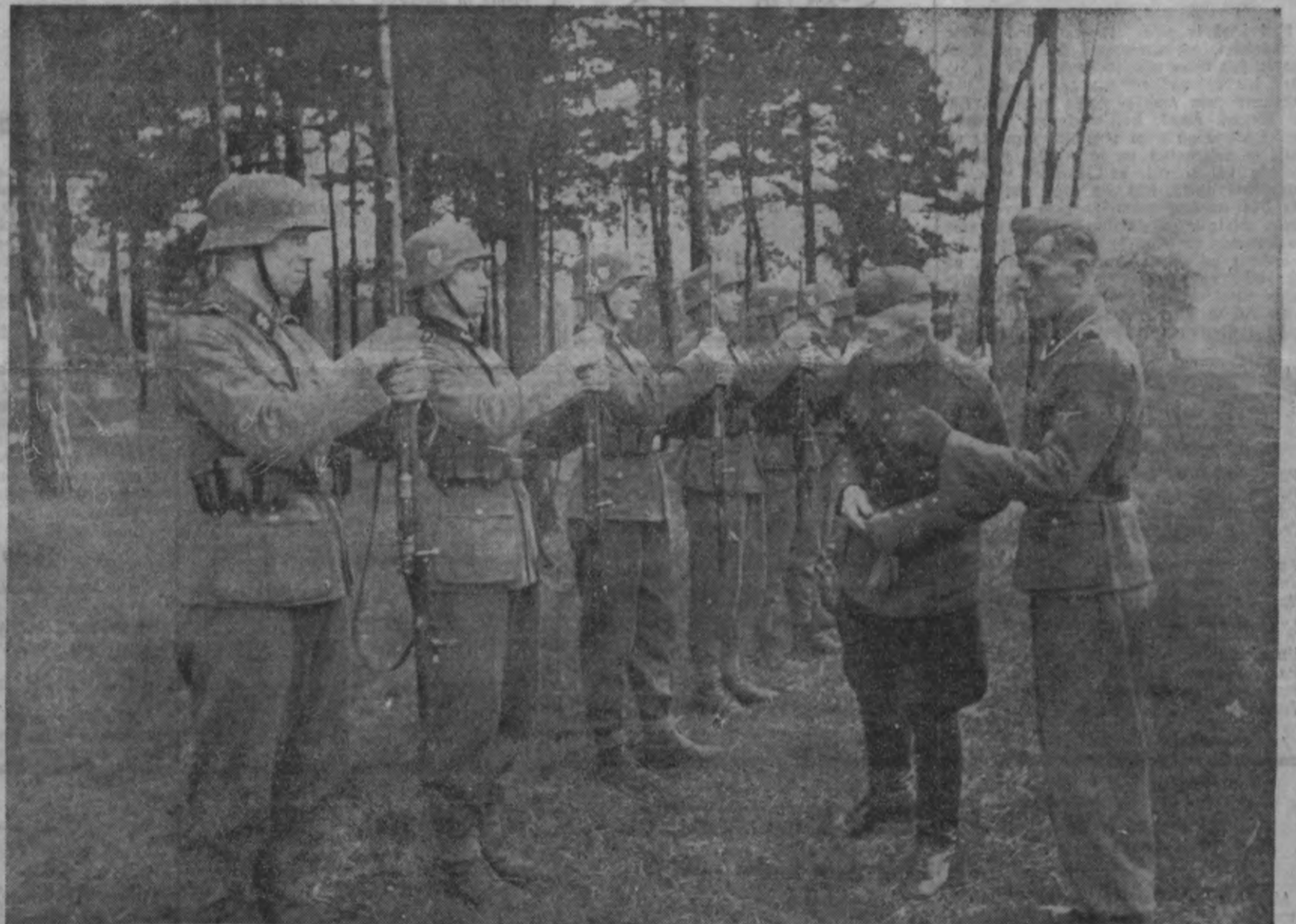
Tūlīg pēc ierašanās nometnē — Dienvidvācijā, sākas rosīga apmācība. Virsleitnāgta un instruktora vārigajai acij nepaiet garām ne mazākais sikums apmācībā ar šauteni