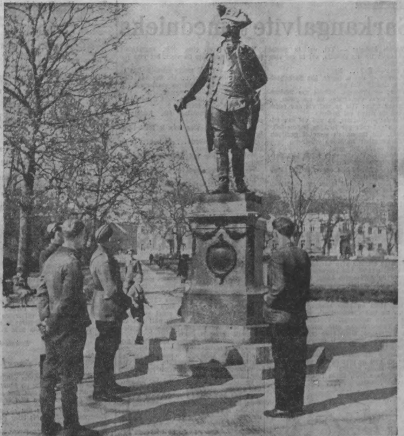
Apskate jaunos latviešu karavīrus novedusi arī Potsdamā, kur ik uz soļa dveš pretim Frīdriha Lielā nemirstīgās karēvīskās tradīcijas. Lielā Prūsijas karaļa Frīdriha II pieminēkla priekšā stāvo, domas klist atpakaļ uz dzimteni, jo arī tai bijis jāpārdzīvo daudz tikpat bargu un sāru dienu, kā kādreiz jaunajai Prūsijai