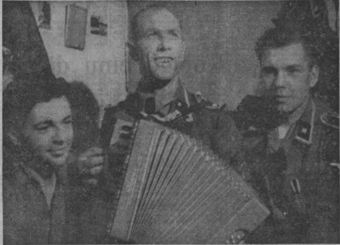
FRONTINIEKI ATPŪTAS BRĪDĪ

Ja vienai otrai varbūt sākumā likties, ka tai nodarīta liela pārstība, ka viņa, pāriedama pie cita, varbūt «vienkāršāka» darba, daudz zaudē no sava daiļuma un sievišķīgā pievilcības aureola, tad šīs sievietes vāji pazīst savu karavīru un viņu uzskata. Karavīrs, kuŗš devies lielajā cīņā, ir laimīgs, ja arī viņa sieva, li-