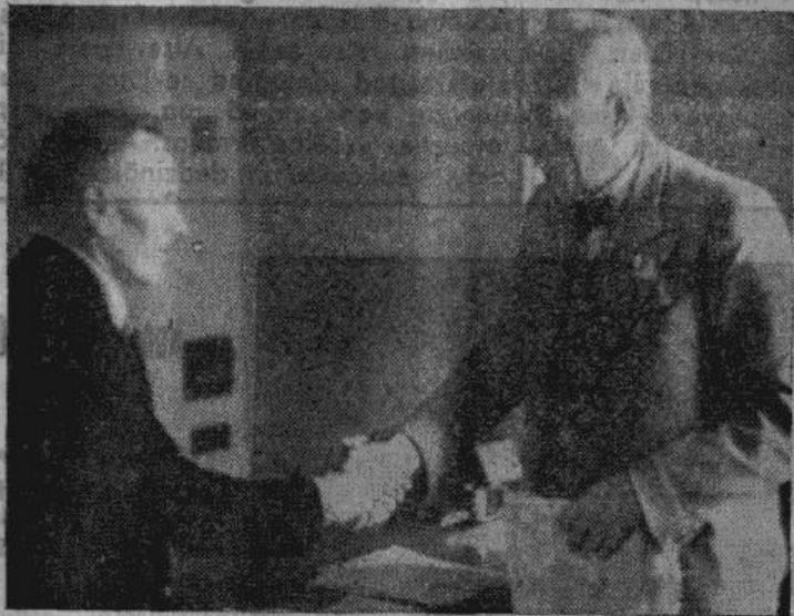
Amatnieku velte pilsētas vecākam

Ir uzlaboti un papildināti vācu ieroči. Šeit rūpniecības vadībai palīdzēja arī vācu rūpniecības struktūra ar daudzajiem uzņēmumiem un plašo izvieļojumu. Masu ražojumiem radītas milzu rūpnīcas, 1943. gada turpmākos mēnešos maija skaitļi vēl vairāk pieaugs; šim nolūkam jau izstrādāti pilnīgi un reāli plāni. Vācija ar pašāvību var vērot turpmāko kara norisi un tai nav jābaidās, ka pretinieku puses bruņošanās to varētu pārspēt.