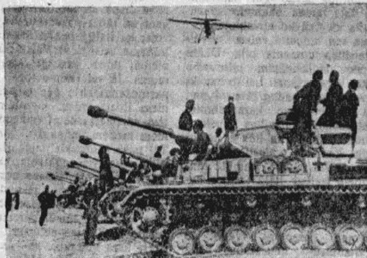
Draudīgi pret Ienaideņu vērienu smago vācu tanku lielgaball, kamēr kāds Pīzelers "Storcha" pārlieto Ibrauda atvāļes broiti.