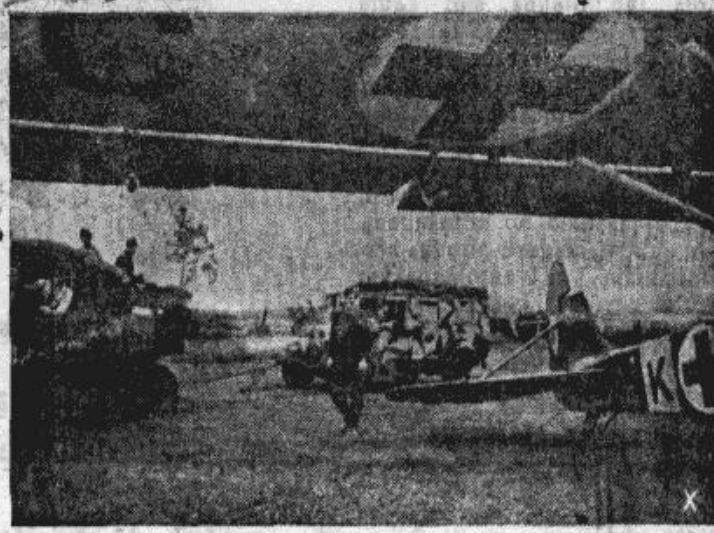
Biedrs „Storchs” pilda sanitāro dienestu

Darba sanāksmes turpinājumā Seces pagasta jaunieši, draudzīgi sadarbo- dāties ar izpalīdzēm no Rīgas, rādīja