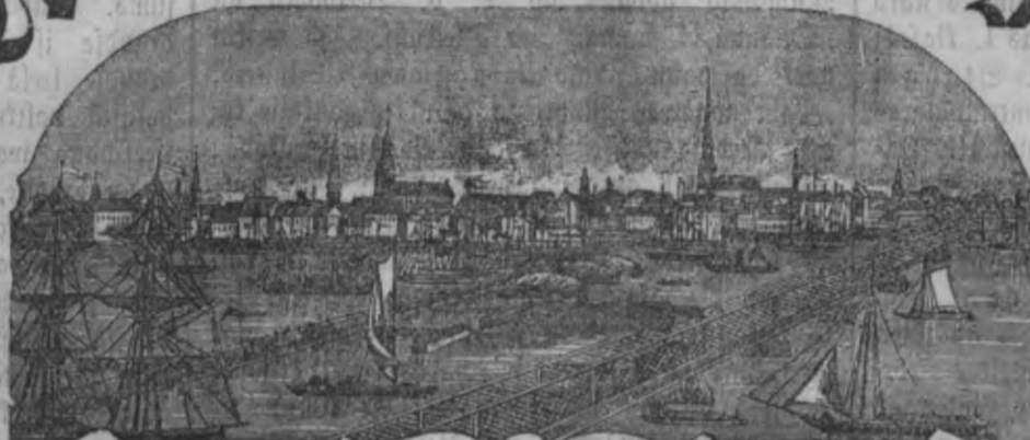
Mahjas Weefis isnahk weentēis pa nedēsu.

Maksa ar peesubtitānu par pašā: Ar Weefitumu: par gadu 2 r. 35 l. beš Weefituma: par gadu 1 " 60 " Ar Weefitumu: par 1/2 gadu 1 " 25 " beš Weefituma: par 1/2 gadu " 85 " Maksa beš peesubtitānas Rīgā: Ar Weefitumu: par gadu 1 r. 75 l. beš Weefituma: par gadu 1 " " " Ar Weefitumu: par 1/2 gadu " 90 " beš Weefituma: par 1/2 gadu " 55 "