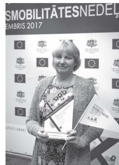
Informē Vides aizsardzības un reģionālās attīstības ministrija

EMN mērķis ir aicināt cilvēkus dažādēt pārvietošanās veidus, lai risinātu Eiropas Savienības iedzīvotājiem aktuālas problēmas – mazinātu satiksmes sastrēgumus un atmosfēru sasildošo izplūdes gāzu apjomu pilsētās, mudinātu pārvietoties ar velosipēdu un kājām, uzlabojot eiropiešu veselības stāvokli.