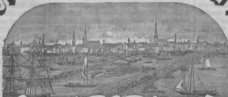
Mahjas Weefis isnahk weenreis pa nedetu.

Makfa ar peefubtischānu par pašā: Ar Peelikumu: par gadu 2 r. 35 l. bet Peelikuma: par gadu 1 " 60 " Ar Peelikumu: par 1/2 gadu 1 " 25 " bet Peelikuma: par 1/2 gadu — " 85 "