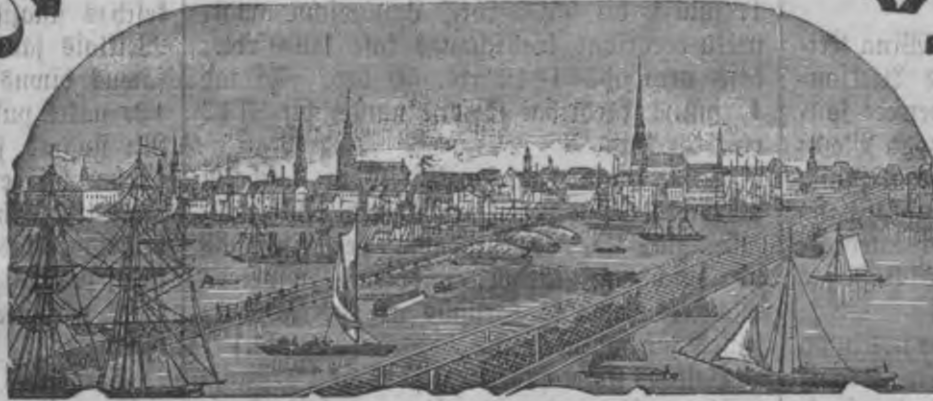
Mahjas Weefis isnahk weentreis pa nedetu.

Mafsa bef peefufufifšanas Rīgā: Ar Peelikumu: par gadu 1 r. 75 L. bef Peelikuma: par gadu 1 " " " Ar Peelikumu: par 1/2 gadu " 90 " bef Peelikuma: par 1/2 gadu " 55 "