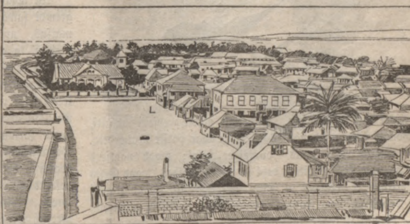
Zwaju fraters (Kostarika) un Iawas ispostitā Kartaga.