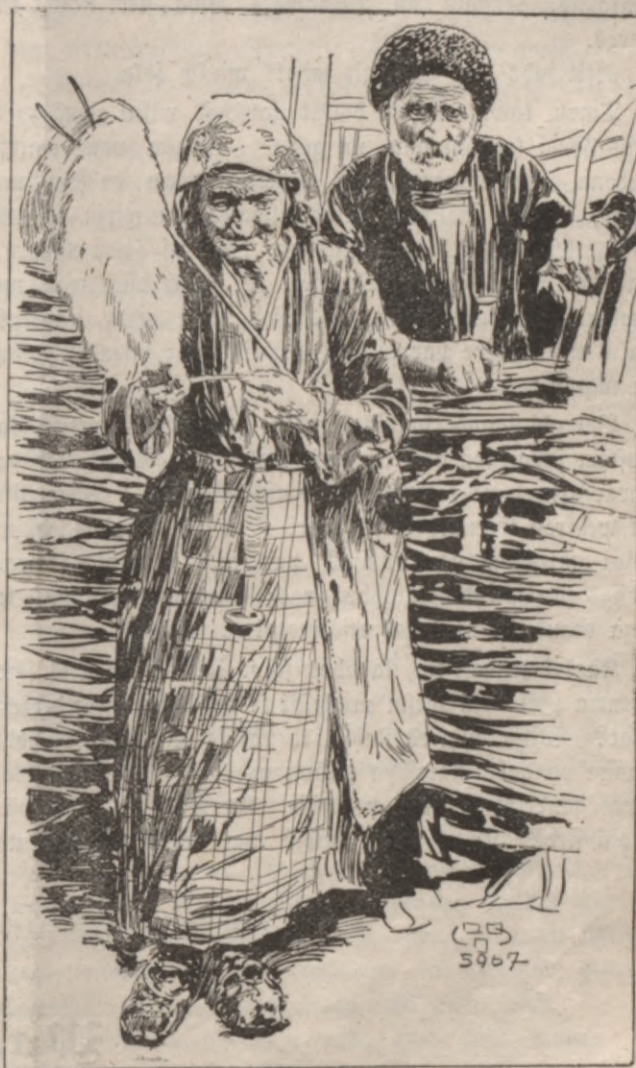
Wezatā ſeeweete pajaulē.

„ſaprotams. Bet, Berlinga kungs, ſakat tatschu man — waj juhs jau . . . ſaderinajatees? Juhs gan ſapratifiat, ka es buhtu toti preeziga, ja taſ nebuhtu wehl notizis! Ta tatschu buhtu leela netaiſniba un man ir kahda nojauta, kura ſaka, ka tikai es eſot pee ta wiſa wainiga. Zums taſ newajadſeja likt uſ maneem wahrdeem tit leela ſwara: es eſmu te ſweſchneeze, ſemes eerachas