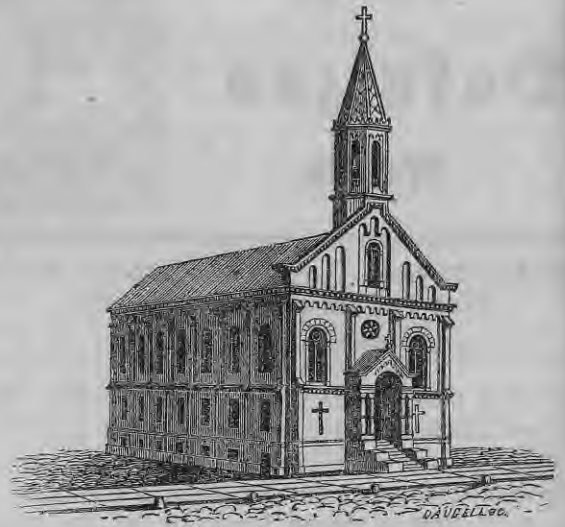
Šcht bilde rahda Pehterburgas jaunu Zggaunu Deewa nammu.

Tā tad warreja nu 1858tā gaddā draudse grunts weetu preefch Deewa namma, preefch mahzitaja mahjas un behru skohlas nopirkt un Zahna deenā 1859tā gaddā basnizās ehlahm grunts afminus likt. Zgaghjuschā waffarā dabjuja mahzitaja un skohlas-mahju gattawu, bet pee basnizās wehl bij dands darba, un nandas truhkums sahke rahditees. Lai ko peetaupitu, tad atstahje draudse to weetu, fur lihds schim par dahrgu nandu bij mittnsi, un sapulzejahs jaunā skohlas istabā un pascha mahzitaja istabās, kas skohlai lihdsahs. — Turklaht muhsu palihdsibas lahde sawu rohku atwehre, ka basnizās buhweschanu warretu nobeigt. Wissi nu zihnijahs, lai jaunu basnizās gaddu jaunā Deewa namma warretu eefahkt. Ar Deewa palihgu tā arri isdewahs. — Basnizina irr 17 affis garra un 14 affis platta. Wiana irr patti pirma Luttera basniza Pehterburgā, kas irr puschkota ar tohrni un pulsteneem. No ahrenes un eefshenes glihta un skaihta bij winna jauka bruhke, kas us sawu Adwentes-bruhstganu gaidija.