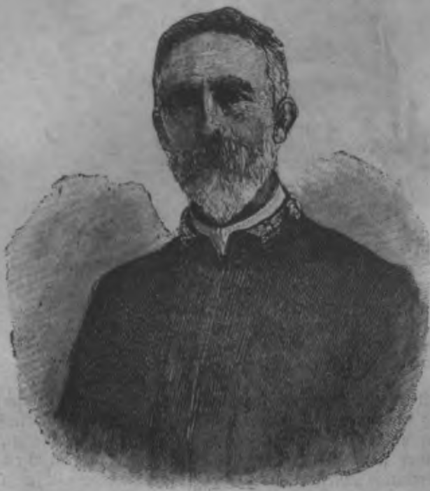
William Thomas Sampson. (Serwera flotes isihzinatajs.)

kola eefšpufe loti bihstama luga aistahvetajeem; granatās, kas trahpa lugi, aistehina kola datās un fahšaidā tās milsum daudj flabargās, kas eewaino luga taudis. Wišas Wafar-Giropas flotes pehž schās pamahzibas pehdejs gaddis steiguschās pahrbuhvet fawus lugs, isnemt pehž eefpehjas wišas kola datās, atstah titai diešī waj zinku un aluminiju, kas no granatam trahpiti, nebod flabargās un newar degt. Vet preefšch Spaneešcheem jaunlaiku teknikas nowehrojumi naw bijuši rakstīti. Palaidnigai Spaneešchu waldbai tā tad wispirms war patektes par til daudj duhšchigu jubneeku boja eefšchunu.