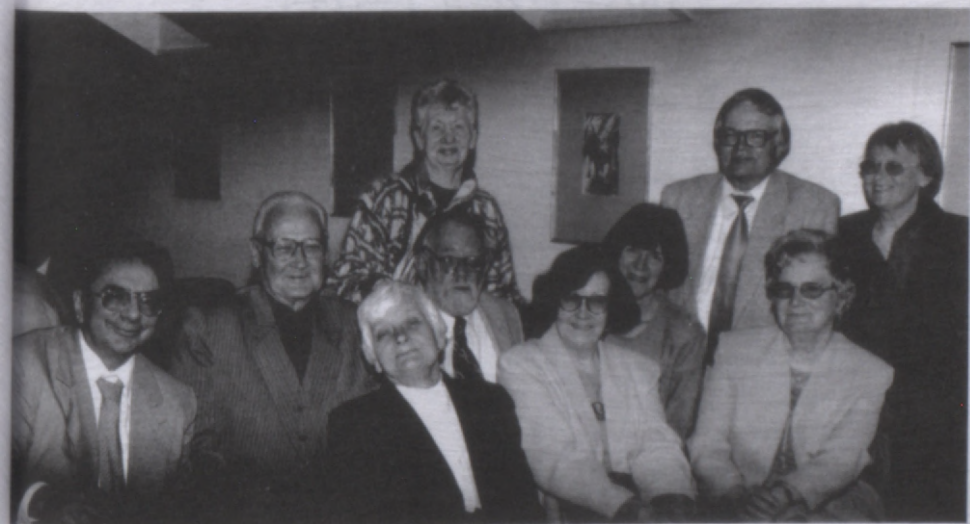
Te nu viņi – laba tiesa no vecajiem rūditajiem “Liesmas” kadriem. 2001. gada jūnijā Rakstnieku Savienībā Kuršu ielā.