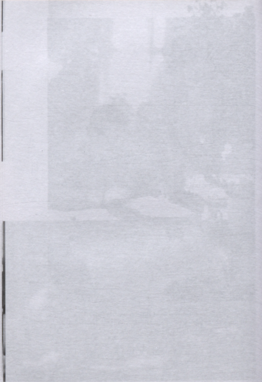
Faded text at the bottom of the page, likely a caption or description, which is illegible due to fading.