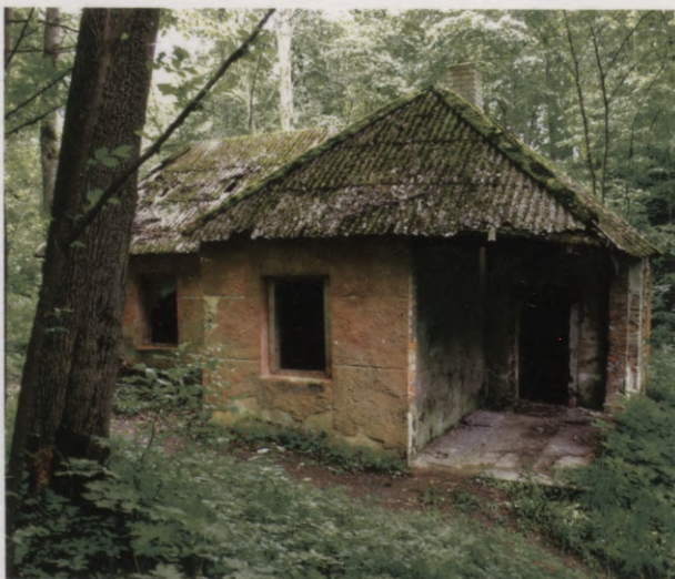
35. Agrākā kapela. 2005. g. foto. Die einstige Kapelle. Foto 2005.

zerstört; die Reste desselben liegen heute in der Umgebung des Grabhügels.