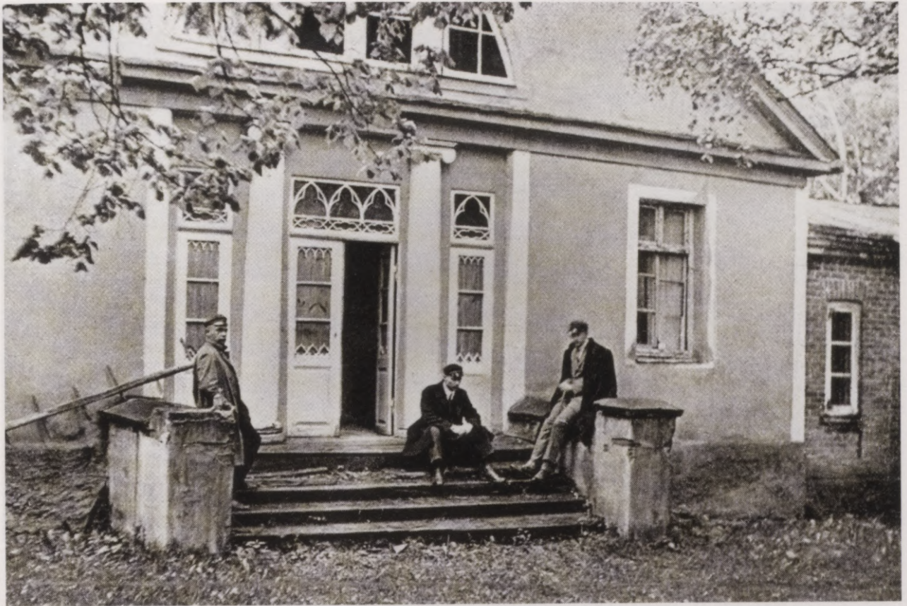
13. Jumpravmuižas viesu māja 1920. gados. Reprodukcija no H. Piranga grāmatas "Das baltische Herrenhaus". Das Kavalierhaus in Jungfernhof in den 1920er Jahren. Reproduktion aus dem Buch von H. Pirang "Das baltische Herrenhaus".