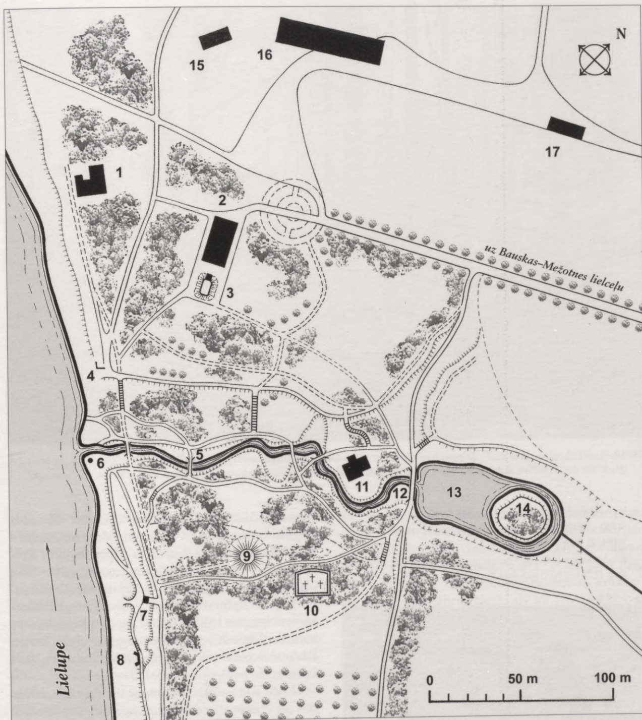
27. Jaunjumpravmuižas centra situācijas plāns ap 1920. gadu. Situationsplan des Gutszentrums von Jungfernhof (Neu-Jungfernhof) um 1920.