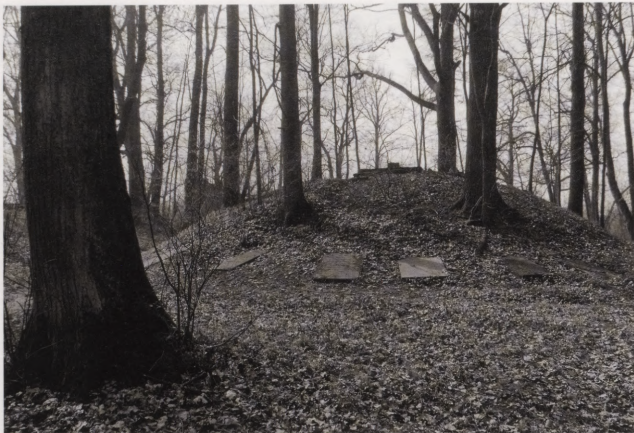
28. Skats uz Lidinghauzenu-Volfu dzimtas kapu kalniņu Jumpravmuižas parkā. 1991. g. foto. Blick auf den Friedhof der Familie von Lüdinghausen-Wolff in der Parkanlage von Jungfernhof. Foto 1991.