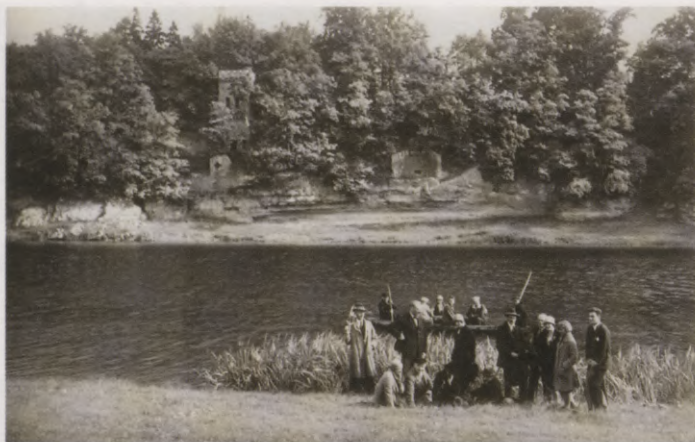
23. Skats uz Jumpravmuižas parku un mākslīgajām pilsdrupām pāri Lielupei. 1930. gadu foto.

Blick auf die Parkanlage in Jungfernhof und auf die künstliche Burgruine über die Aa. Foto 1930er Jahre.