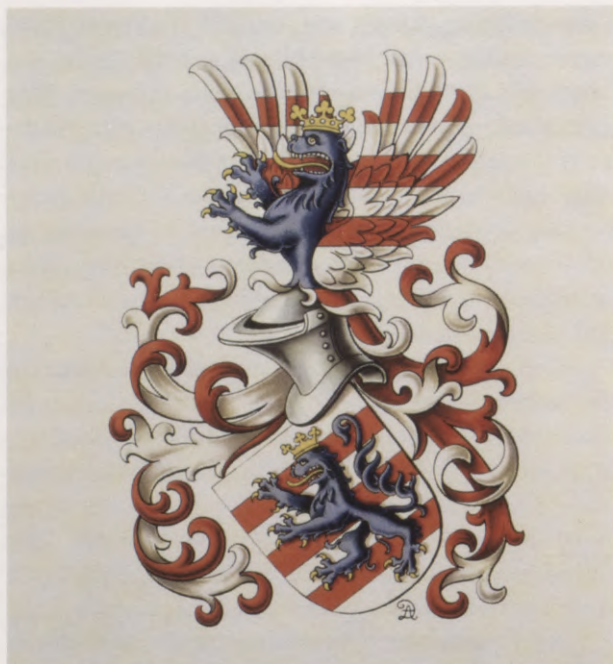
4. Lüdinghauzenu-Volfu dzimtas ģerbonis.

A. Drahenhauzenu zīmējums no "Jahrbuch für Genealogie, Heraldik und Sphragistik, Jg. 1895". Mitau, 1896.