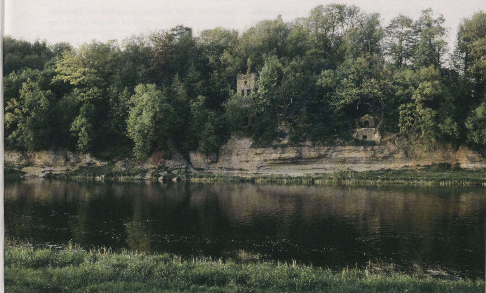
1. Skats uz Jumpravmuižas parku pāri Lielupei. 1992. g. foto. Blick auf den Park von Jungfernhof über die Aa. Foto 1992.

J umpravmuiža viegli sasniedzama, braucot pa Bauskas–Mežotnes ceļu un pusceļā nogriežoties uz Lielupes pusi. Taču ceļiniekus arvien vilinājis cits maršruts – no Bornsmindes pāri upei, kas gan ir stipri sarežģītāks, taču jau ar pirmajiem iepazīšanās mirkļiem ļauj izbaudīt šīs vietas neparasto burvību un ainavisko krāšņumu.