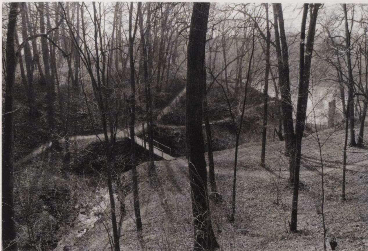
20. Skats uz strauta izgrazyto gravu Jumpravmuižas parkā. 1994. g. foto. Blick auf die von einem Bach ausgewaschene Schlucht im Park von Jungfernhof. Foto 1994.