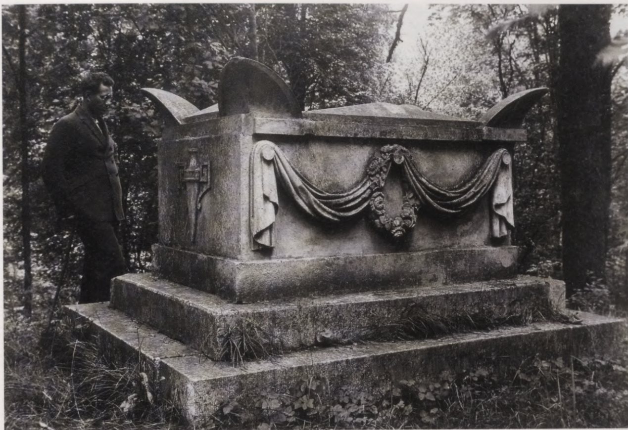
30. Piemineklis Lidinghauzenu-Volfu dzimtas kapu kalniņa virsotnē. 1925. g. foto. Denkmal auf dem Friedhof der Familie von Lüdinghausen-Wolff. Foto 1925.