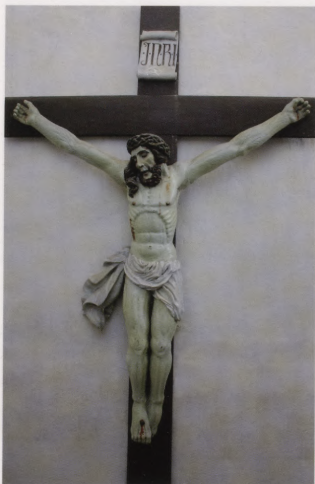
37. Kokā griezts krucifikss no Jumpravmuižas kapelas Bauskas Sv. Gara baznīcā. 2005. g. foto. Krucifiks aus der Kapelle zu Jungfernhof, heute in der Kirche zum Heiligen Geist in Bauske. Foto 2005.

toreizējā muižas īpašnieka Artūra fon Lidinghauzena māte te esot sarakstījusi daudzus dzejoļus, un pat citējis vienu no viņas sonetiem. 83