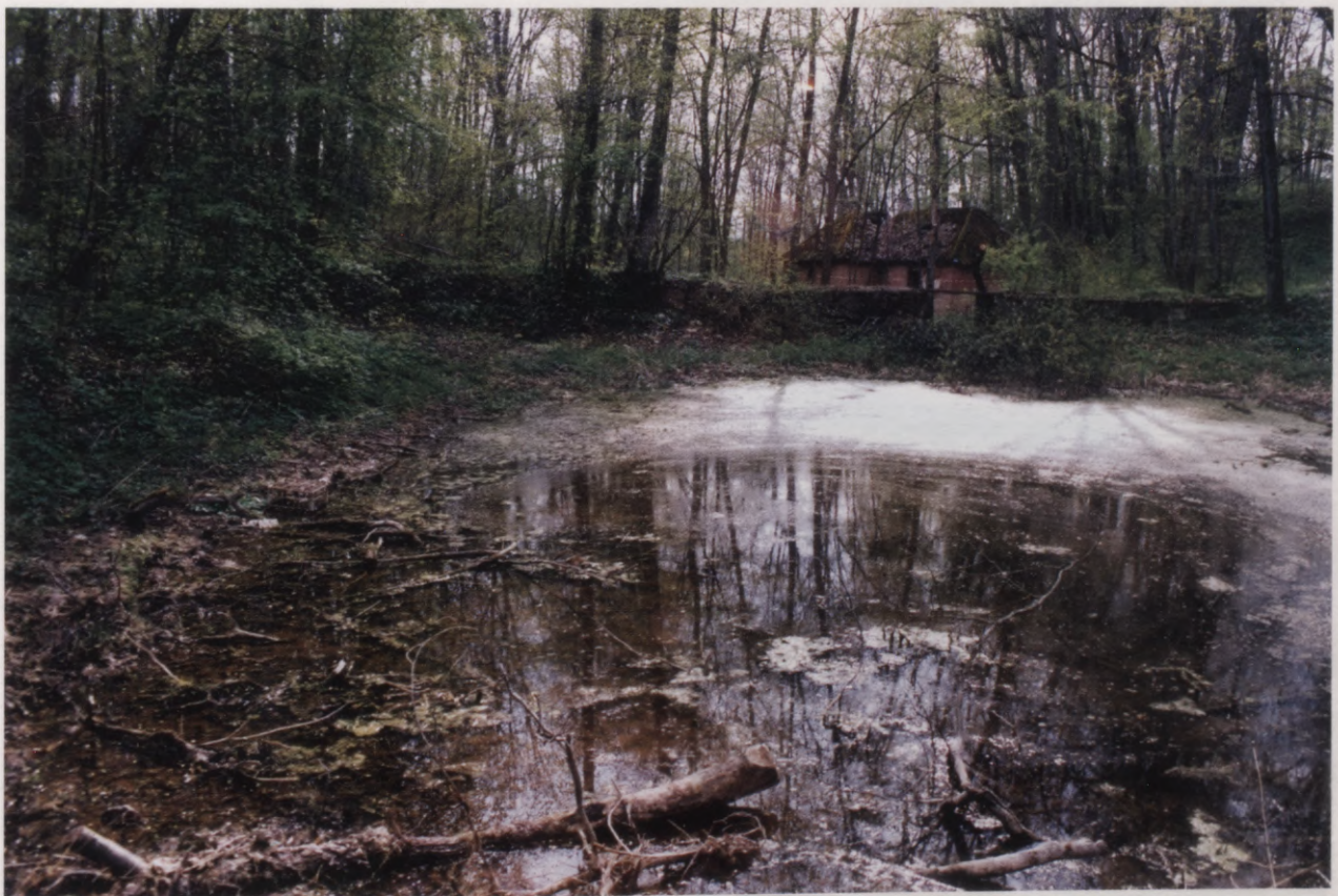
33. Skats uz kapelu un tiltiņa vietu pāri dīķim. 2004. g. foto. Blick auf die Kapelle und die einstige Stelle der Brücke über den Teich. Foto 2004.