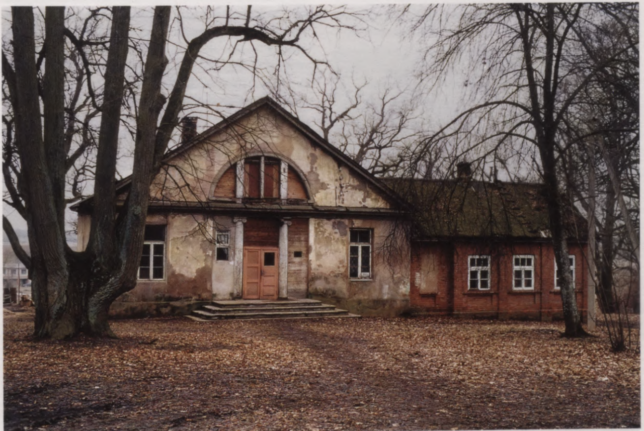
14. Jumpravmuižas viesu māja mūsdienās. 2004. g. foto. Das Kavalierhaus in Jungfernhof in unserer Zeit. Foto 2004.