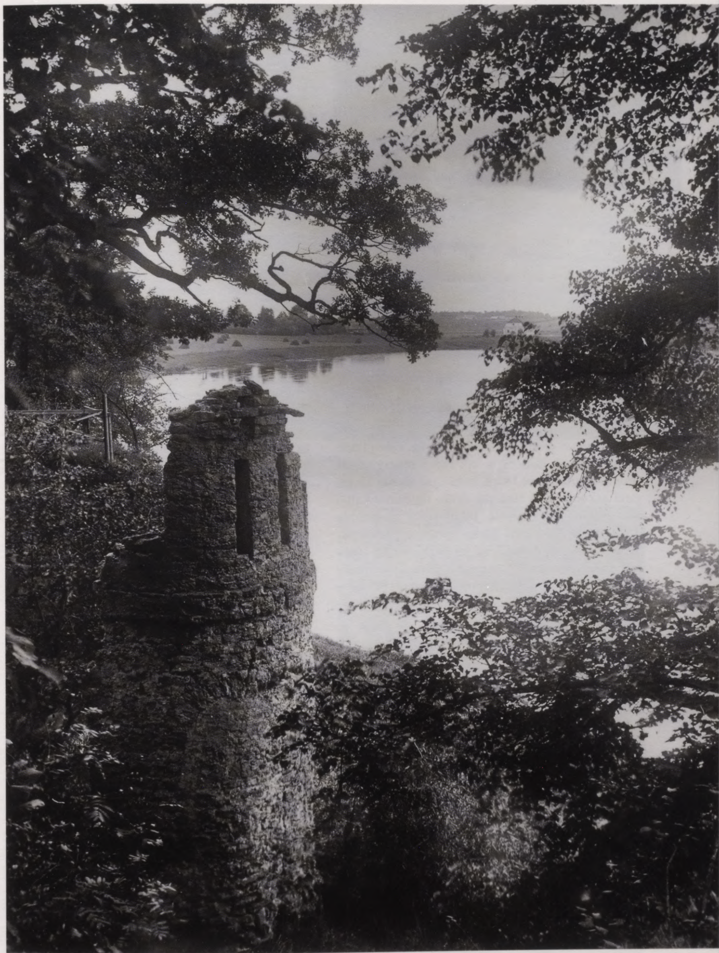
22. Skats Jumpravmuižas mākslīgo pilsdrupu apaļo tornīti pie strautiņa ietekas Lielupē. 1933. g. foto. Blick auf den runden Turm in der künstlichen Burgruine zu Jungfernhof – an der Mündung des Baches in die Aa. Foto 1933.