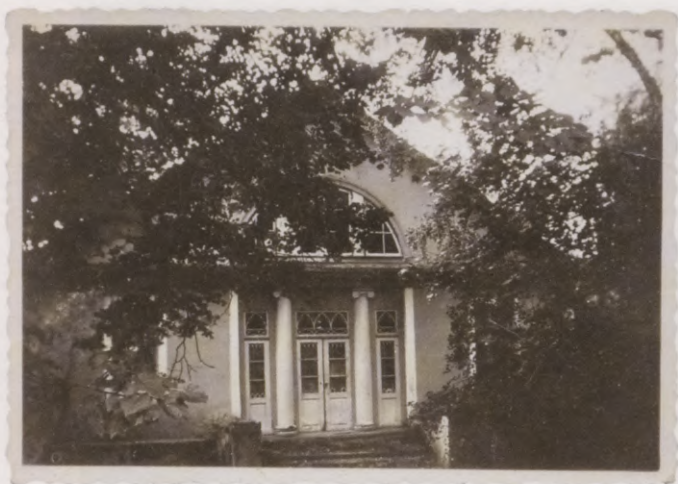
12. Jumpravmuižas viesu (kavalieru) māja. 1920. gadu foto. Das Kavalierhaus in Jungfernhof. Foto 1920er Jahre.

logu un durvju virsgaismu spraišļojumus. Te gan jāpiebilst, ka gotiskas arkatūras izmantošana klasicisma, ampīra un bīdermeijera laika mēbeļmākslā vai citās lietišķās mākslas nozarēs nav nekas ārkārtējs. To pašu var teikt arī par smailloka arkatūras izmantošanu durvju virsgaismās vai vērtņu rotāšanā.