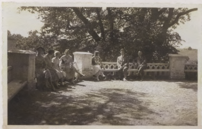
18. Jumpravmuižas parka skatu laukums ar norobežojošo balustrādi. 1937. g. foto.

Šajā vietā gribas uz brīdi pārtraukt Valža aprakstu, piebilstot, ka visklajāk šo drupu nelōģiskums parādās tieši tajā daļā, kura celta lejāk – pie