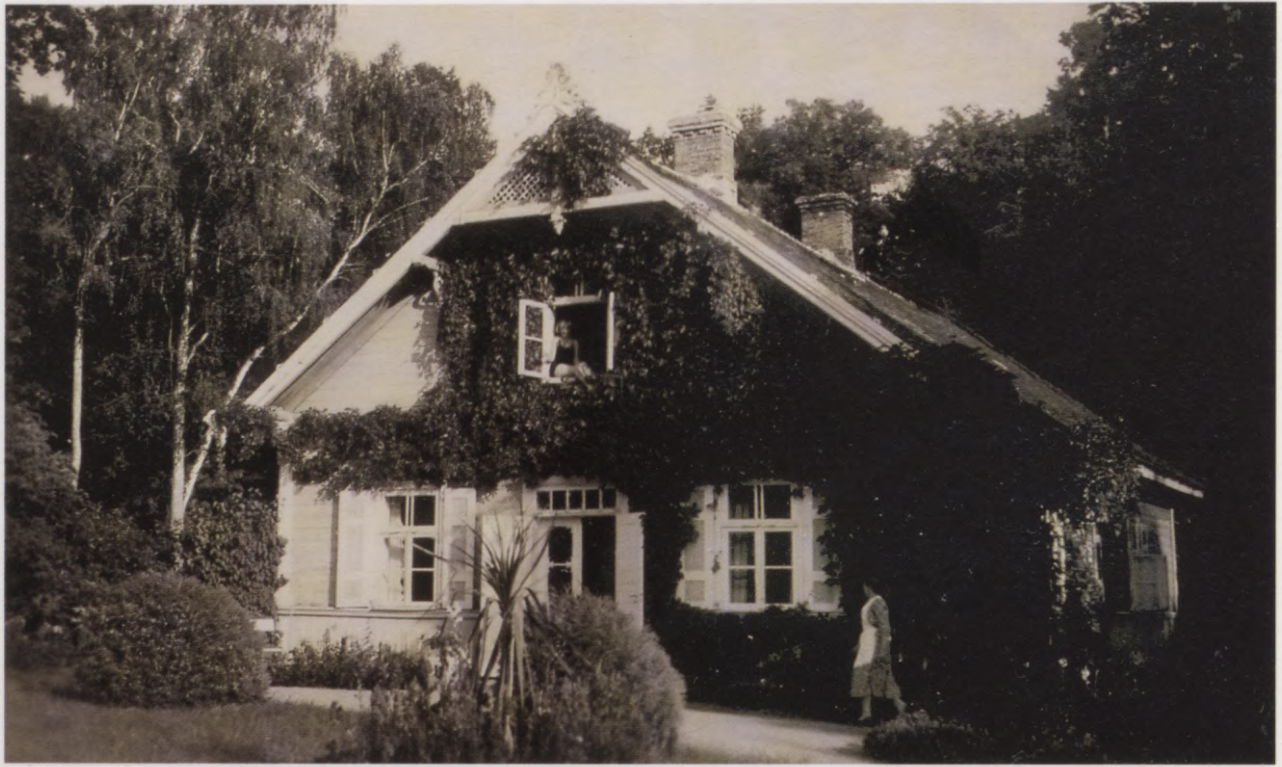
15. Jumpravmuižas dārznieka māja. 1930. gadu foto. Das Gärtnerhaus in Jungfernhof. Foto 1930er Jahre.