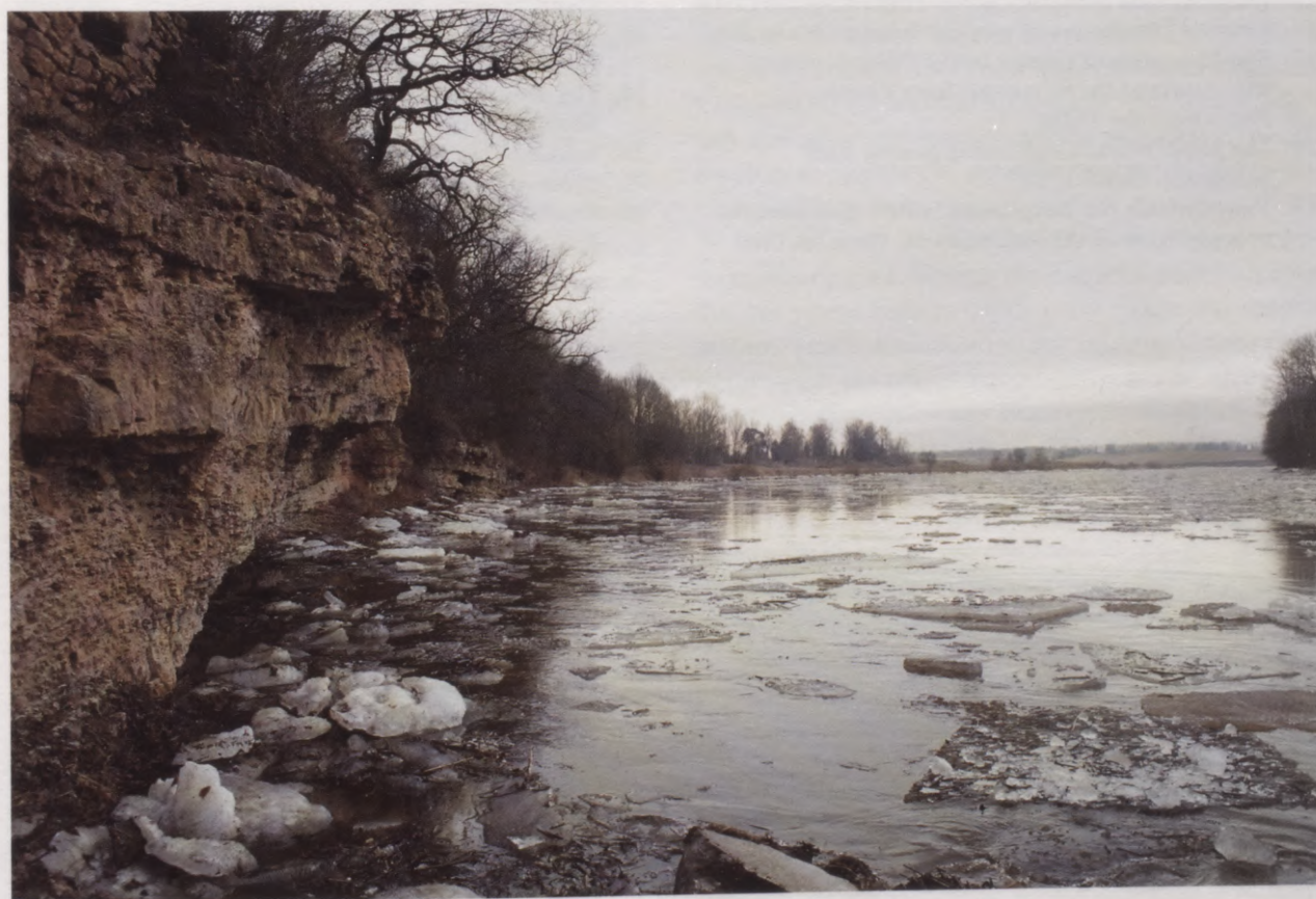
40. Ledus iešana Lielupē pie Jumpravmuižas. 2004. g. foto. Eisgang auf der Aa bei Jungfernhof. Foto 2004.

Despite the ravages of time the remaining buildings of the manor keep telling stories about the events of remote past whereas the Jumpravmuiža Park continues inviting travellers from far and near, demonstrating the designers' talent and peculiar understanding of the beauty of nature.