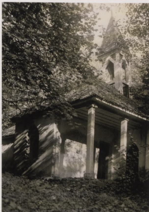
36. Jumpravmuižas parka kapela. 1920. gadu foto. Kapelle in der Parkanlage von Jungfernhof. Foto 1920er Jahre.