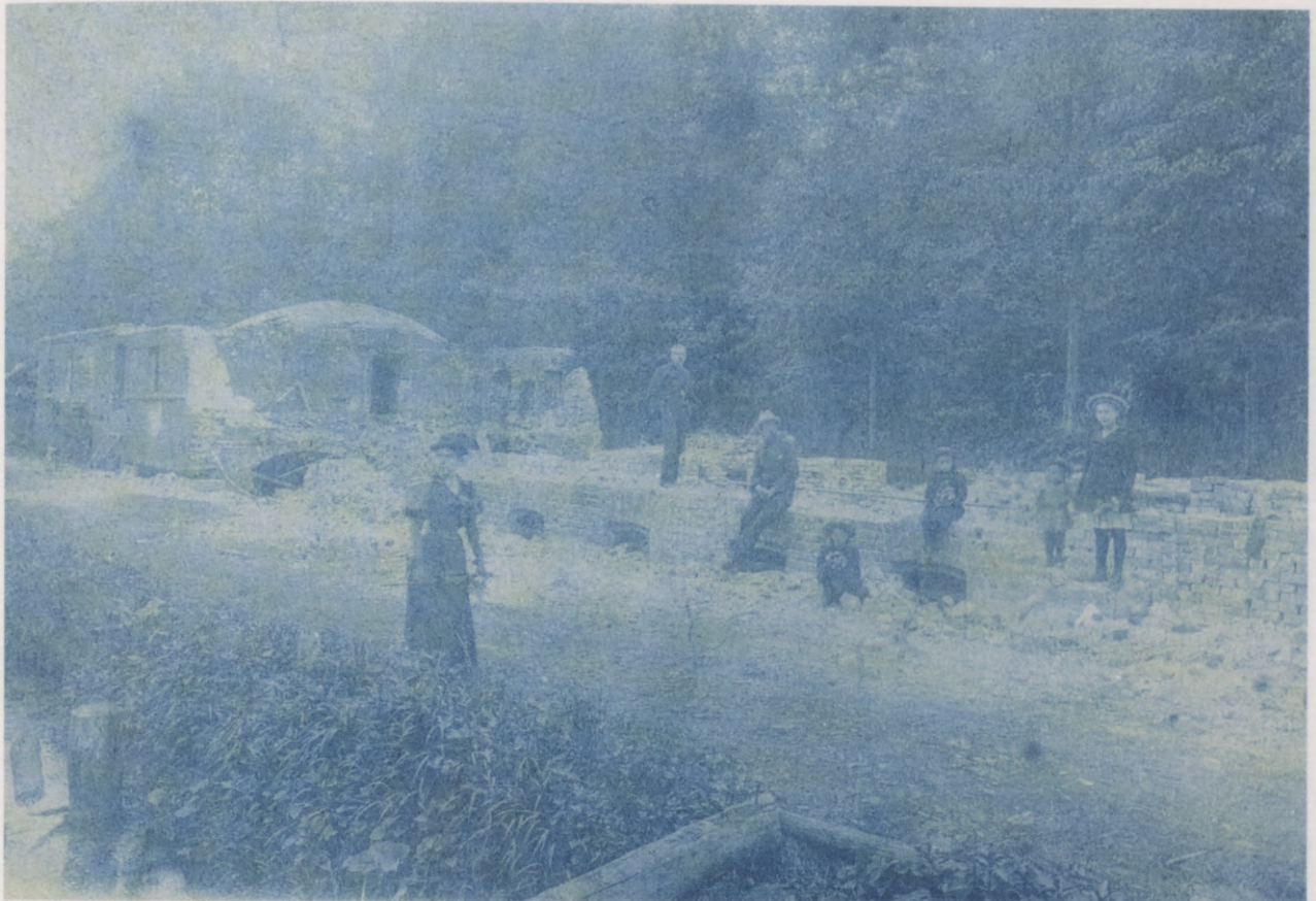
11. 1878. gadā nodegušās kungu mājas drupas Jaunjumpravmuižā. 1890. gadu 2. puses foto. Ruine des 1878 abgebrannten Herrenhauses in Neu-Jungfernhof. Foto 2. Hälfte 1890er Jahre.

un Rundālē praktizējušais itāļu izcelsmes arhitekts Pjetro Pončini. (Visādā ziņā celtnes veidols uzrāda zināmu radniecību tepat Lielupes pretējā krastā Pončini projektētajai Bornsmindes pils pārbūvei un netālajos Priedišu kapos celtajai Šepingu dzimtas kapličiai.) Savukārt ēkas cēlēji visdrīzāk bija paši muižas amatnieki. Tāds varētu būt kaut vai 1812. gada augustā sakarā ar meitas kristīšanu Bauskas vācu draudzes metrikās minētais mūrnieks Štrauchs no Jumpravmuižas Kaulenkroga. 59