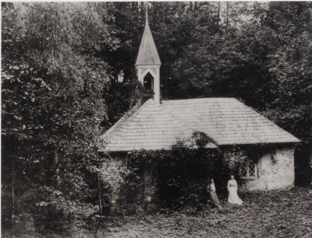
34. Kapela Jumpravmuižas parkā. 20. gs. sākuma foto. Kapelle in der Parkanlage von Jungfernhof. Foto Anfang 20. Jh.