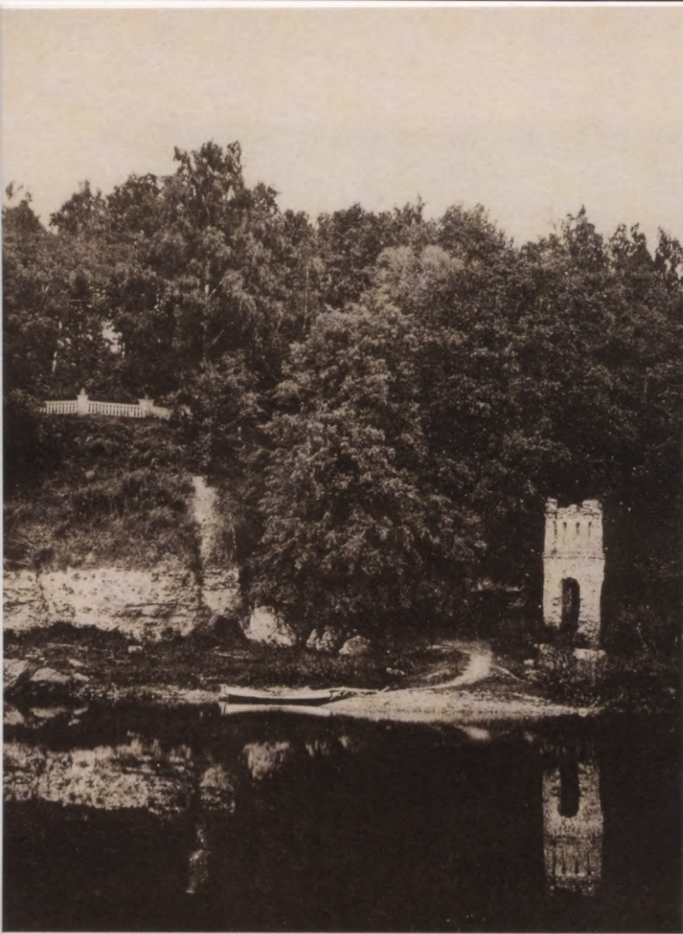
19. Skats uz Jumpravmuižas parka gravu un skatu laukumu no Lielupes pretējā krasta. Foto ap 1880. g.

Blick auf die Schlucht in der Parkanlage zu Jungfernhof und auf den Aussichtspunkt vom anderen Ufer der Aa her. Foto um 1880.