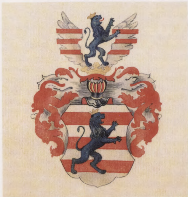
2. Lidinghauzenu-Volfu dzimtas ģerbonis. Zīmējums no J. E. Neimbtsa Kurzemes ģerboņu grāmatas manuskripta, 18. gs. otrā puse.

Wappen der Familie von Lüdinghausen-Wolff. Zeichnung im Manuskript von J. E. Neimbt "Wappenbuch des Kurländischen Adels". 2. Hälfte 18. Jh.