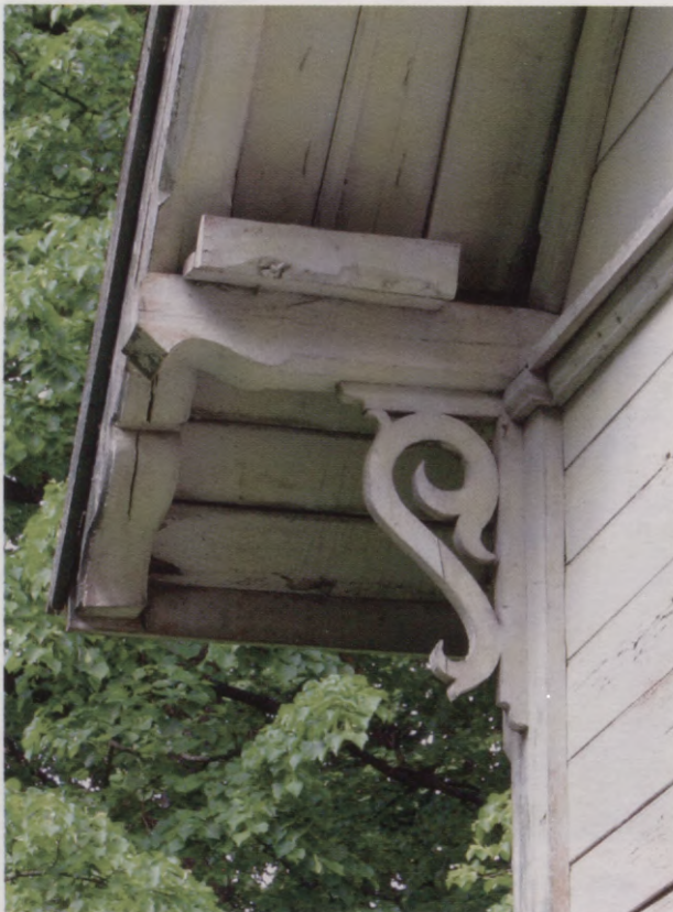
16. Jumpravmuižas dārznieka mājas fragments. 2005. g. foto. Fragment des Gärtnerhauses in Jungfernhof. Foto 2005.

errichtet wurde. Der Bau wurde auf eine sehr primitive Art ausgeführt, d. h. die beiden Teile wurden weder in Architektur noch in Ausstattung aufeinander abgestimmt. Der neu erbaute Teil des Hauses blieb sogar unverputzt. An der Giebelseite des Anbaues ist die Linie der neuen Mauerung gut zu erkennen, so dass man leicht feststellen kann, dass ursprünglich das Dach des Anbaues flacher war.