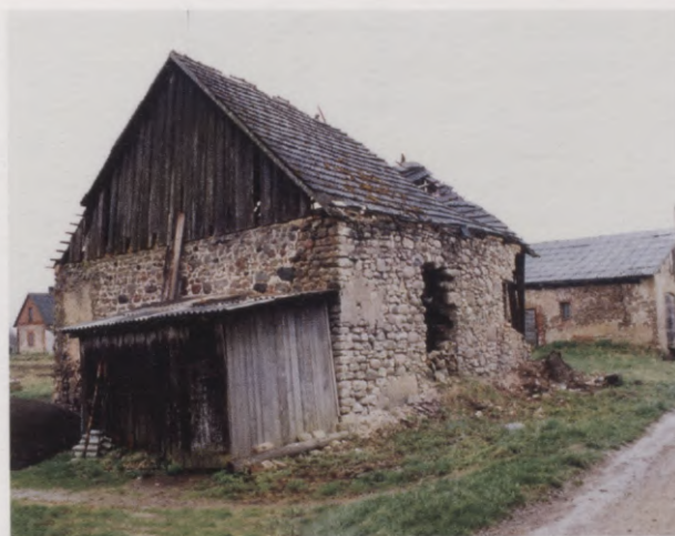
10. Viena no Vecjumpramuižas kompleksa ēkām mūsdienās. 2004. g. foto.

Ein Gebäude des früheren Komplexes Alt-Jungfernhof in unserer Zeit. Foto 2004.