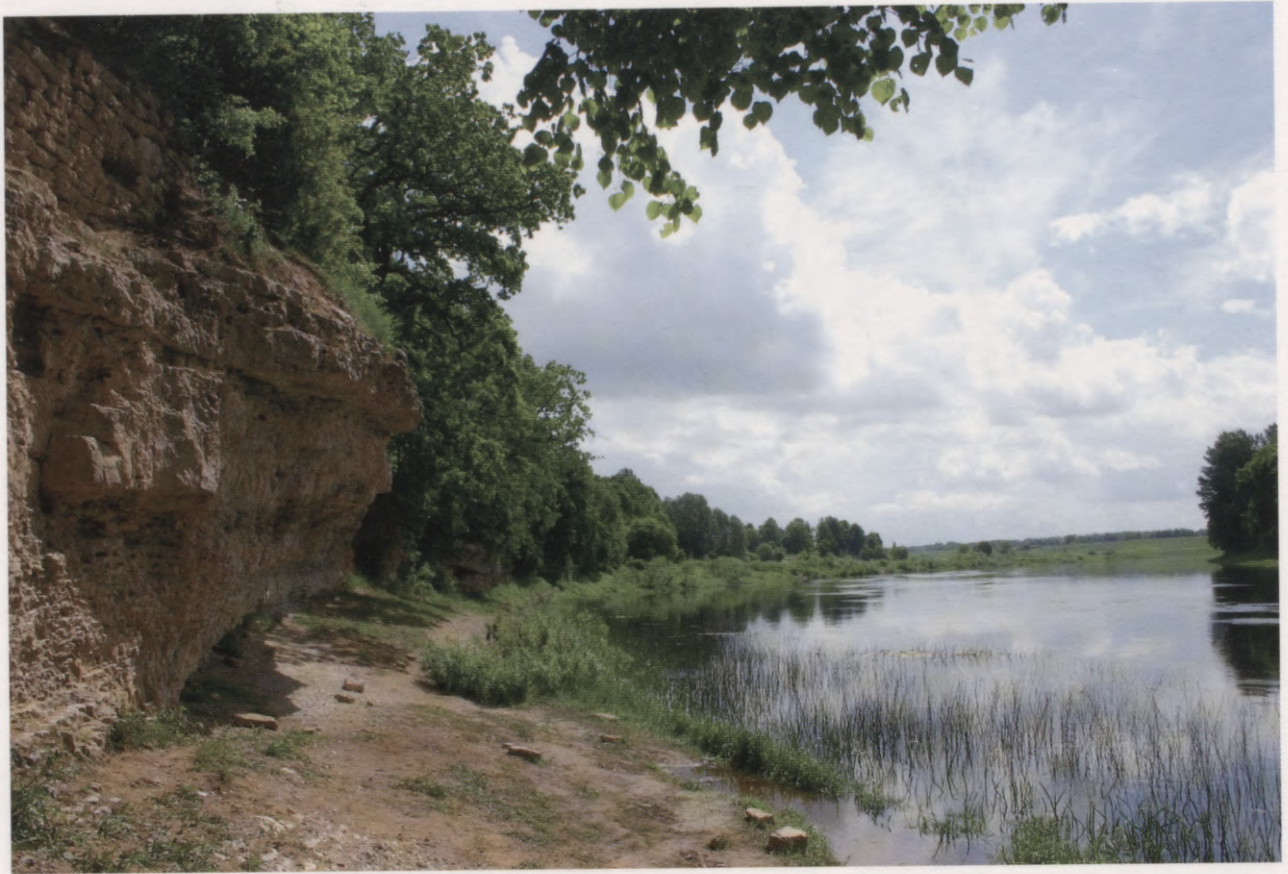
26. Lielupe pie Jumpravmuižas. 2005. g. foto. Die Aa an Jungfernhof. Foto 2005.