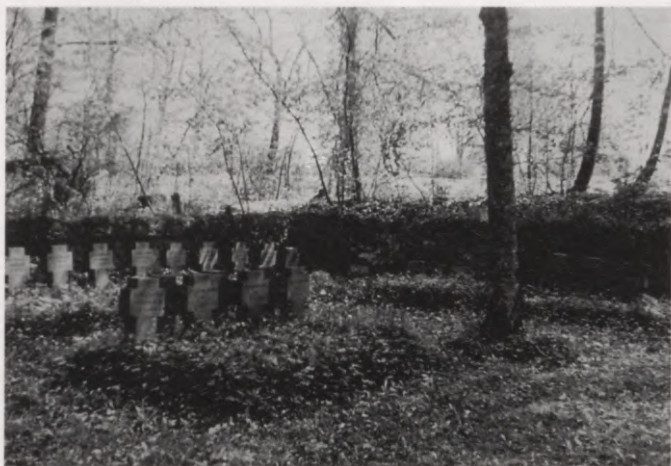
31. Pirmā pasaules karā kritušo vācu karavīru kapi Jumpravmuižas parkā. 1930. gadu foto. Friedhof deutscher Soldaten. Foto 1930er Jahre.