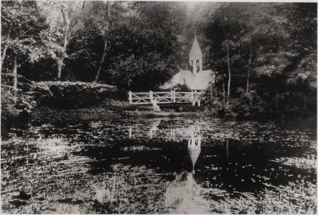
32. Skats uz kapelu un tiltiņu pāri dīķim. 20. gs. sākuma foto. Blick auf die Kapelle und Brücke über den Teich. Foto Anfang 20. Jh.