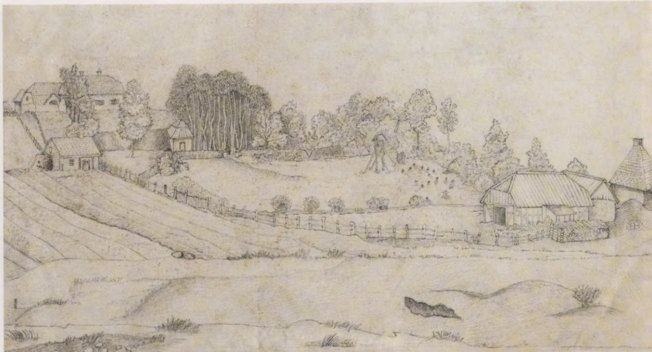
9. Skats uz Vecjumpravmuižas centru. 19. gs. beigu zīmējums.

Blick auf das Zentrum von Alt-Jungfernhof. Zeichnung, Ende 19. Jh.