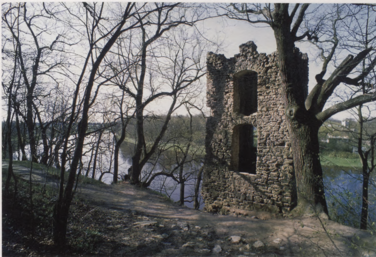
24. Skats uz mākslīgo pilsdrupu torni no parka puses. 1991. g. foto. Blick auf den Turm der künstlichen Burgruine von der Parkseite her. Foto 1991.