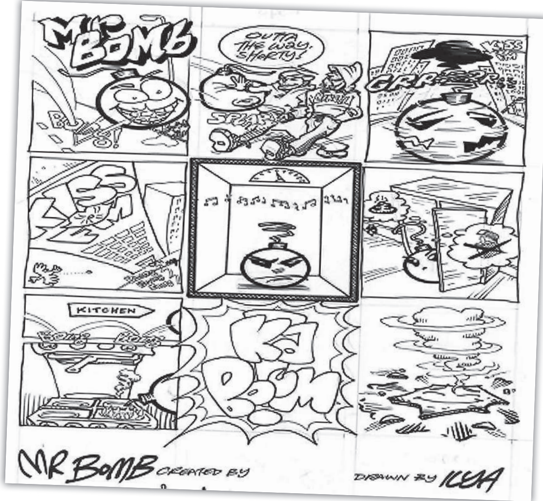
Komikss "Misters Bomba"