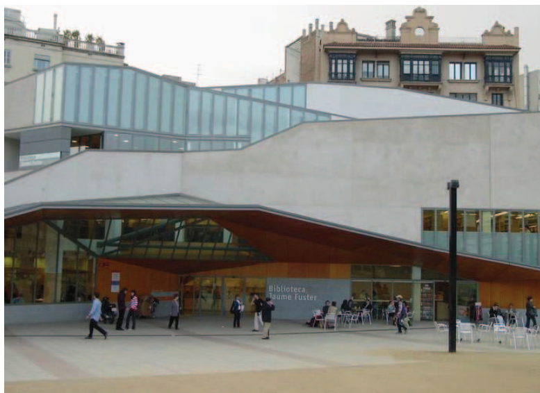
Jaume Fuster bibliotēka ar plašo priekšlaukumu

Bibliotēkas ēkā dominē gaiši apdares materiāli — baltas sienas, gaiši kļavas koka apdares paneļi uz sienām un gaišas koka mēbeles. Grāmatas kontrastējoši izceļas uz vienmērīgā interjera krāsu toņa, taču dominējošā koka faktūra palīdz saglabāt mājīgo un mierīgo atmosfēru. Balti akustiskie griestu paneļi un grīdas