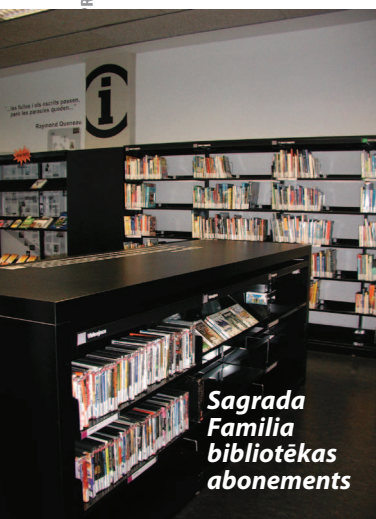
Sagrada Familia bibliotēkas abonements

Bibliotēkas interjerā dominē melna grīda un grāmatu plaukti košās krāsās ar melniem grāmatu plauktu gala paneļiem, kas kontrastē ar baltajām sienām. Grāmatu plauktu izvietojums ir racionāls un viegli pārskatāms. Plānojot bibliotēkas funkcionālo iekārtojumu, liela uzmanība pievērsta klusu, noslēgtu lasītāju vietu izveidei lielajās abonementa telpās. Lasītāju galdi iekļauti starp grāmatu plauktiem, lieltelpā radot vairāku mazu telpu sajūtu. Bērnu literatūras nodaļu atdzīvina krāsainas mēbeles un grīdas segums.