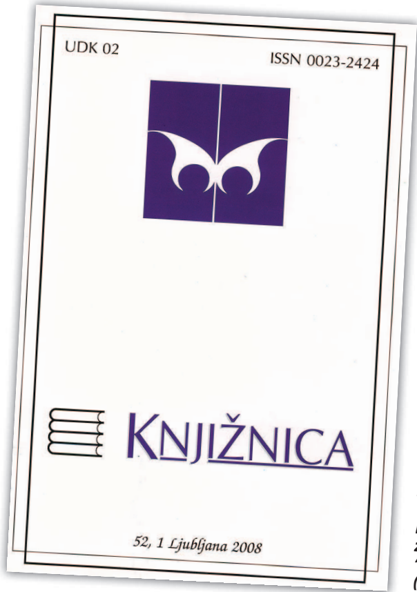
Vienīgais Slovēnijas zinātniskais žurnāls bibliotēku un informācijas zinātnē — “Knjižnica” (“Bibliotēka”)

Apvienības mērķis ir veicināt bibliotēku darbu, pārstāvēt bibliotēku darbinieku intereses un sekmēt profesionālo integritāti, veicināt un atbalstīt tālākizglītību, nostiprināt sapratni un zināšanas par Slovēnijas rakstītā kultūras mantojuma saglabāšanas nozīmību.