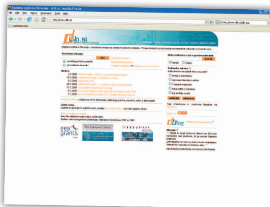
Slovēnijas digitālā bibliotēka