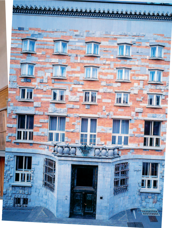
Nacionālā un universitātes bibliotēka Lūbjānā

1921.gadā bibliotēka ieguva tiesības uz visiem Dienvidslāvijas karalistes izdevumu bezmaksas obligātajiem eksemplāriem.