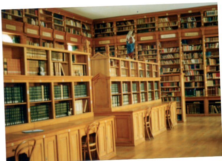
Kartēziešu klostera bibliotēka Pleterjē

Garīgā semināra bibliotēkā ( Semeniška knjižnica , http://semenisce-lj.rkc.si/main.htm?page=predstavitev/knjižnica.htm ) Ļubjanā, Kapučiņu klostera bibliotēkā Krško, Franciskāņu klostera bibliotēkā Ļubjanā un Kartēziešu klostera bibliotēkā Pleterjē.