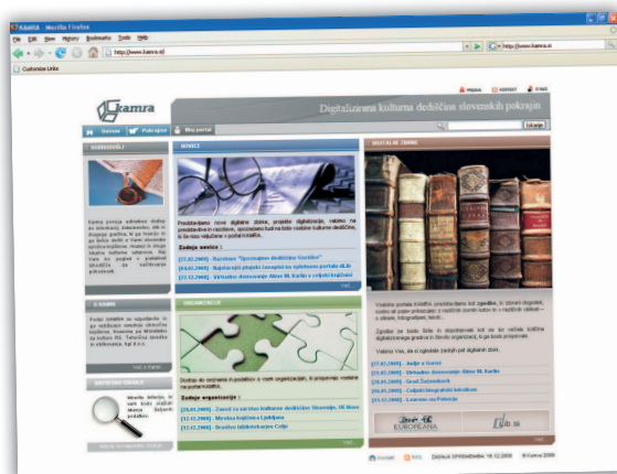
Reģionālais portāls KAMRA

ciālistu vajadzībām medicīnā, kultūrā, rūpniecībā, tirdzniecībā un valsts pārvaldē. 15 Speciālās bibliotēkas ir apjomā nelielas, taču saturiski nozīmīgas.