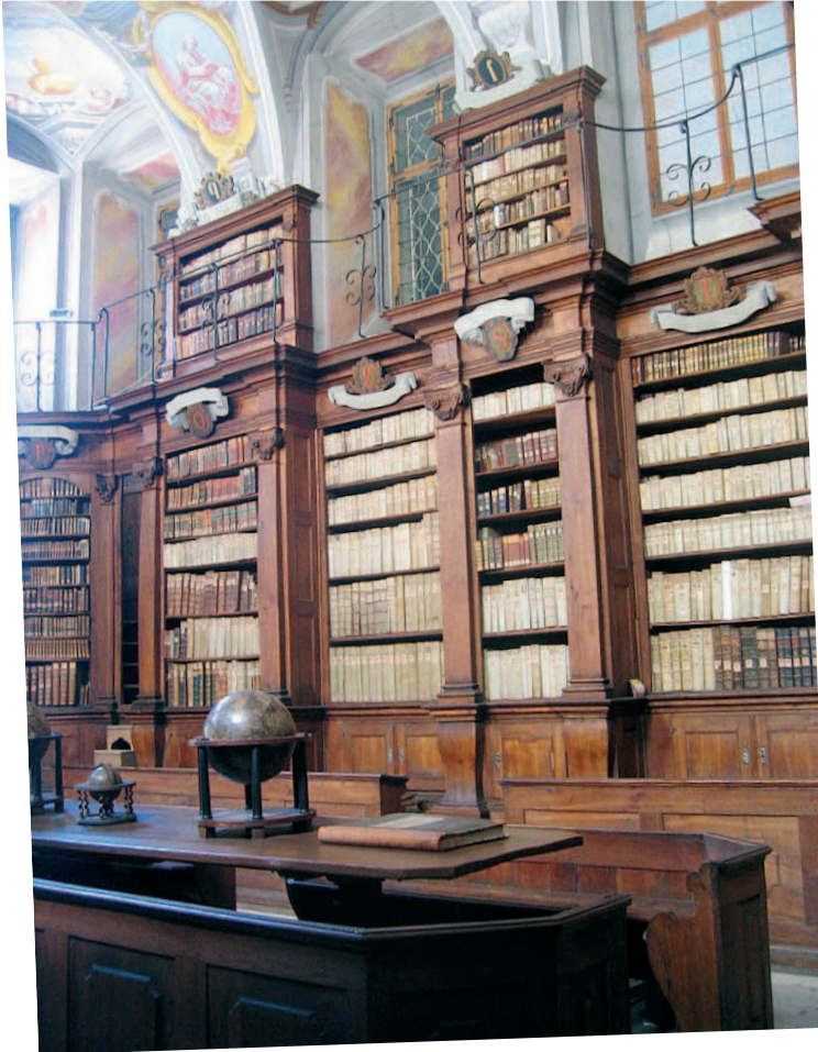
Garīgā semināra bibliotēka Ļubjanā