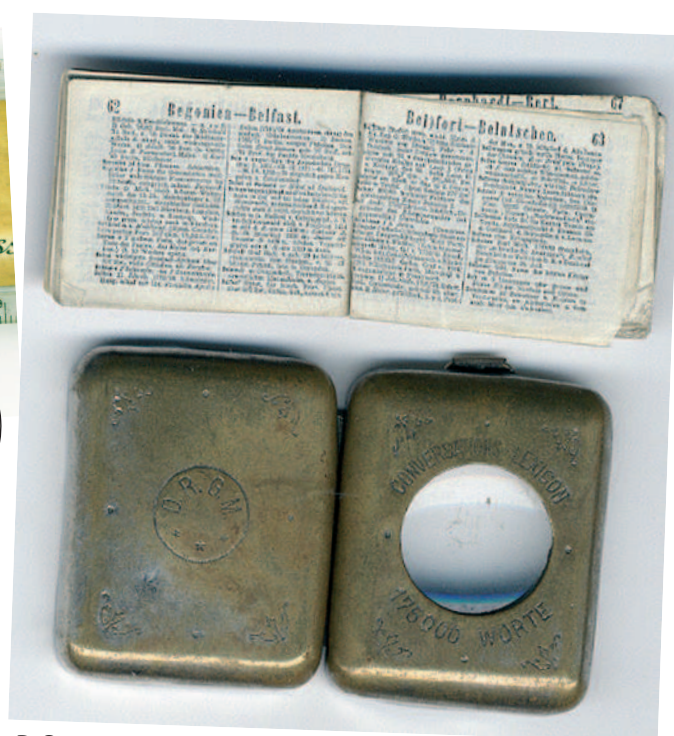
D.Sandera "Konversationslexikon" metāla kārbīnā ar lupu