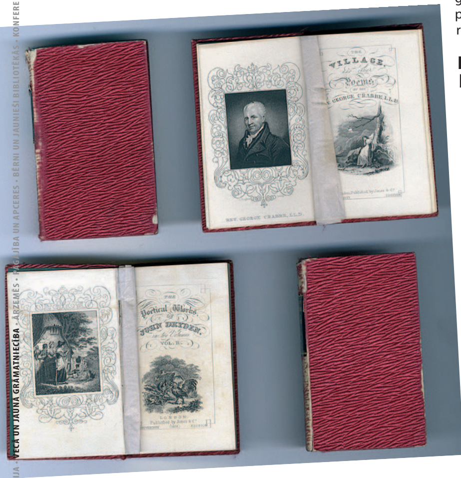
1831.gadā izdotā "Ceļojumu bibliotēka"

ir vērtīgs un interesants ir ermoņikas veidā izgatavots mākslas darbu reprodukciju albumiņš metāla futrālī,