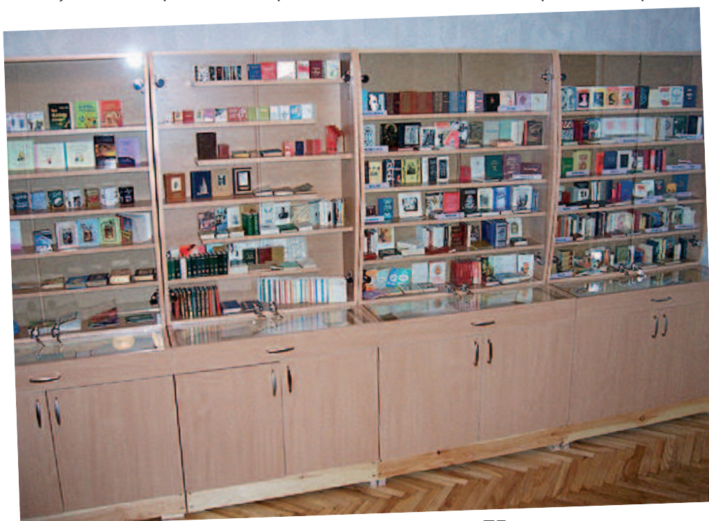
Cēsu Centrālās bibliotēkas miniatūrgrāmatu izstāde

Miniatūrgrāmatas saista galvenokārt kolekcionāru un grāmatu mīļotāju uzmanību. To vidū ir cilvēki, kurus īpaši interesē grāmatu ārējā forma. Psiholoģiski ļabi saprotama un pamatota ir īpašā attieksme pret ma-