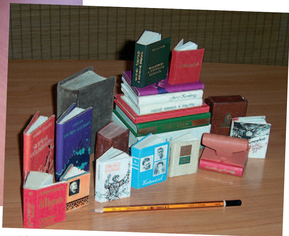
Cēsu Centrālās bibliotēkas miniatūrgrāmatas

zu grāmatu kā priekšmetu — tā saistās ar bērnības atmiņām, saudzīgumu un mīlumu pret mazu un aizsargājamu objektu. Tieši šādā psiholoģiskā kontekstā mazas grāmatiņas daudzu cilvēku apziņā ieguvušas īpašu statusu, reizēm kļūstot par talismanu. Grāmatas mazais izmērs rosina tās izgatavotājus uz fantāzijas lidojumu, spēli, tehniskiem eksperimentiem ar formu un mākslinieciskiem paņēmieniem. Tāpēc miniatūrizdevumiem nereti ir izsmalcināta ārējā apdare. Mazo grāmatu krājēju uzmanību piesaista arī to augstvērtīgā poligrāfiskā kvalitāte.