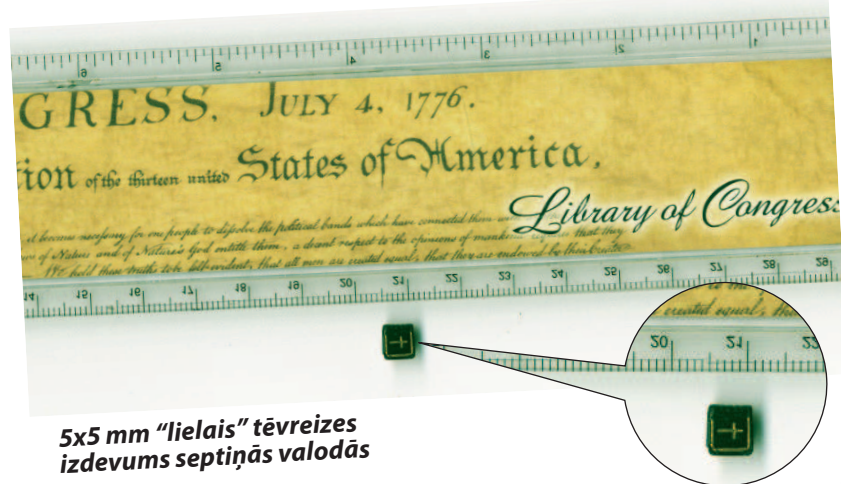
5x5 mm "lielais" tēvreizis izdevums septiņās valodās