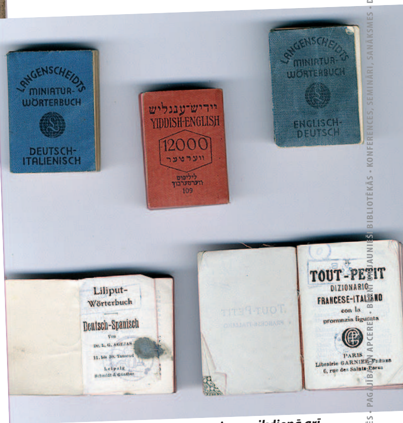
Miniatūrvārdnīcas ir ērti izmantojamas ikdienā arī mūsdienās

kurā ievietota arī lupa. Latviešu grāmatniecības vēstures tradīcijas atspoguļo trīs kastītes, kurās atrodas Krišjāņa Barona "Latvju dainu" sējumiņi, bet Vladimira Iljiča Ņeņina darbu maza formāta grezumizdevumi apliecina padomju varas nesēju cieņu pret valsts dibinātāju. Mazformāta grāmatu vidū netrūkst praktiskas ievirzes literatūras, tostarp kalendāru. Kopumā LAB no kopējā krājuma izdalītas apmēram 30–40 miniatūrgrāmatas.