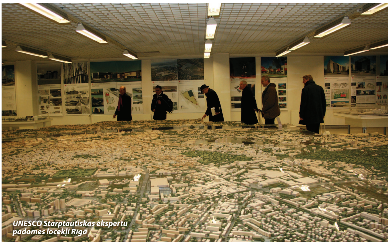
UNESCO Starptautiskās ekspertu padomes locekļi Rīgā

UNESCO Starptautiskā ekspertu padome, kurā ir deviņi bibliotēku, arhīvu un kultūras nozares vadošie speciālisti no Zviedrijas, Dānijas, Norvēģijas, Somijas, Igaunijas, Krievijas, Nīderlandes, Francijas un ASV,