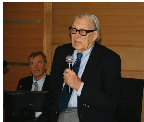
Arhitekts Gunārs Birkerts