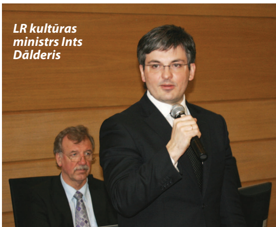
LR kultūras ministrs Ints Dālderis