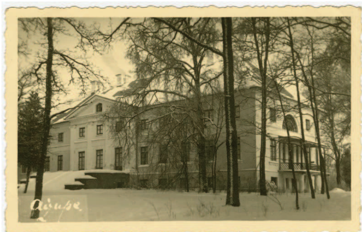
Vānes pagasta Aizupes muiža agrāk...

Šobrīd projektā iesaistījušies 50 partneri. Taču jāņem vērā, ka sadarbības tīkls sazarojas vēl tālāk, jo