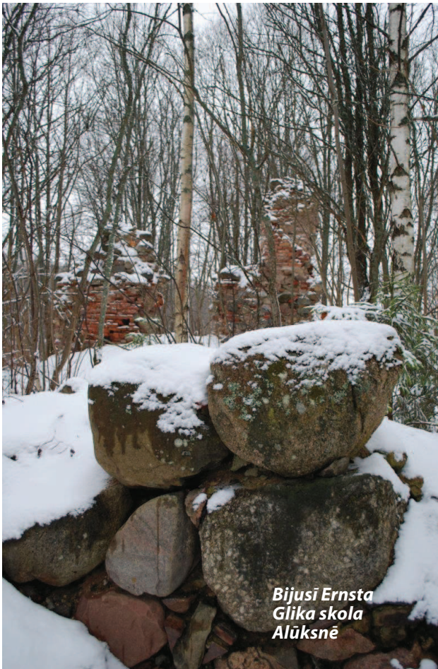
Bijusī Ernsta Glika skola Alūksnē

Projektā "Zudusī Latvija" Latvijas novadu zudušās kultūrvēsturiskās vērtības tiek atspoguļotas ne tikai senajos, bet arī mūsdienu attēlos. Projekta ietvaros tika organizētas vairākas ekspedīcijas, lai iemūžinātu projekta "Zudusī Latvija" objektus šodien. Šo ekspedīciju laikā, vērojot situāciju kultūras mantojuma saglabāšanas jomā, kļuva skaidrs, ka svarīgi ir veikt arī šobrīd bojā ejošu kultūras vērtību fotofiksāciju, jo ar laiku tās var tikt neatgriezeniski zaudētas. To seminārā "Latvijas kultūrvēsture digitālizācijas fokusā: Eiropas dimensija" 2010.gada 6.oktobrī uzsvēra arī projekta partneris,