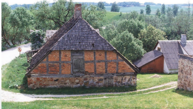
Sudmalu ūdenszirnavas Pūrē