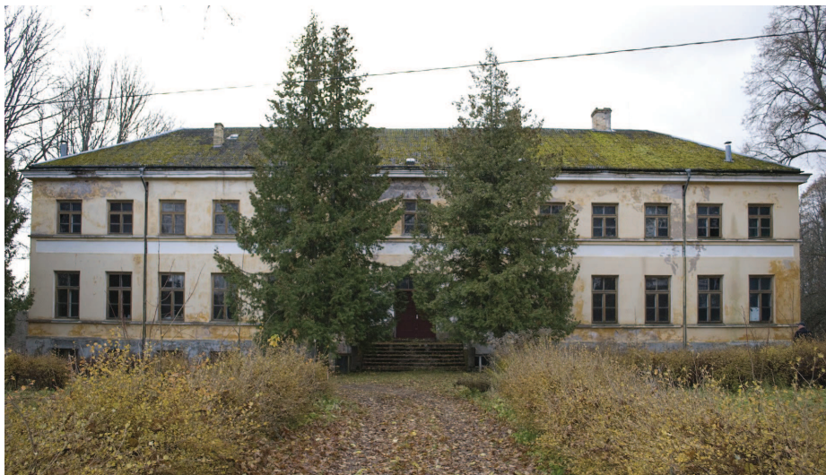
Struteles muiža, tajā vēl aizvien rodama Krišjāņa Barona piemiņas plāksne un kāpņu parapets