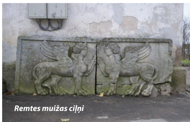
Remtes muižas cilņi

2011.gada 24.februārī Latvijas Nacionālās bibliotēkas (LNB) Jaunākās periodikas lasītavā un izstāžu zālē plašāka sabiedrība tika iepazīstināta ar Latvijas Nacionālās digitālās bibliotēkas “Letonica” (LNDB) projekta “Zudusī Latvija” pirmajiem rezultātiem — tika atklāts portāls “Zudusī Latvija” un ceļojošā izstāde “Zudusī darbīgā Latvija”.