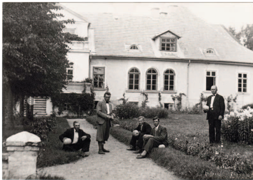
Pūres muiža ap 1930.gadu...

Projekts "Zudusī Latvija" ir viens no Latvijas atmiņas institūciju veiksmes stāstiem digitalizācijas jomā — tas guvis ļoti lielu sabiedrības ievēribu un rosinājis neticami daudz cilvēku aizrautīgi iesaistīties Latvijas pagātnes restaurācijā. Pateicoties tam dienasgaismu ieraudzījuši neskaitāmi unikāli objekti un no aizmirstības paglābtas vērtīgas pagātnes liecības. Projekta ideja aizrāvusi pat tos, kas līdz šim no digitalizācijas atturējušies, un rosinājusi gan bibliotēku, gan muzeju un citu institūciju aktivitāti savu resursu digitalizēšanā, tādējādi veidojot jaunus, interesantus un vērtīgus informācijas resursus.