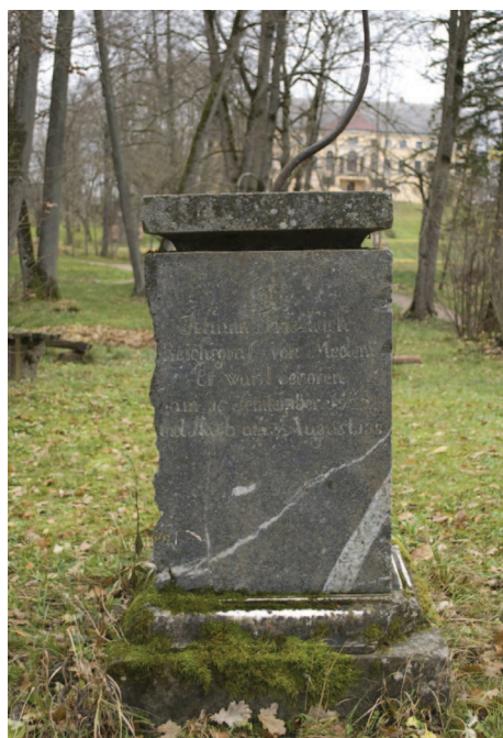
Čūsku vāzes pamatne Remtes muižā