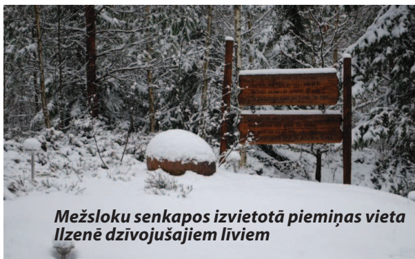
Mežsloku senkapos izvietotā piemiņas vieta Ilzenē dzīvojušajiem līviem

Informācijas bagātais resurss ir nozīmīgs atbalsts tradicionālo mācību iespēju paplašināšanā skolēniem un studentiem. Par projekta saturu un sadarbības iespējām jau ir ieinteresējies Valsts izglītības satura centrs. Sadarbības mērķis — iekļaut vēsturiskās fotogrāfijas Latvijas vēstures mācību materiāla saturā. Plānots uzrunāt Vēstures skolotāju biedrību par iespējamo skolēnu iesaistišanu projekta informācijas izpētē, kas būtu kā papildu izglītības iespēja Latvijas vēstures apgūvē. Unikālais vizuālais mantojums, kas