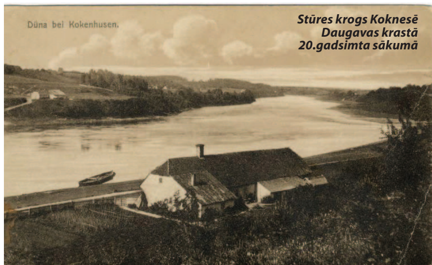
Dūna bei Kokenhusen.

“Zudusī Latvija” kolekcijā ir daudz Latvijas baznīcu, muižu attēlu. Gana plašs ir attēlu loks, kuros redzamas mājvietas un lauku cilvēku darbi, piemēram, labības kulšana, ražas vai siena novākšana, lauku apstrāde. Šobrīd kolekcijā ietverta Latvijas pilsētu topos rindojas šādi: Rīga, Liepāja, Jelgava, Cēsis, Kuldīga, Jūrmala, Ventspils, Alūksne, Limbaži. Portālā ievietotas arī viena objekta vairākas fotogrāfijas un atklātnes, tādējādi gūstams plašāks skatījums, piemēram, Ventspils bibliotēkas iesniegtie attēli, kuros atainota Ventspils osta, ļauj to aplūkot no dažādiem skatpunktiem. Latvijas kultūras iestādes un iedzīvotāji turpina aktīvi iesaistīties kolekcijas “Zudusī Latvija” veidošanā, portālā ienāk arvien jauni un jauni attēli.