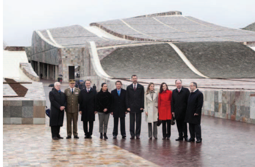
Galīsijas kultūras pilsētiņas atklā- šana