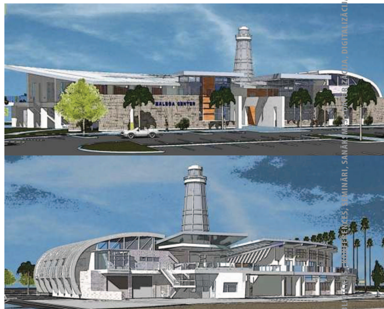
Balboa Bičas filiāles projekta skices

2011.gada sākumā ASV tiešsaistes medijos saasinājās diskusija par bibliotēkām bez (iespīestajām) grāmatām ( bookless library ). To izraisīja Ņūportas Bičas (Kalifornija, ASV) pašvaldības paziņojums, ka 2014.gadā tā atvērs publisku bibliotēku bez grāmatām. Jaunā bibliotēka atradīsies Balboa pussalā un tiks celta tagadējās, aptuveni 50 gadus vecās Balboa Bičas filiāles vietā. Modernās bibliotēkas apmeklētājiem būšot pieejami datori ar internetslēgumu un komfortabli divāni, taču iespīesto grāmatu un periodisko izdevumu tajā nebūs. Ja lasītāji vēlēšies lasīt tradicionālās grāmatas,