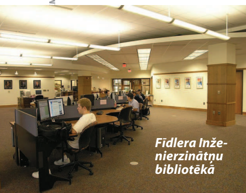
Fidlera Inženierzinātņu bibliotēkā

Pirmā akadēmiskā bibliotēka, kas ietvēra gandrīz vienīgi e-resursus, atvērtā 2000.gada oktobrī — Kanzasas Valsts universitātes ( Kansas State University ) Fidlera Inženierzinātņu bibliotēka ( Fiedler Engineering Library ). Tā ir universitātes bibliotēkas filiāle, kurā līdztekus elektroniskajiem resursiem rodama arī virkne iespiesto uzziņu izdevumu un žurnālu, kuriem nav elektronisko versiju. Bibliotēka izīrē klēpj datorus un piedāvā apgūt zinības vienu atsevišķās studiju kabinetēs. Bibliotēka aizņem 1858 m 2 , tajā strādā divi pilna laika darbinieki: direktore un bibliotekāra palīdzē.