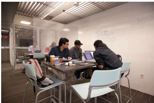
Lietišķo inženierzinātņu un tehnoloģiju bibliotēkā