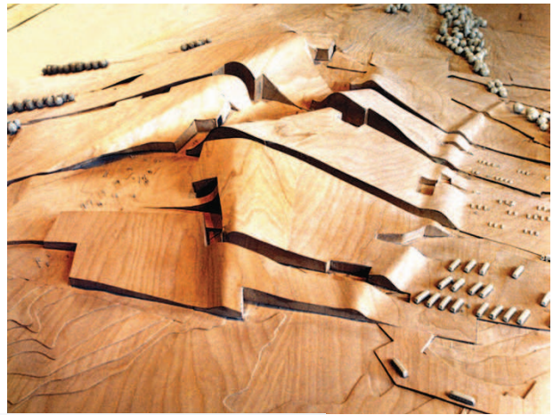
Galīsijas kultūras pilsētiņas makets

P.Eizenmana projektam veltītā ekspozīcija