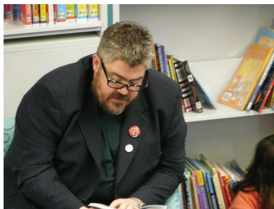
Fils Jupitus lasa Alana Milna pasaku

2011.gada 5.februārī Lielbritānijas Bibliotēku un informācijas nozares profesionāļu apvienība ( Chartered Institute of Library and Information Professionals, CILIP ), kā arī publisko bibliotēku aizstāvji un lasītāji rīkoja akciju "Saglabāsim mūsu bibliotēkas" ( Save Our Libraries Day , http://www.cilip.org.uk/get-involved/advocacy/public-libraries/pages/savelibrariesday.aspx ). Tās mērķis — popularizēt bibliotēku vērtības un pievērst sabiedrības uzmanību pašvaldību plāniem slēgt bibliotēkas vai būtiski samazināt to finansējumu. Ik dienu Lielbritānijas publiskās bibliotēkas apmeklē 750 000 cilvēku, taču katram iedzīvotājam tās izmaksā nepilnus 40 pensus nedēļā. Bibliotēkas palīdz pārvarēt ekonomisko