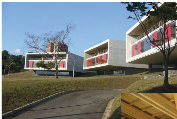
Komplekss "Biblioteca la Ladera"

Romero, Simon. Medellin's Nonconformist Mayor Turns Blight to Beauty. The New York Times [tiešsaiste]. July 15, 2007 [skatīts 2011.g. 1.sept.]. Pieejams: http://www.nytimes.com/2007/07/15/world/americas/15medellin.html