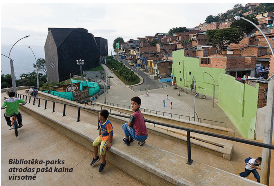
Bibliotēka-parks atrodas pašā kalna virsotnē

Bibliotēkas celtniecības materiālu klāstā bija turpat Kolumbijā bieži sastopamais akmens, interjeru daudz-