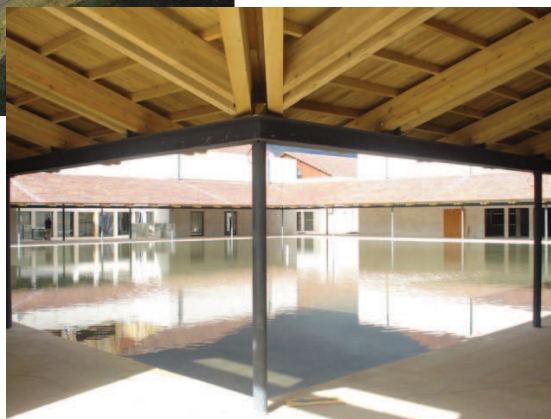
Āra baseini jaunajos Kolumbijas bibliotēku projektos ir iecienīts piedāvājums

Medeljina ir Kolumbijas rūpniecības centrs, kur darbojas tekstilrūpniecības, apģērhu, pārtikas, tabakas, lauksaimniecības mašīnu, tērauda, ķīmijas, cementa un mēbeļu ražotnes. Pilsētā mīt