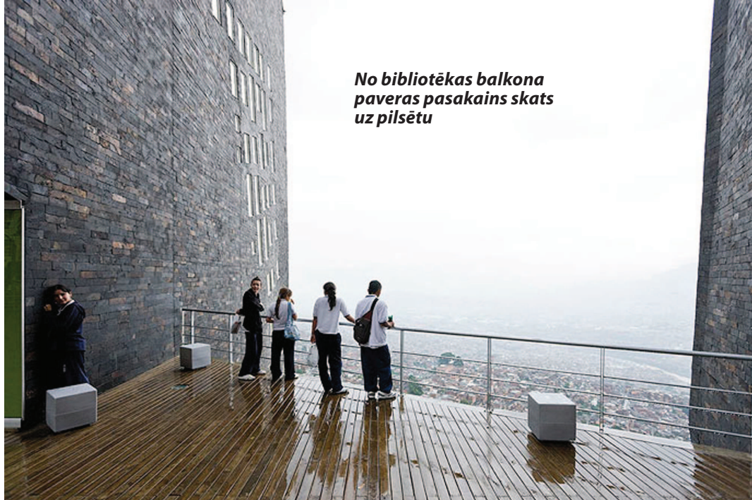
No bibliotēkas balkona paveras pasakains skats uz pilsētu

bibliotēkā ir plaši balkoni vai āra terases, no kurām paveras brīnišķīgs skats uz kalnaino pilsētu — tās iecienījuši gan vietējie iedzīvotāji, gan tūristi.