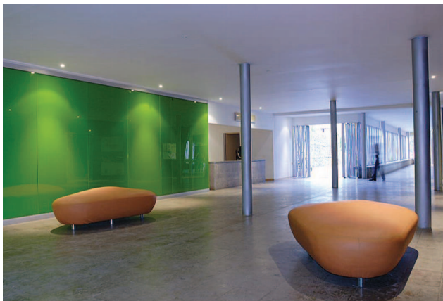
Spānijas bibliotēkas-parka iekšskats

ir ievērojama kolumbiešu arhitekta dēls.