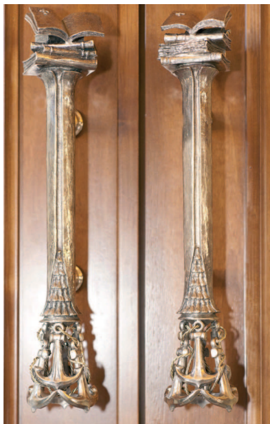
Vatikāna bibliotēkas stikla sienas durvis ar Farina ģerboni

R.Farina apvienotajā bibliotēkā un arhivāra amatā darbojās kopš 2007.gada, kad tika uzņemts arī kardinālu kolēģijā, taču bibliotē-