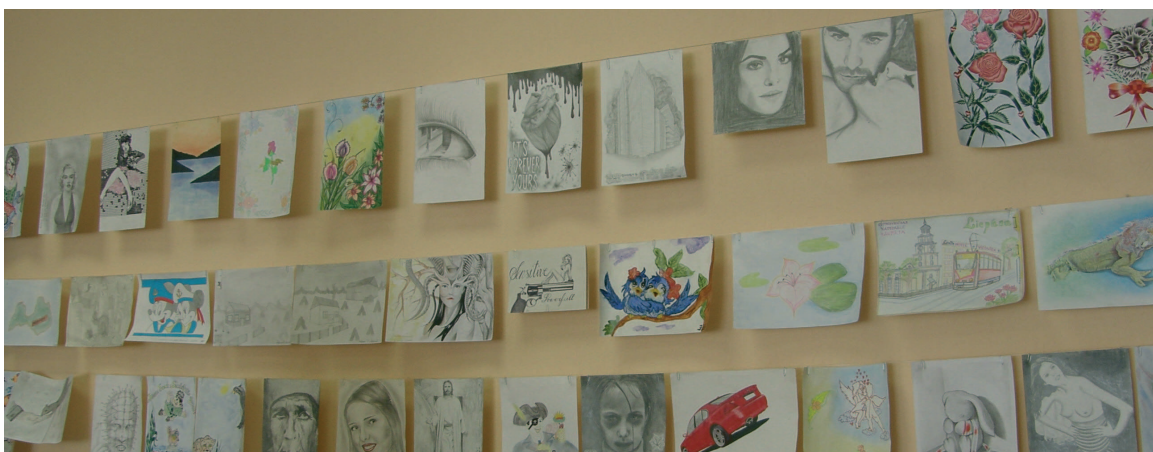
Ieslodzīto zīmējumu izstāde bibliotēkā