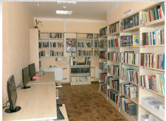
Datortelpa Brasas cietuma bibliotēkā

29.jūnijā man bija iespēja apmeklēt Latvijas un Šveices sadarbības programmas apakšprojekta “Rīgas Centrālās bibliotēkas ārējās apkalpošanas punkta izveide Brasas cietumā” noslēguma sanāksmes pasākumu Brasas cietumā.