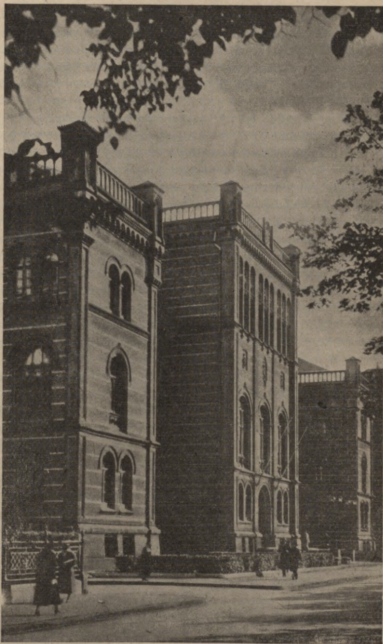
Latvijas Universitāte Rīgā.