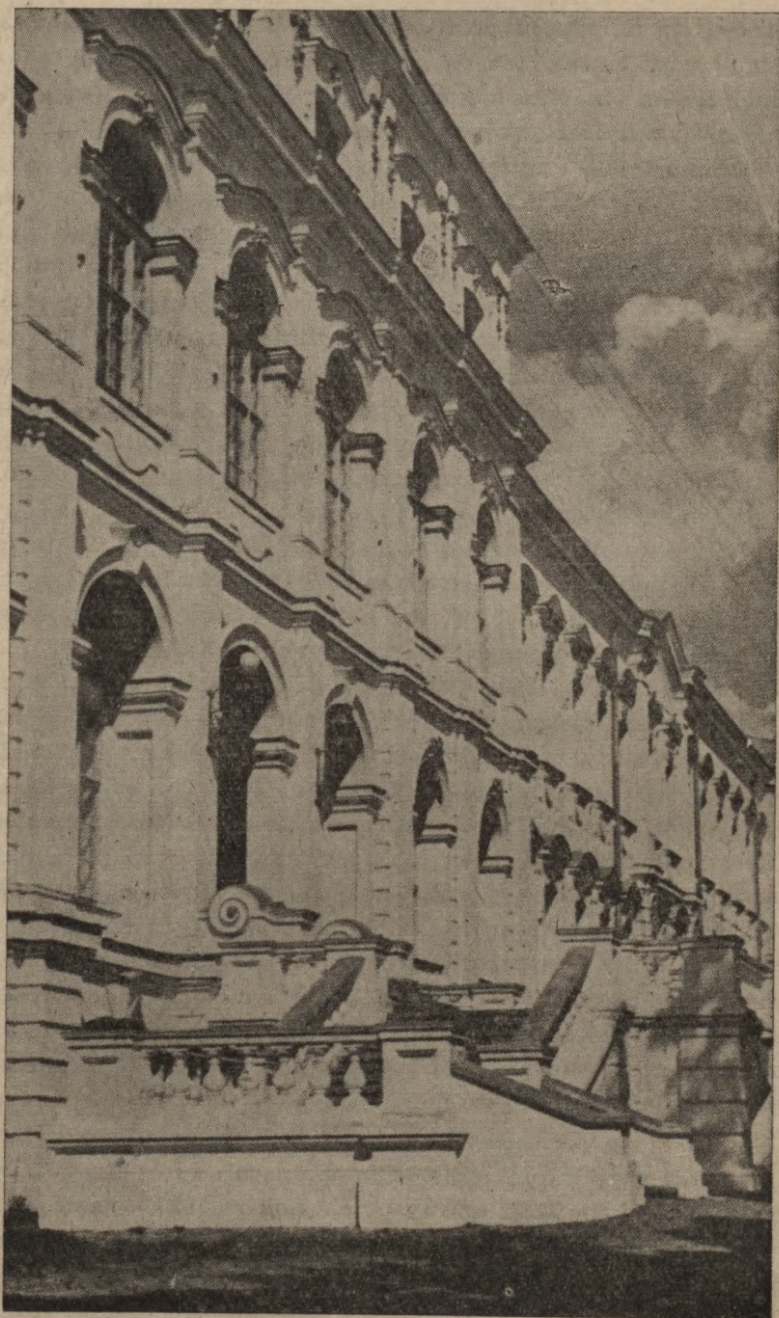
Latvijas Lauksaimniecības akadēmija