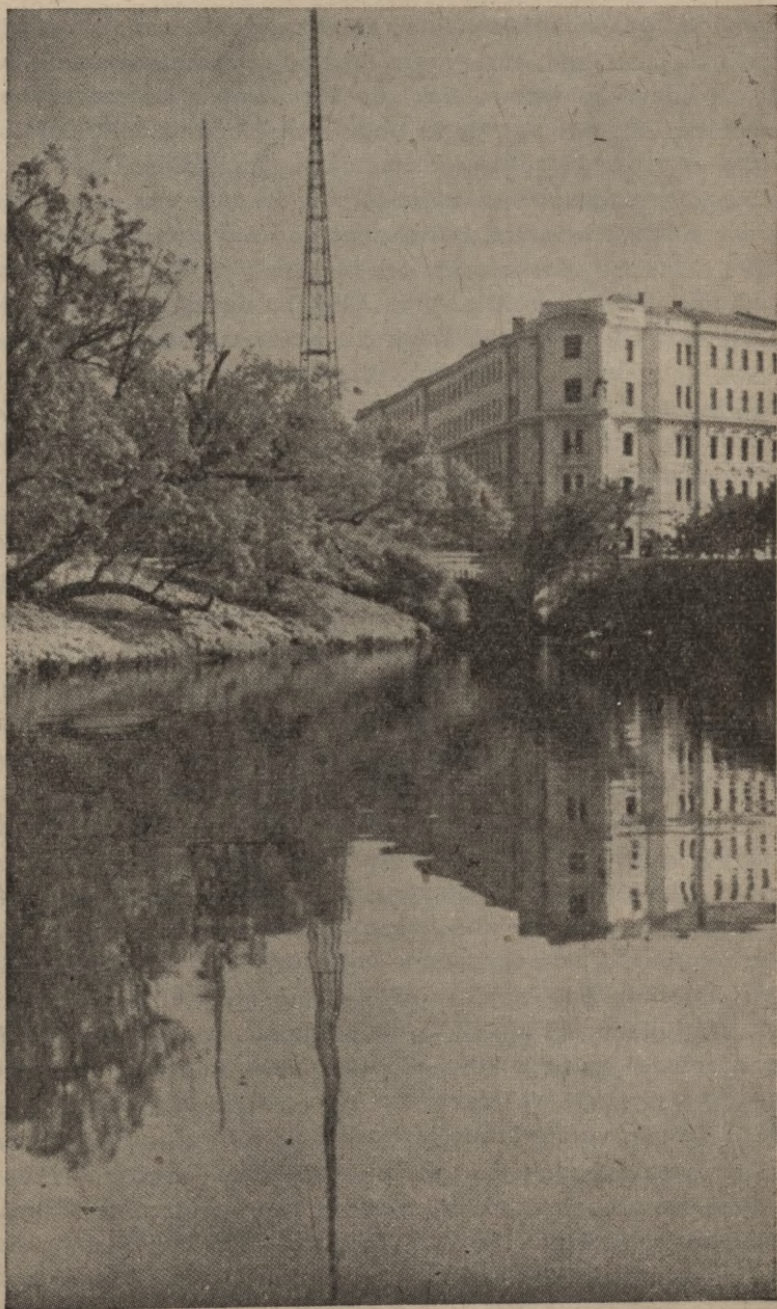
— Latvijas Pasta un telegrafa departaments Rīgā.