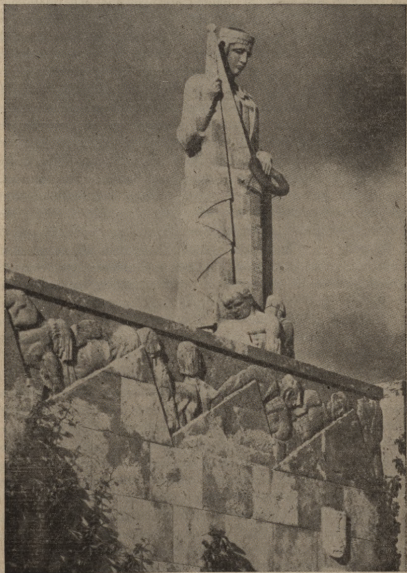
Mātes tēls Brāļu kapos Rīgā.