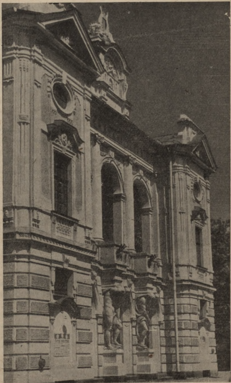
Latvijas Nacionālais teātris Rīgā.