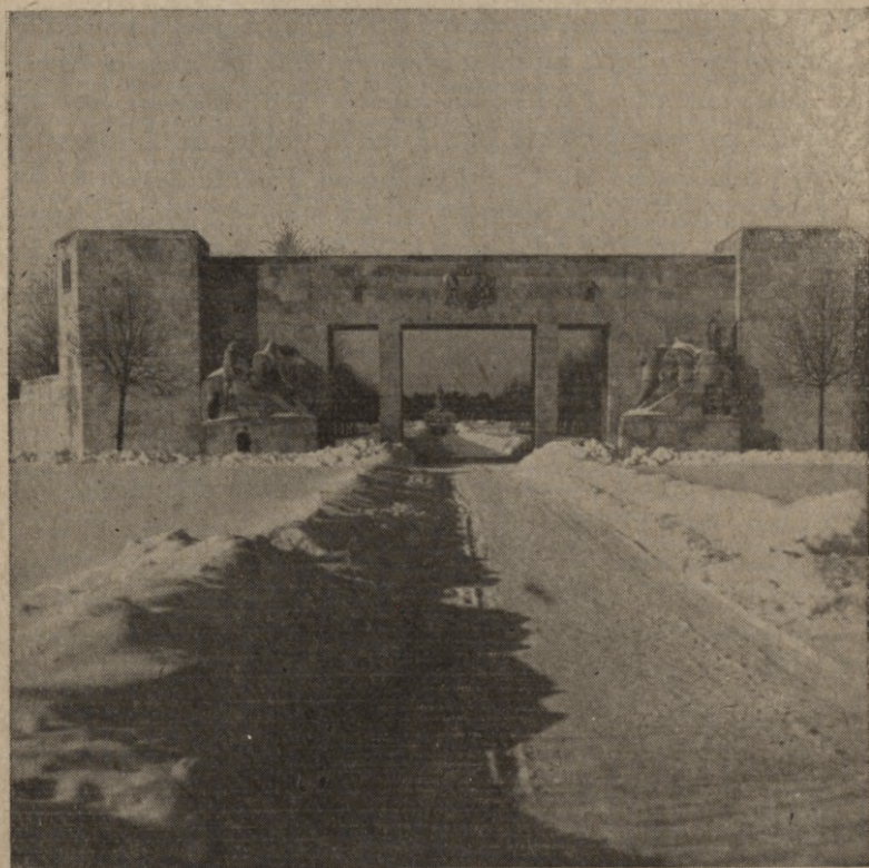
Ieja Brāļu kapos Rīgā.