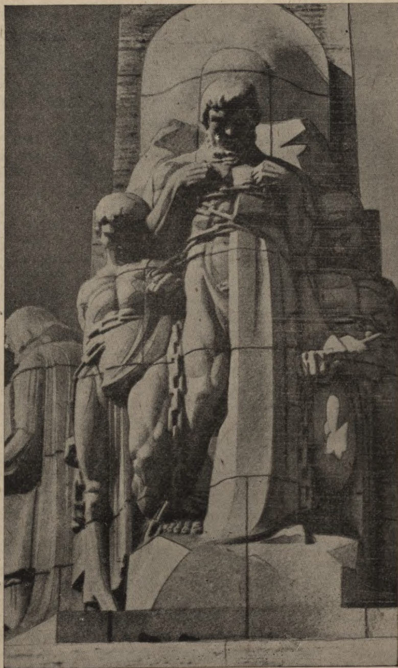
Brīvības pieminekļa Rīgā Kēžu rāvēju grupa.