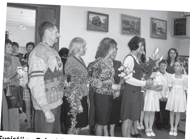
Sveicēji no Zaļenieku pamatskolas