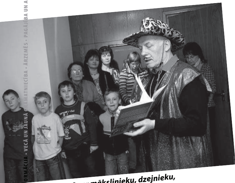
Tikšanās ar mākslinieku, dzejnieku, komponistu Jāni Anmani