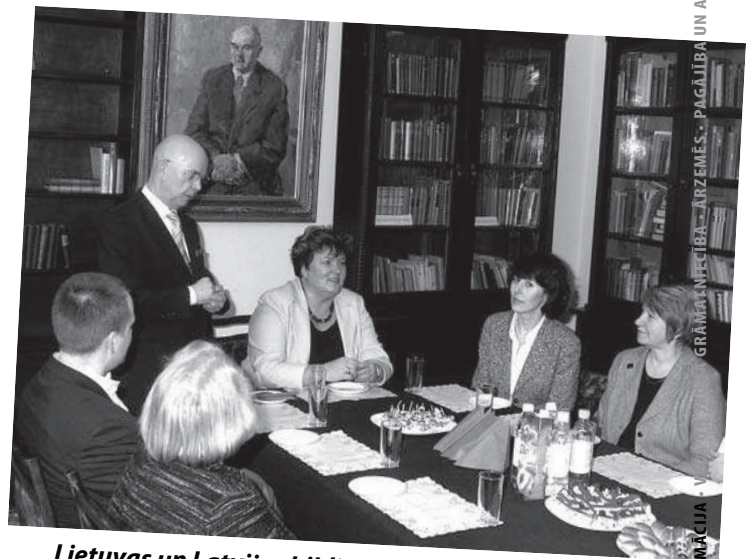
Lietuvas un Latvijas bibliotēku sadarbība turpinās. Stāv: Lietuvas vēstnieks Latvijā A.Vinkus