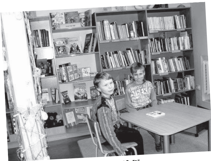
Zaļenieku bibliotēkas bērnu stūrītī