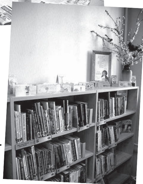
Bibliotēkas bērnu nodaļa. Bērnu apsveikumi bibliotēkai