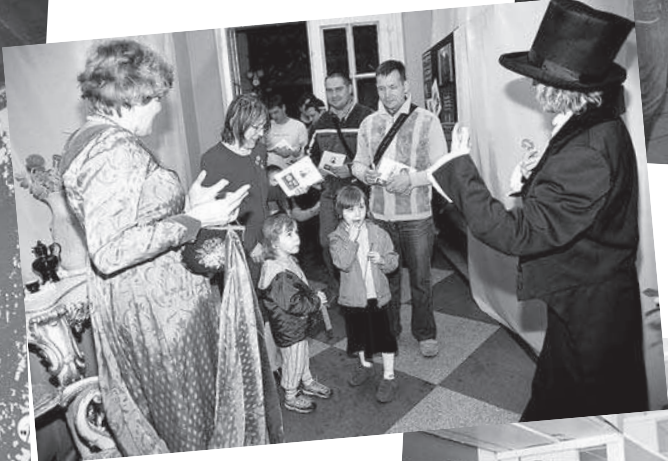
"Muzeju naktī" LNB apmeklēja kā lieli, tā mazi