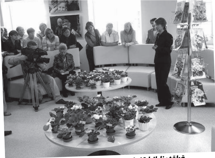
Sanpauliju izstāde Latgales Centrālajā bibliotēkā

Daugavpils bibliotēkās notika dažādi Bibliotēku nedēļas pasākumi: Latgales Centrālajā bibliotēkā bija