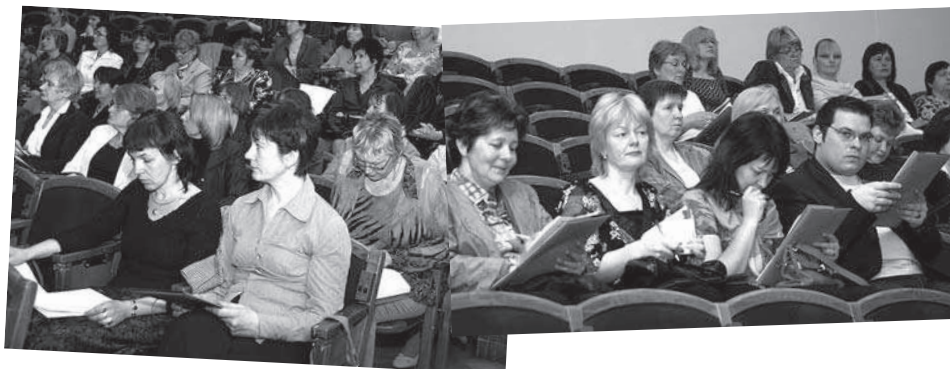
Latvijas pagastu bibliotekāri 5.kongresā

29.aprīlī Rīgas Kongresu namā Latvijas Nacionālā bibliotēka (LNB) sadarbībā ar Latvijas Bibliotekāru