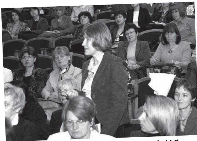
Jautājumu par norisēm bibliotēkās ir daudz, skaidrības — nekādas