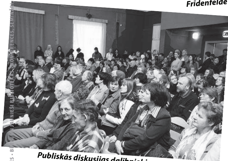
Publiskās diskusijas dalībnieki