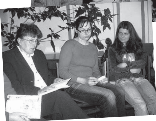
Ludzas lasītāji un viņu noslēpumainās grāmatas