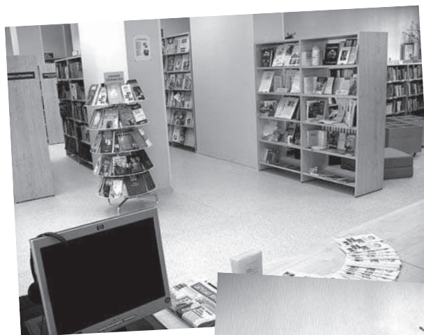
RCB Grīziņkalna filiālbibliotēka jaunajās telpās