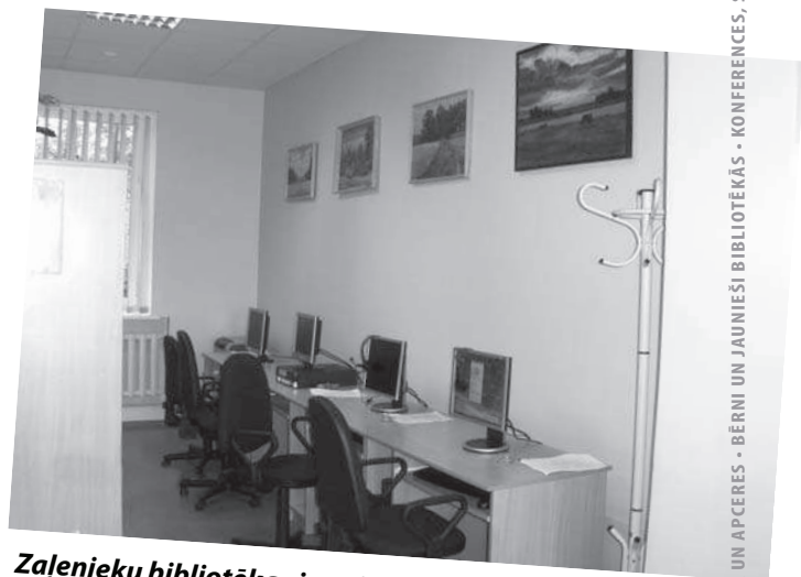
Zaļenieku bibliotēkas jaunās telpas