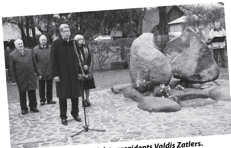
Grāmatu svētkus atklāj Valsts prezidents Valdis Zatlers. Pirmais no kreisās: Alojas pilsētas domes priekšsēdētājs Aloizs Koļešņikovs