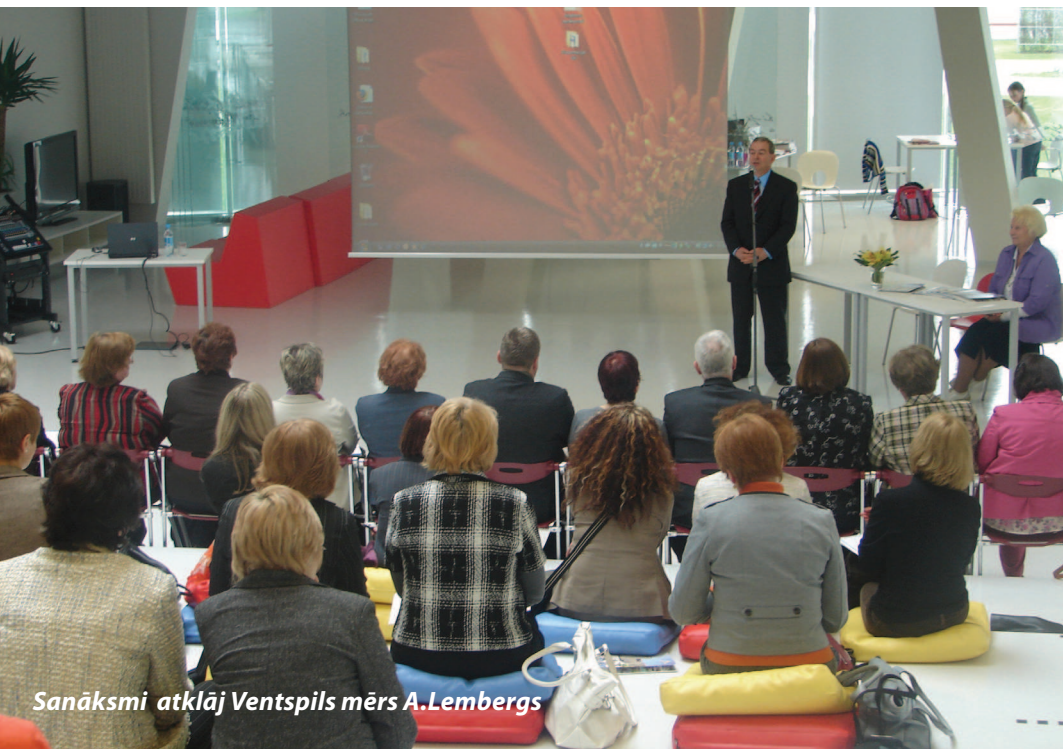
Sanākumi atklāj Ventspils mērs A.Lembergs

Sanākumi atklāja Ventspils domes priekšsēdētājs Aivars Lembergs , uzsverot, ka Ventspils vadība vēlas, lai ventspilnieki zinātu vairāk nekā citi. Viņš atzīmēja, ka pilnīgu informāciju visās jomās var nodrošināt tikai modernas bibliotēkas un to sistēma, kā arī izglītoti un darbam motivēti bibliotēku darbinieki. Tāpēc Ventspilī ir divas jaunas bibliotēkas, Digitālais centrs, moderna kultūras infrastruktūra. Pilsētas mērs atzina, ka, redzot lielo ventspilnieku interesi par jauno bibliotēku vecpilsētā, kuru ekspluatācijā nodeva