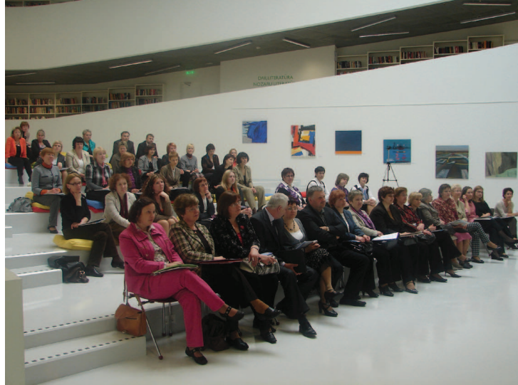
Bibliotēku direktori Pārventas bibliotēkā

par Latvijas zinātnisko, speciālo un publisko bibliotēku direktoru pavasara sanākumi 2010.gada 11.–12.maijā Ventspilī