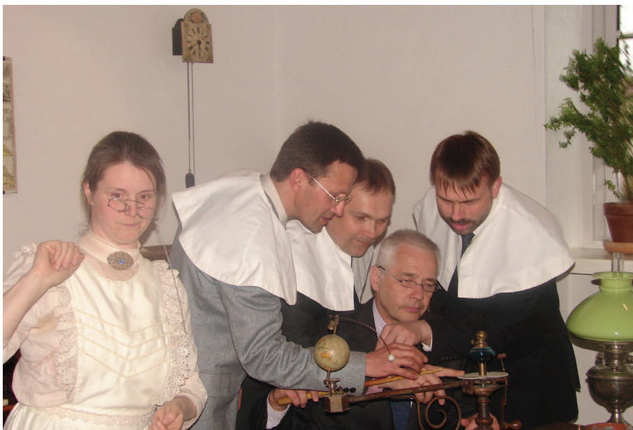
Ventspils mūza: viss Venstpili kļūst smuks pēc suņa, pat bibliotēku vīrieši!

Mazumtirdzniecības gigants Amazon uz katrām 10 papīra grāmatām pārdod 6 e-grāmatas. Pārdošanas apjomi pastāvīgi aug. Amazon šodien neapšaubāmi ir nepārspēts līderis arī elektronisko lasāmierīču jeb e-grāmatu lasītāju tirgū. E-lasītāju Kindle mēģina izkonkurēt Apple iPad tabletdators. A.Magone iepazīstināja klātesošos ar sava jauniegādātā e-grāmatu lasītāja unikālajām iespējām. 2009. gada 23.decembrī tika aktivizēta tīmekļa vietne, kurā var gūt informāciju par šīs tehnoloģiskās ierīces veidiem, ražotājfīrmām, tehniskajiem risinājumiem ( www.elasitajs.lv ; http://egramata.lv ). Praksē joprojām nerimst diskusijas par elektroniskās lasāmierīces pareizāko un labskanīgāko nosaukumu: e-lasītājs, e-laseklis ( grābeklis, kaseklis, spraudeklis, tīmeklis ), e-lasīklis ( adīklis ).