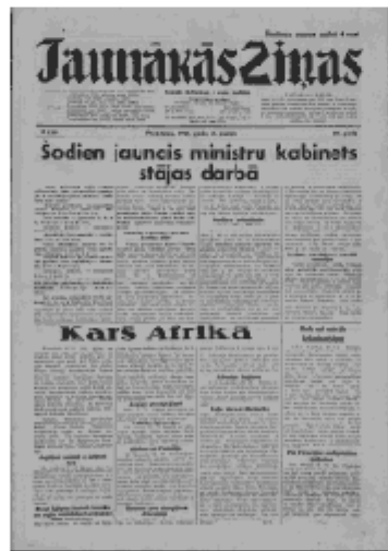
Jaunākās Ziņas Piektdiena, 21. jūnijs, 1940 1. lapa