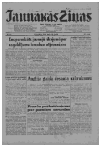
Jaunākās Ziņas Ceturtdiena, 20. jūnijs, 1940 1. lapa