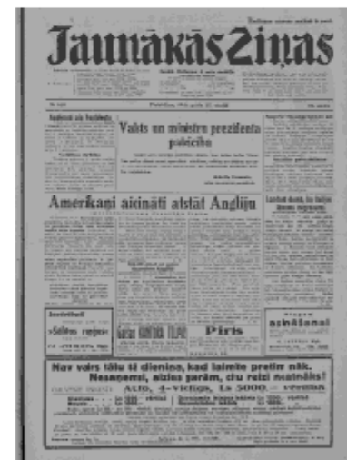
Jaunākās Ziņas Piektdiena, 17. maijs, 1940 1. lapa