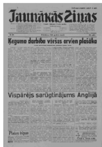
Jaunākās Ziņas Piektdiena, 3. maijs, 1940 1. lapa