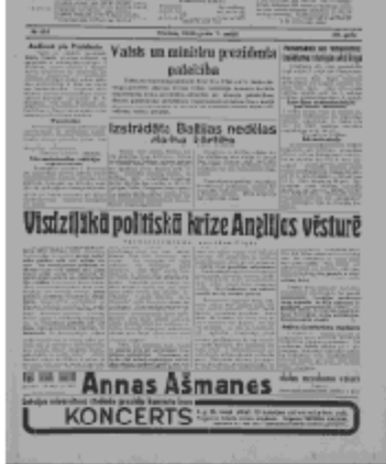
Jaunākās Ziņas Otrdiena, 7. maijs, 1940 1. lapa