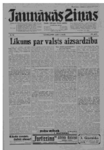
Jaunākās Ziņas Trešdiena, 1. maijs, 1940 1. lapa