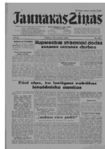
Jaunākās Ziņas Trešdiena, 22. maijs, 1940 1. lapa