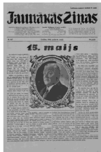
Jaunākās Ziņas Otrdiena, 14. maijs, 1940 1. lapa