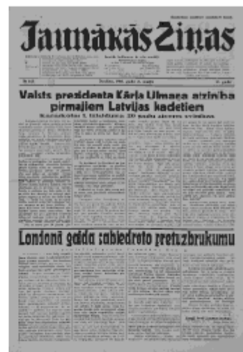
Jaunākās Ziņas Otrdiena, 21. maijs, 1940 1. lapa