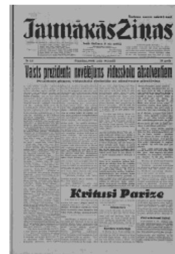
Jaunākās Ziņas Piektdiena, 14. jūnijs, 1940 1. lapa