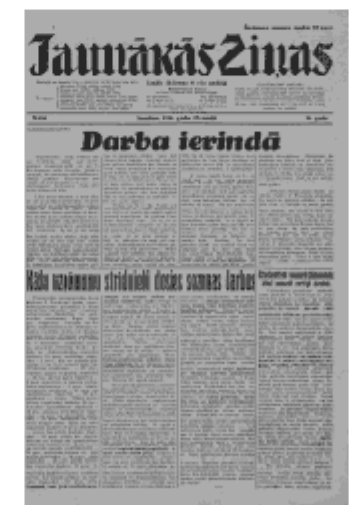
Jaunākās Ziņas Sestdiena, 25. maijs, 1940 1. lapa