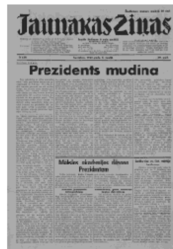
Jaunākās Ziņas Sestdiena, 8. jūnijs, 1940 1. lapa