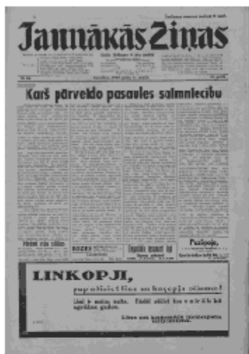
Jaunākās Ziņas Sestdiena, 18. maijs, 1940 1. lapa