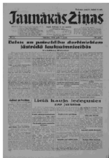
Jaunākās Ziņas Piektdiena, 7. jūnijs, 1940 1. lapa