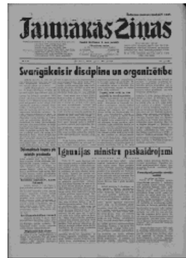
Jaunākās Ziņas Otrdiena, 25. jūnijs, 1940 1. lapa