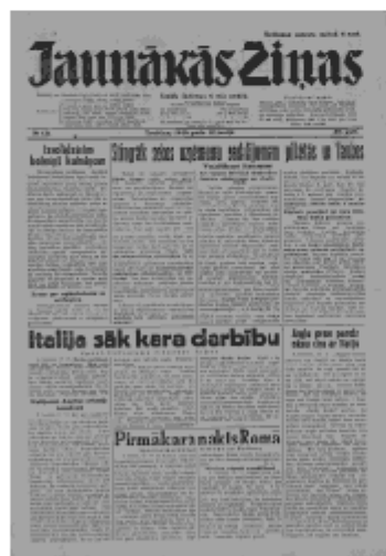
Jaunākās Ziņas Trešdiena, 12. jūnijs, 1940 1. lapa