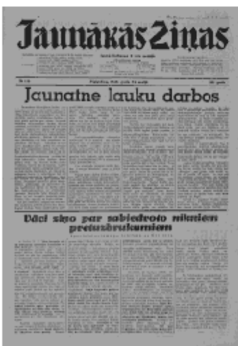
Jaunākās Ziņas Piektdiena, 24. maijs, 1940 1. lapa