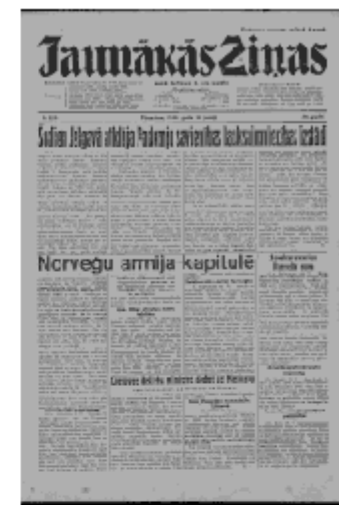
Jaunākās Ziņas Pirmdiena, 10. jūnijs, 1940 1. lapa