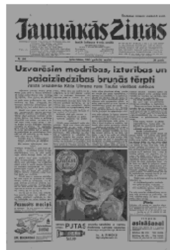
Jaunākās Ziņas Ceturtdiena, 16. maijs, 1940 1. lapa