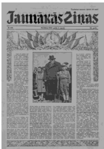
Jaunākās Ziņas Sestdiena, 11. maijs, 1940 1. lapa