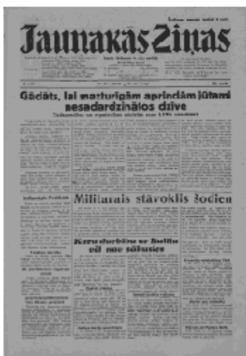
Jaunākās Ziņas Otrdiena, 11. jūnijs, 1940 1. lapa