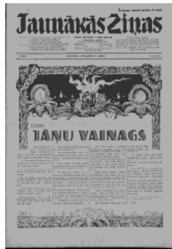
Jaunākās Ziņas Sestdiena, 22. jūnijs, 1940 1. lapa