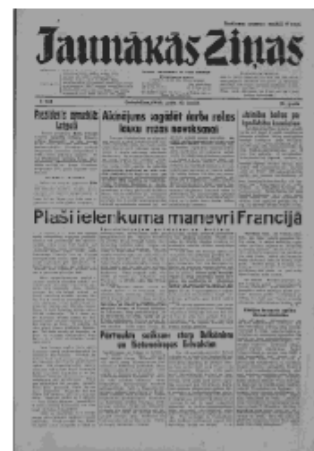
Jaunākās Ziņas Ceturtdiena, 13. jūnijs, 1940 1. lapa