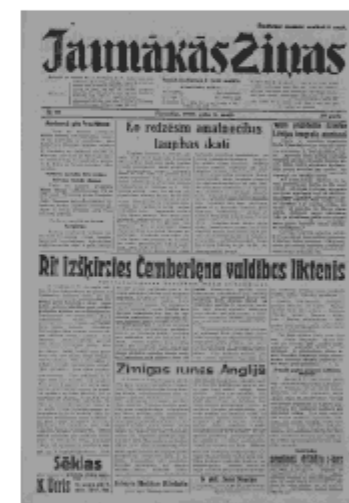
Jaunākās Ziņas Pirmdiena, 6. maijs, 1940 1. lapa