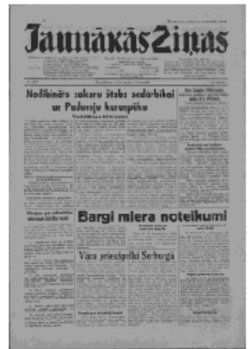
Jaunākās Ziņas Trešdiena, 19. jūnijs, 1940 1. lapa