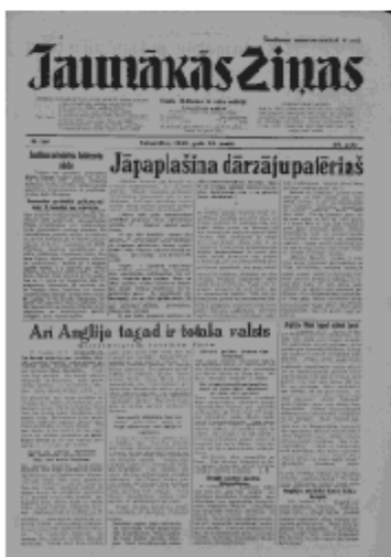
Jaunākās Ziņas Ceturtdiena, 23. maijs, 1940 1. lapa