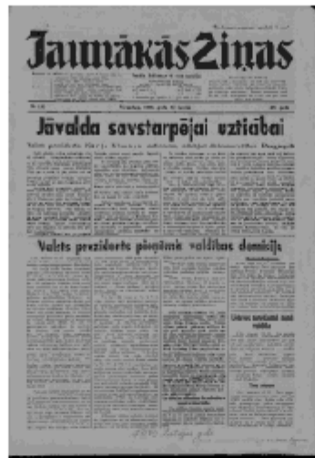
Jaunākās Ziņas Pirmdiena, 17. jūnijs, 1940 1. lapa