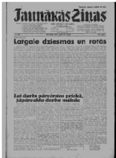
Jaunākās Ziņas Sestdiena, 15. jūnijs, 1940 1. lapa