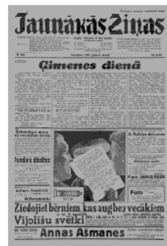
Jaunākās Ziņas Sestdiena, 4. maijs, 1940 1. lapa