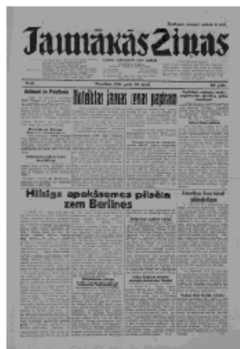
Jaunākās Ziņas Pirmdiena, 20. maijs, 1940 1. lapa