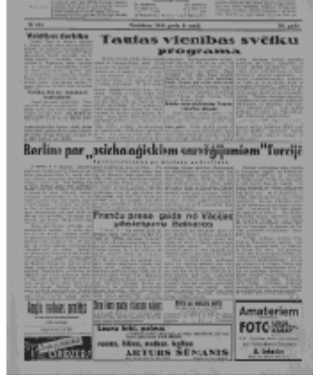
Jaunākās Ziņas Trešdiena, 8. maijs, 1940 1. lapa