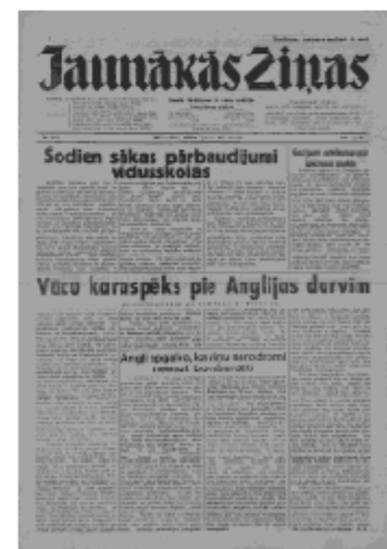
Jaunākās Ziņas Pirmdiena, 27. maijs, 1940 1. lapa