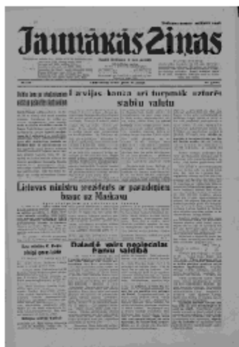
Jaunākās Ziņas Ceturtdiena, 6. jūnijs, 1940 1. lapa