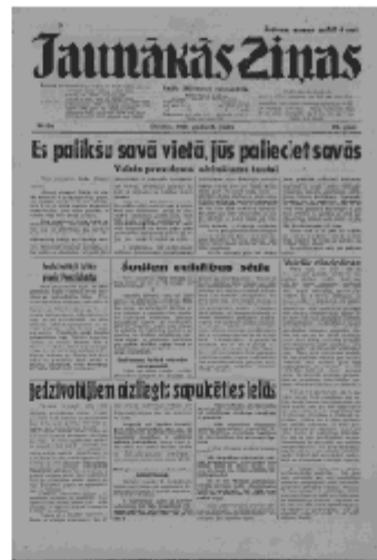
Jaunākās Ziņas Otrdiena, 18. jūnijs, 1940 1. lapa