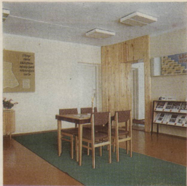
▲ Talsu rajona Centrālās bērnu bibliotēkas interjeri △