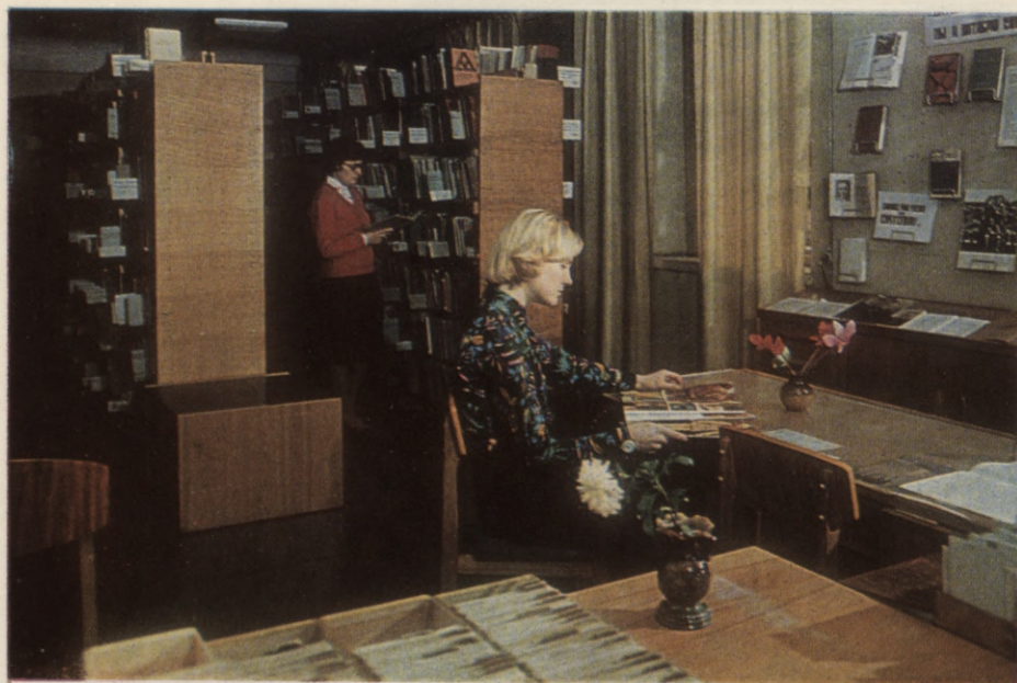
Ventspils pilsētas Centrālās zinātniskās bibliotēkas lasītavas