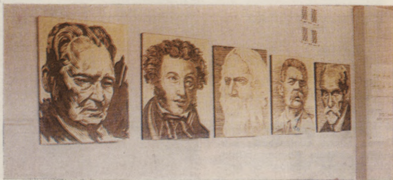
Rīgas pilsētas Anrī Barbisa 11. vidusskolas bibliotēkas interjers