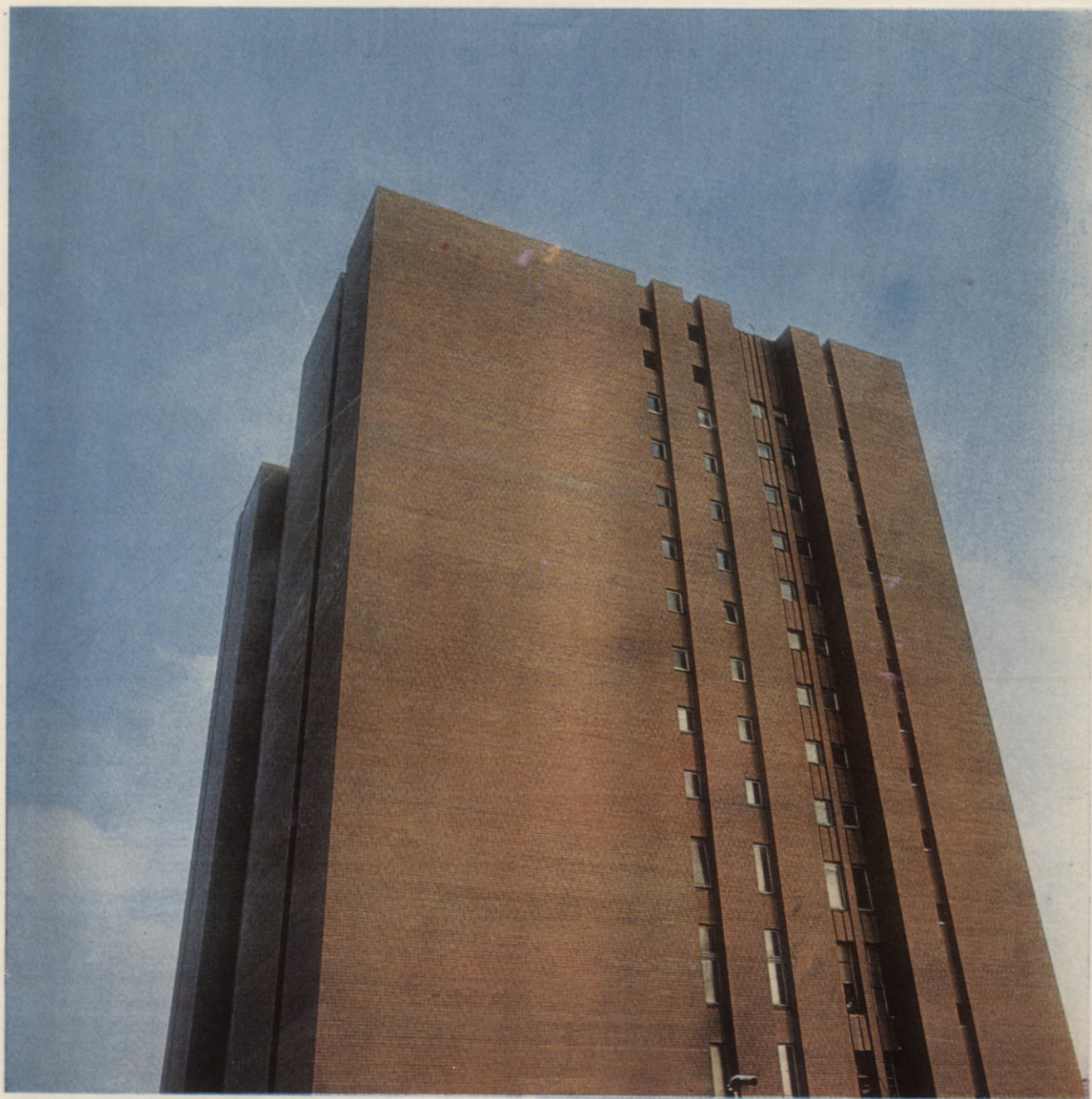
Latvijas PSR Zinātņu akadēmijas Fundamentālās bibliotēkas jaunā ēka