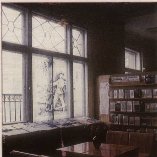
▲ V. Lāča Latvijas PSR Valsts bibliotēkas sabiedriski politiskās literatūras lasītava ▼ Letonikas nodaļas grāmatu krātuve