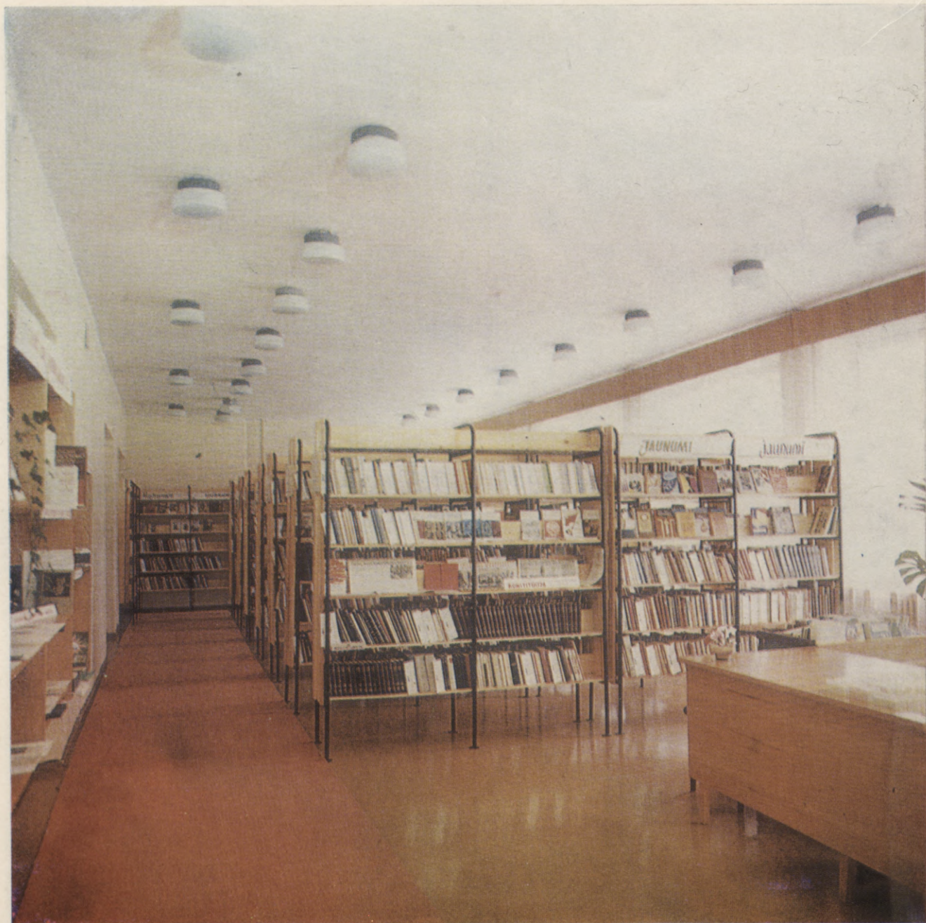
Ogres rajona centralizētās bibliotēku sistēmas Lielvārdes bibliotēkas abonements