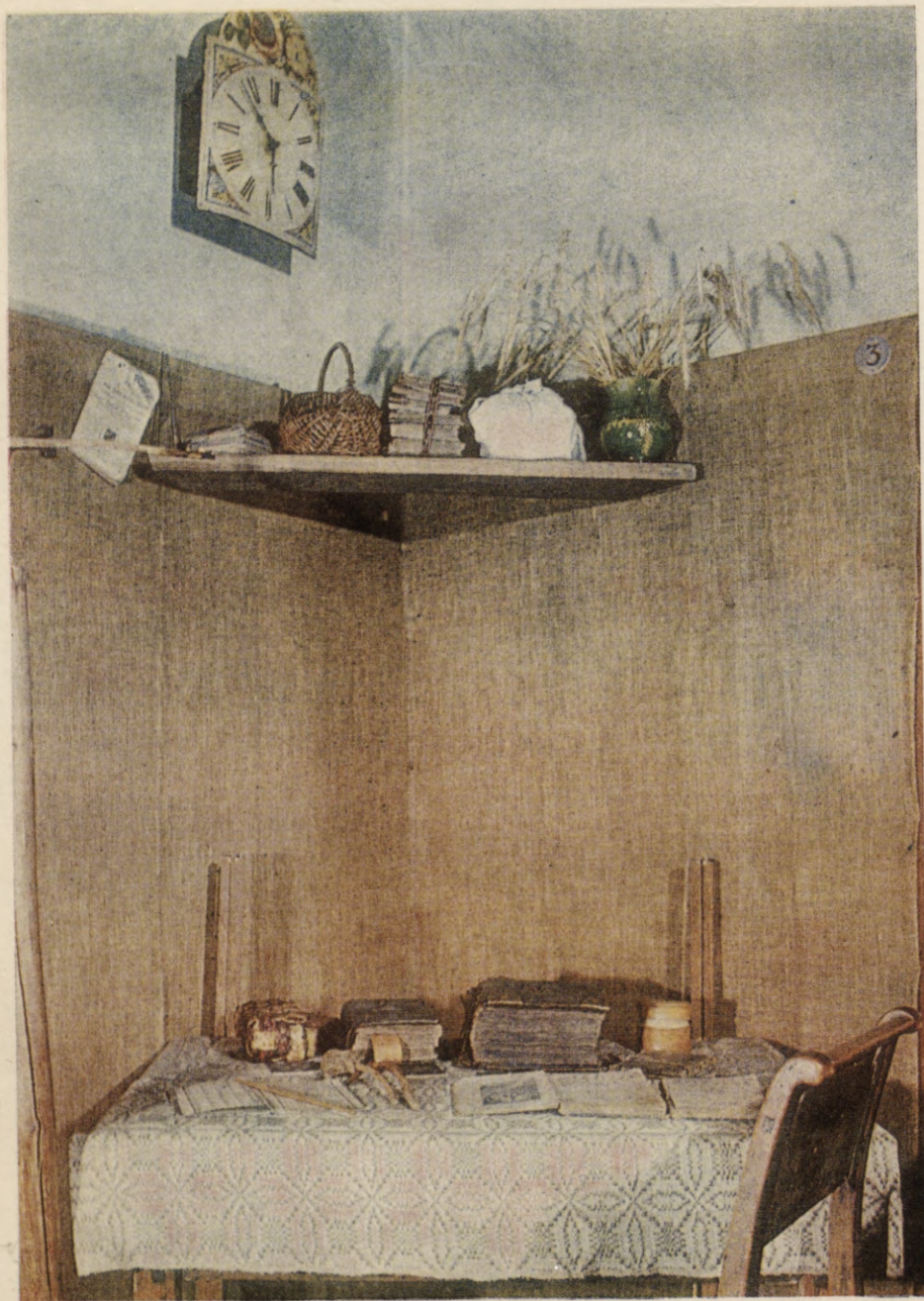
Zemnieka grāmatnieka «bibliotēka» XIX gs. vidū.