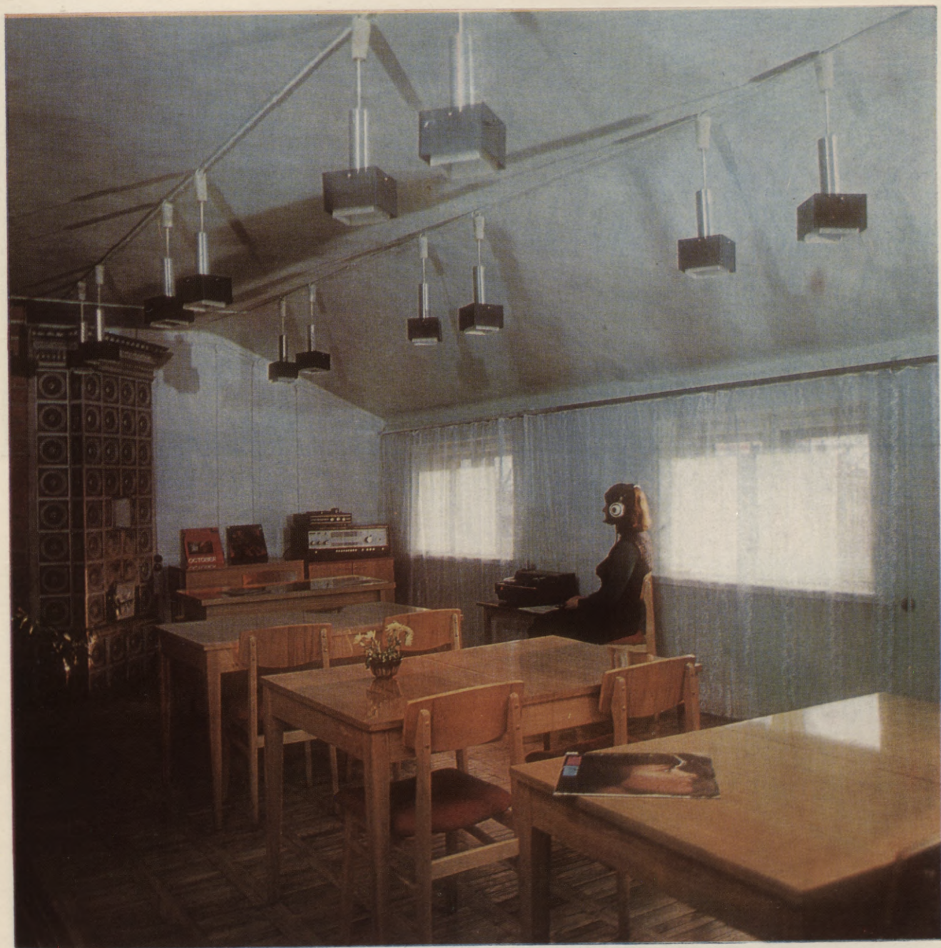
Ventspils pilsētas Centrālās zinātniskās bibliotēkas fonotēka