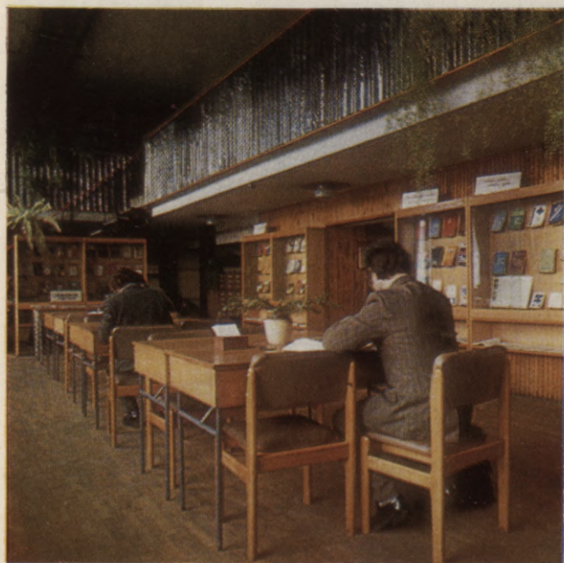
▲ P. Stučkas Latvijas Valsts universitātes zinātniskās bibliotēkas ēka