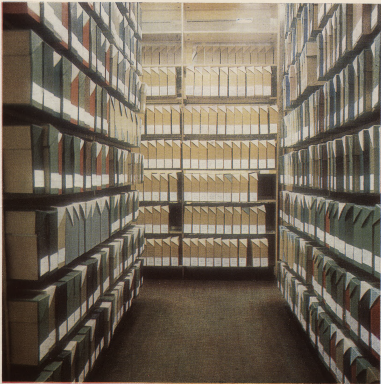
Republikāniskās zinātniski tehniskās bibliotēkas tehniskās dokumentācijas un literatūras specveidu krātuve