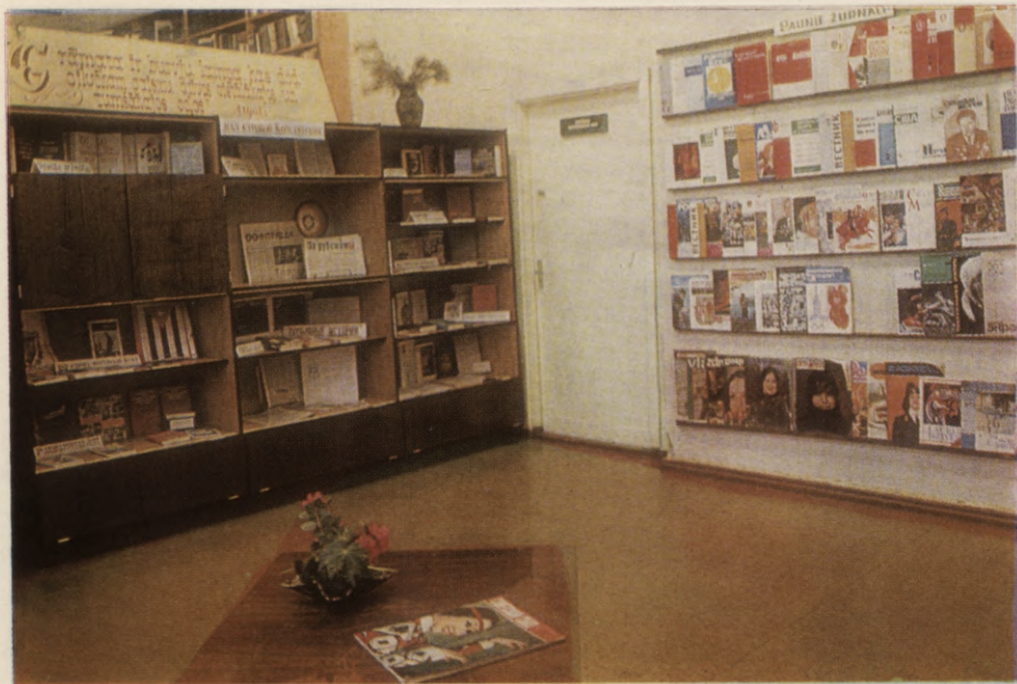
Daugavpils pilsētas Centrālās zinātniskās bibliotēkas interjeri