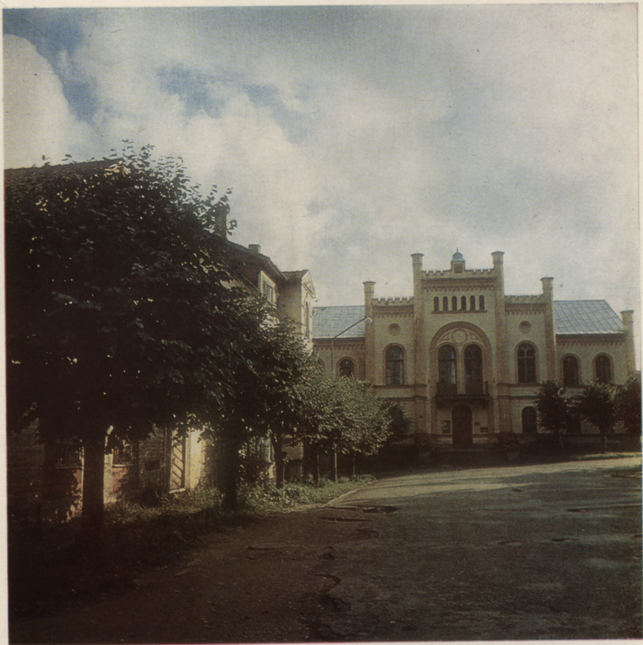
Kuldīgas rajona Centrālās bibliotēkas ēka