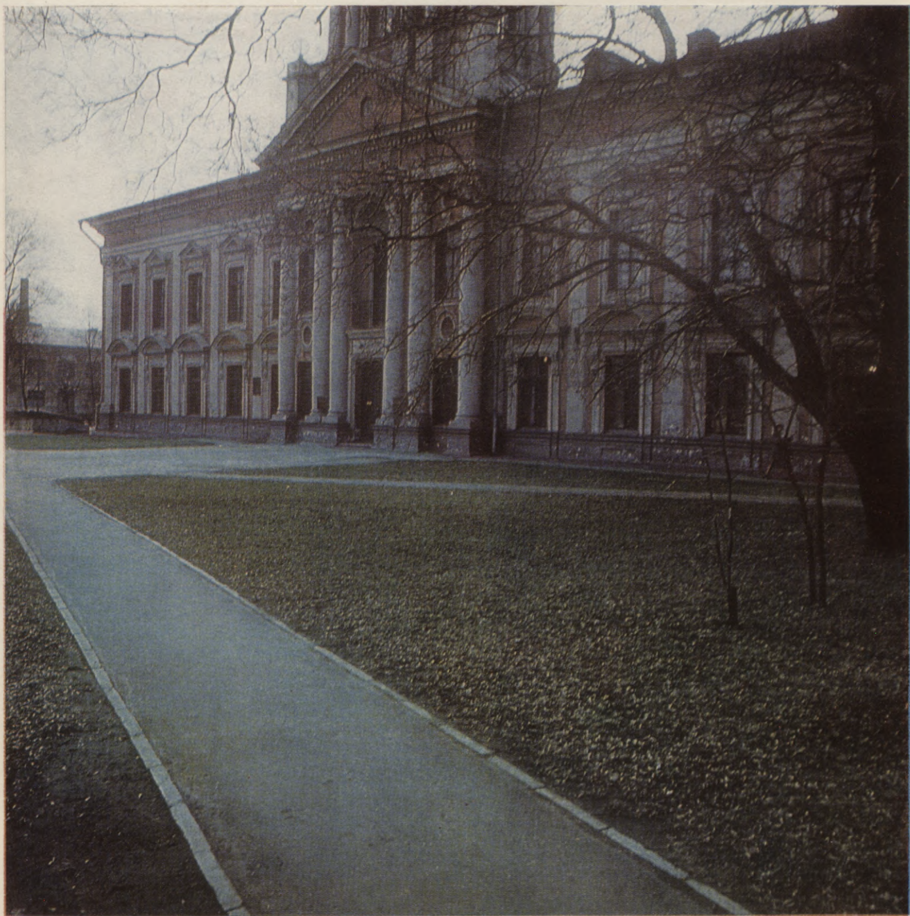
Jelgavas pilsētas Centrālās zinātniskās bibliotēkas ēka