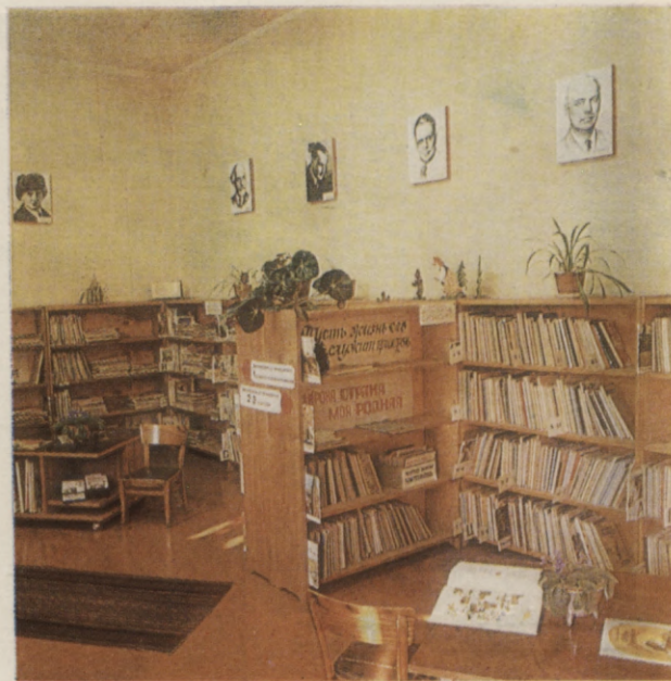
Daugavpils pilsētas centralizētās bibliotēku sistēmas 1. bērnu bibliotēkas interjeri

Vija Lāča Latv. PSR VALSTS BIBLIOTĒKA 81- 54.341