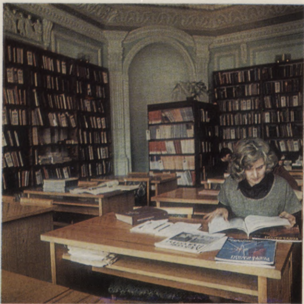
▲ J. Mišņa latviešu literatūras nodaļas lasītava un ēka△