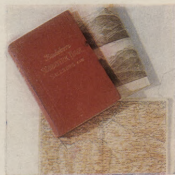
▲ Daugavpils pilsētas Centrālās zinātniskās bibliotēkas interjers Zalburgā izdotais «Ceļvedis pa Tiroli», kas glabājas bibliotēkas fondā ▷