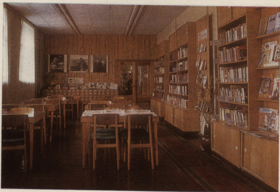
Liepājas pilsētas centralizētās bibliotēku sistēmas 2. bibliotēkas lasītavas