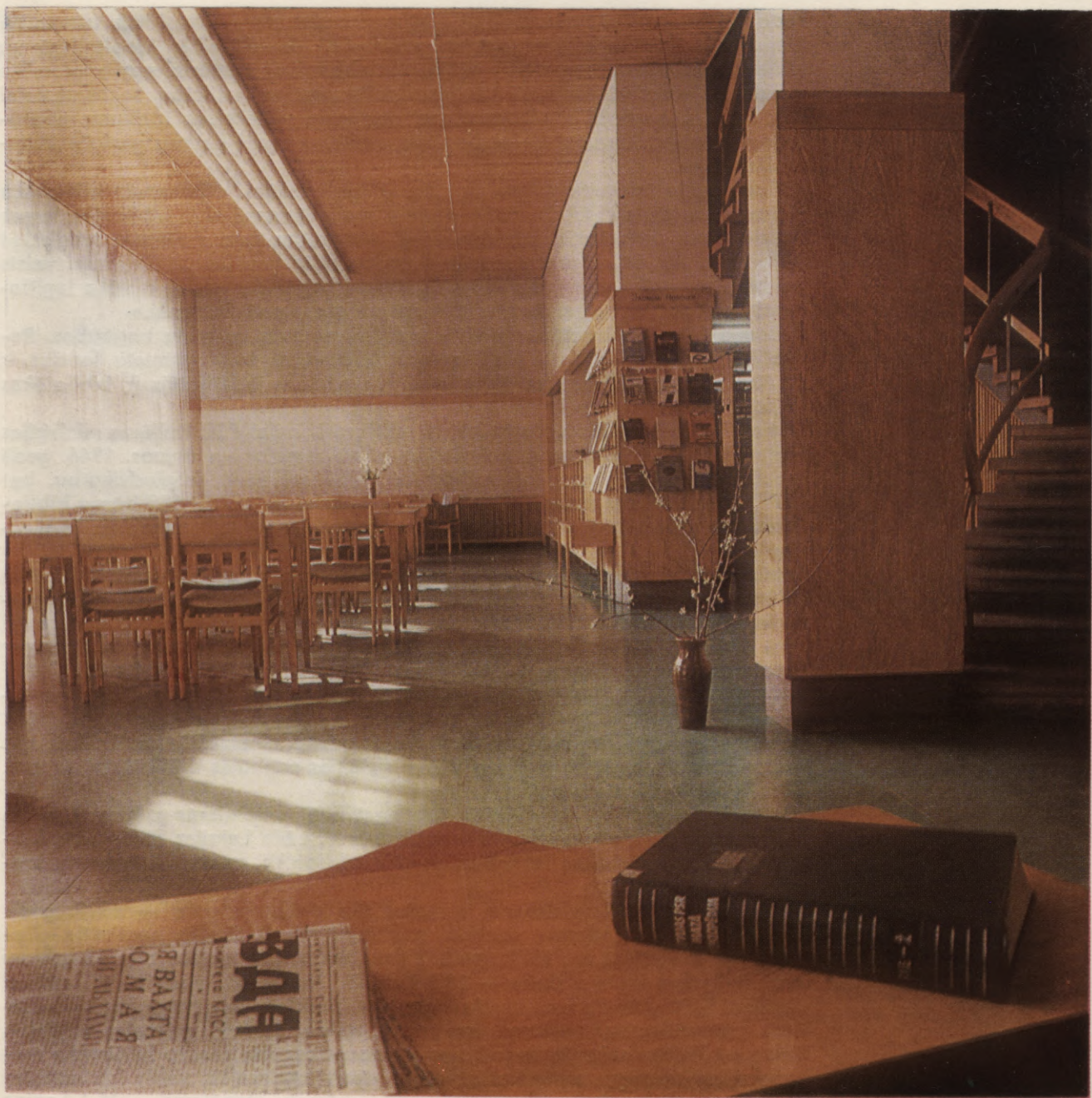
V. Lāča Latvijas PSR Valsts bibliotēkas Vispārīgā lasītava