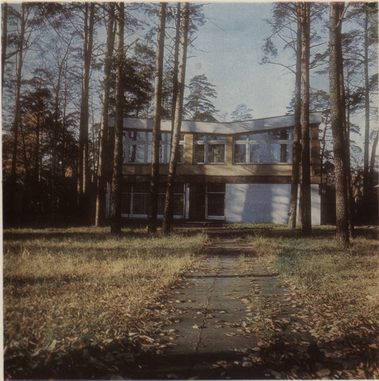
Jūrmalas pilsētas centralizētās bibliotēku sistēmas 3. bibliotēkas ēka