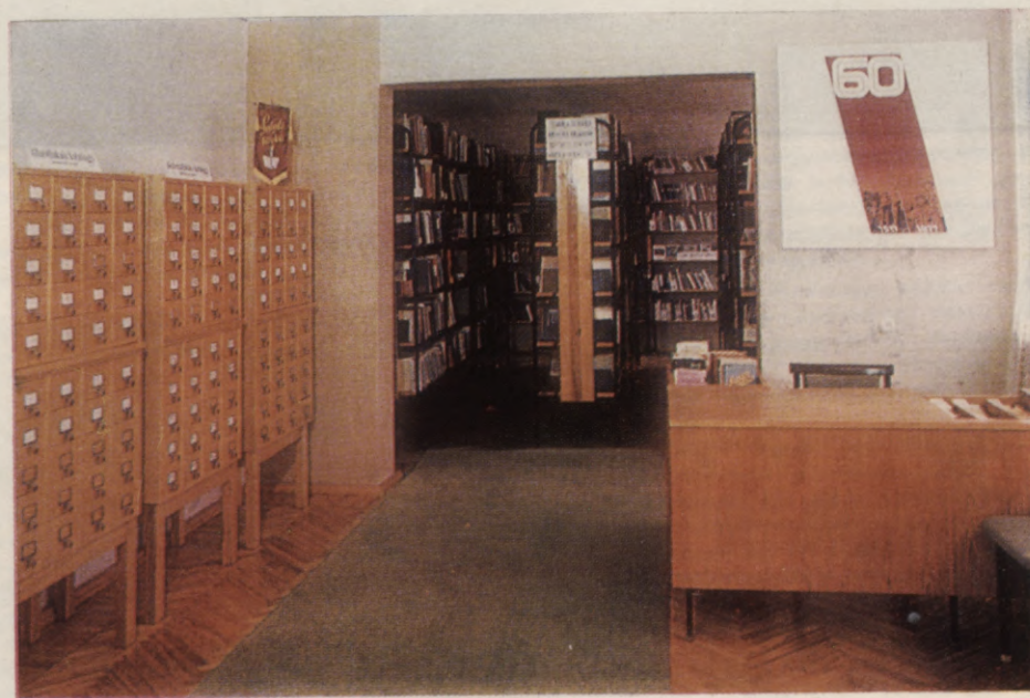
▲ Lielvārdes bibliotēkas lasītava Ogres rajona centralizētās bibliotēku sistēmas Ķeguma bibliotēkas lasītava, katalogi un brīvpieejas fonds △ ▷