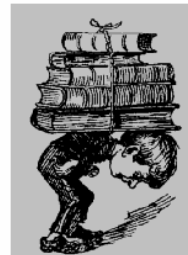
Kursa saturs un materiāli