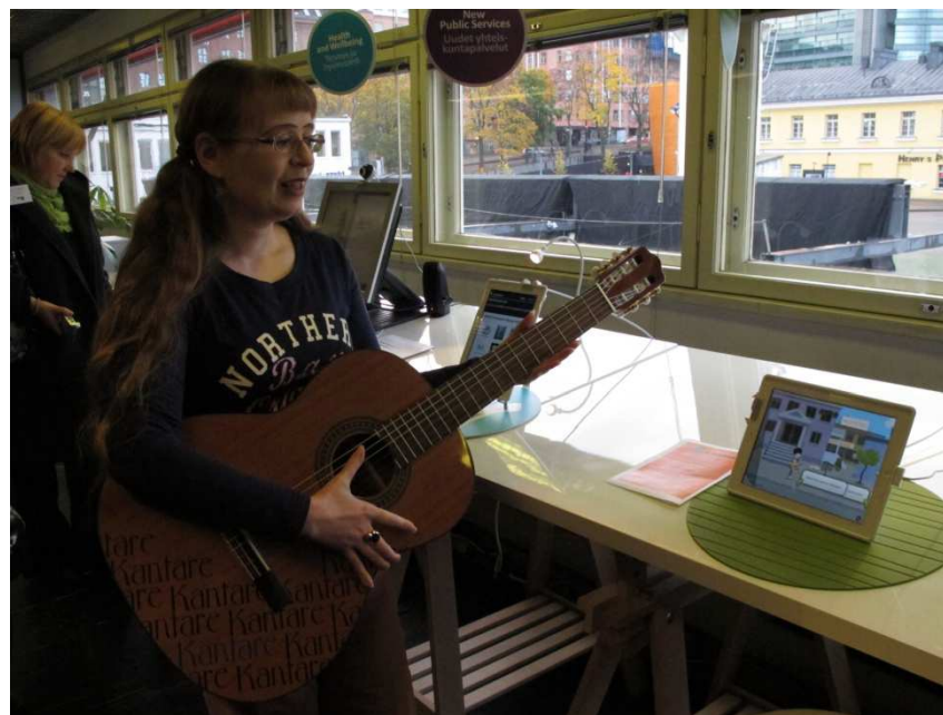
Helsinki pilsētas bibliotēkas struktūrvienība "Meetingpoint"