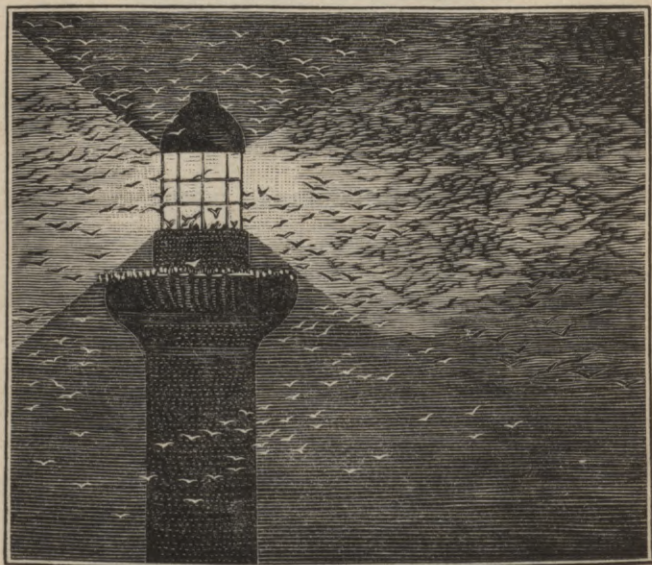
Putnu atšīšanās nakti pret bahfu.