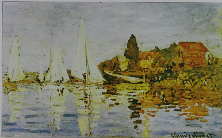
4. K. Monē. Buru laivas Ažanteijā. Ap 1872