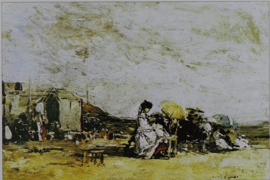
1. E. Budēns. Truvilas pludmalē . 1869