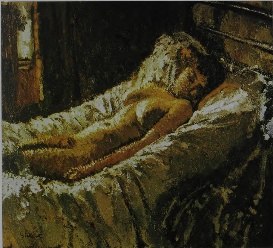
21. V.R.Sikerts. Akts. Ap 1917