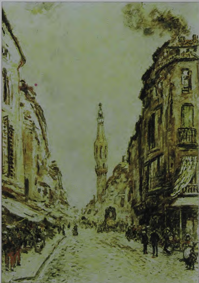
22. J.B. Jonkinds. Avinjona nas ainava. 1873