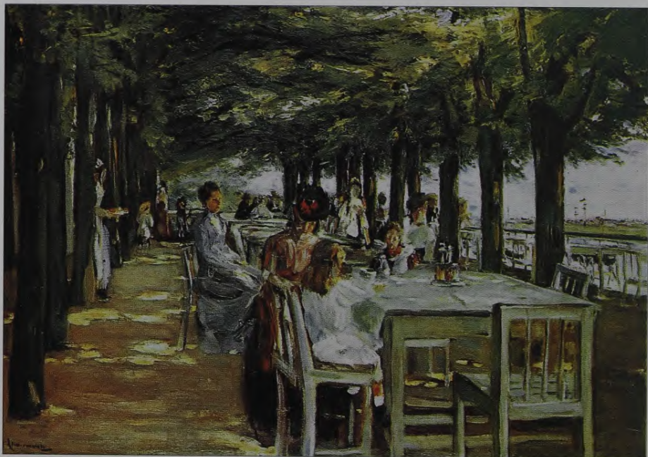
18. M.Lībermanis. Jakoba restorāns Neištātē pie Elbas. 1902