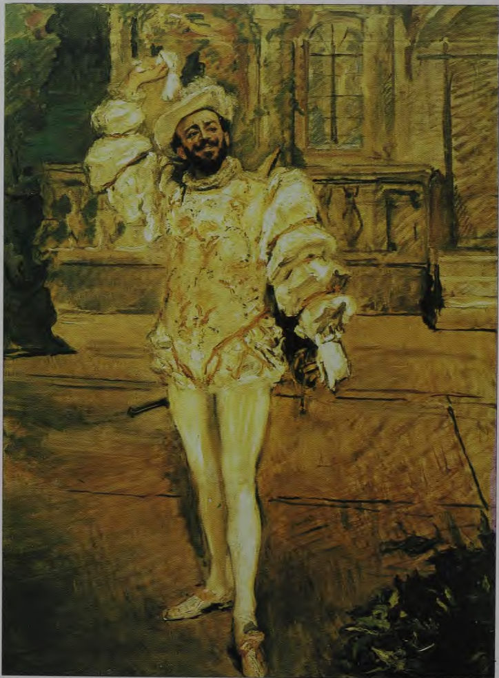
20. M. Slēfogts. Dziedātājs Fransisko d' Andrade Dona Žuana lomā. 1902