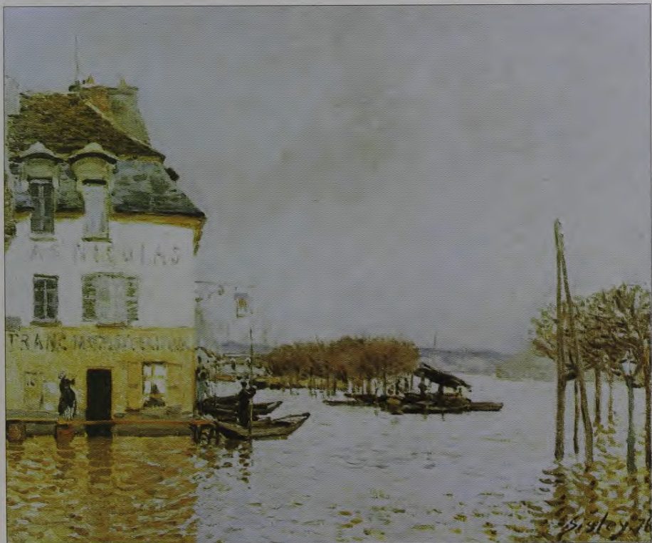
9. A. Sislē. Plūdi Marī. 1876