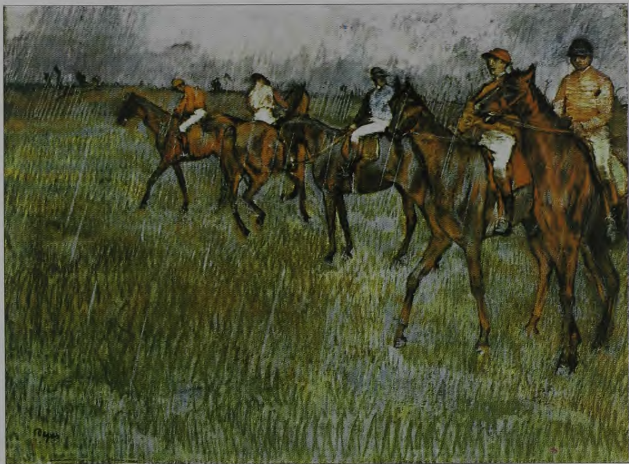
13. E. Degā. Žokeji lietū. Ap 1881