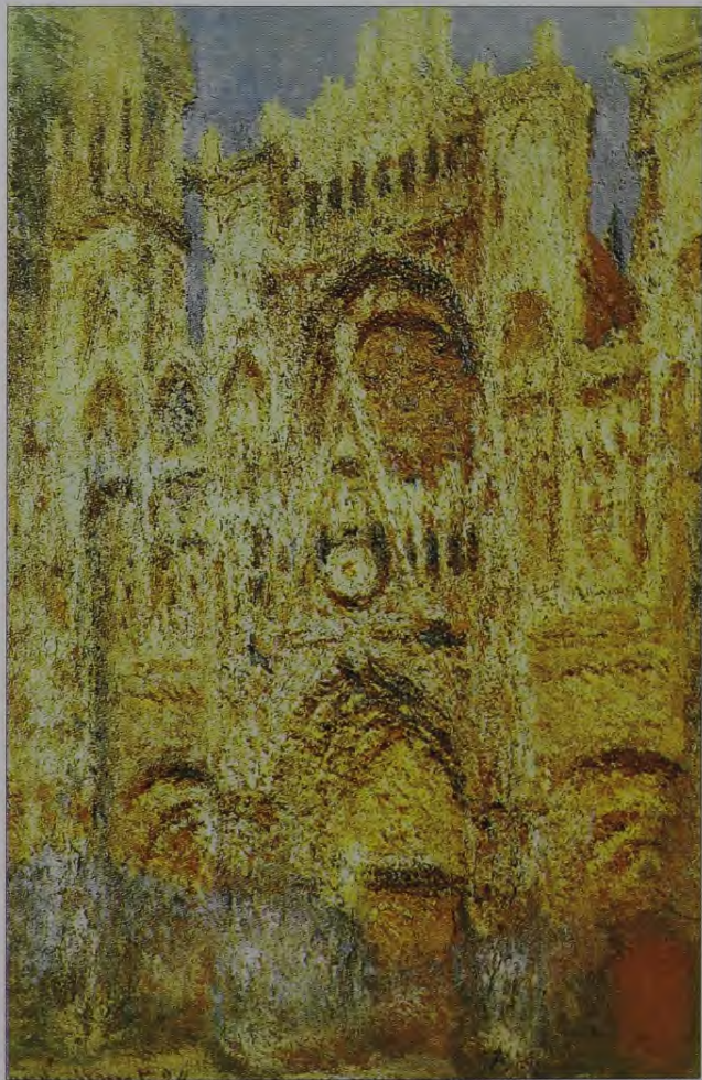
6. K.Monē. Ruānas katedrāle dienas vidū. 1834