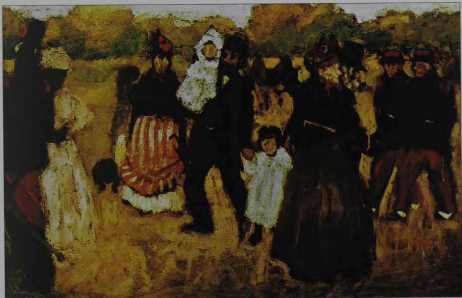
23. A.Ž. Evenpūls. Svētdiena Buloņas mežā. 1899