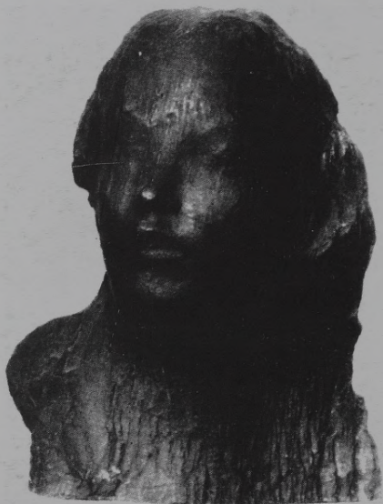
16. M. Roso. Bērna galva. Ap 1900