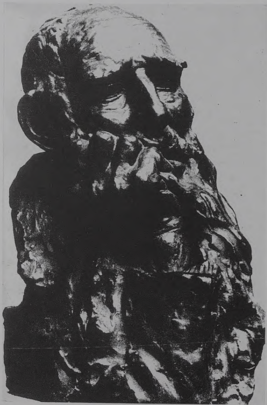
32. G. Škilters. Veča galva. 1914