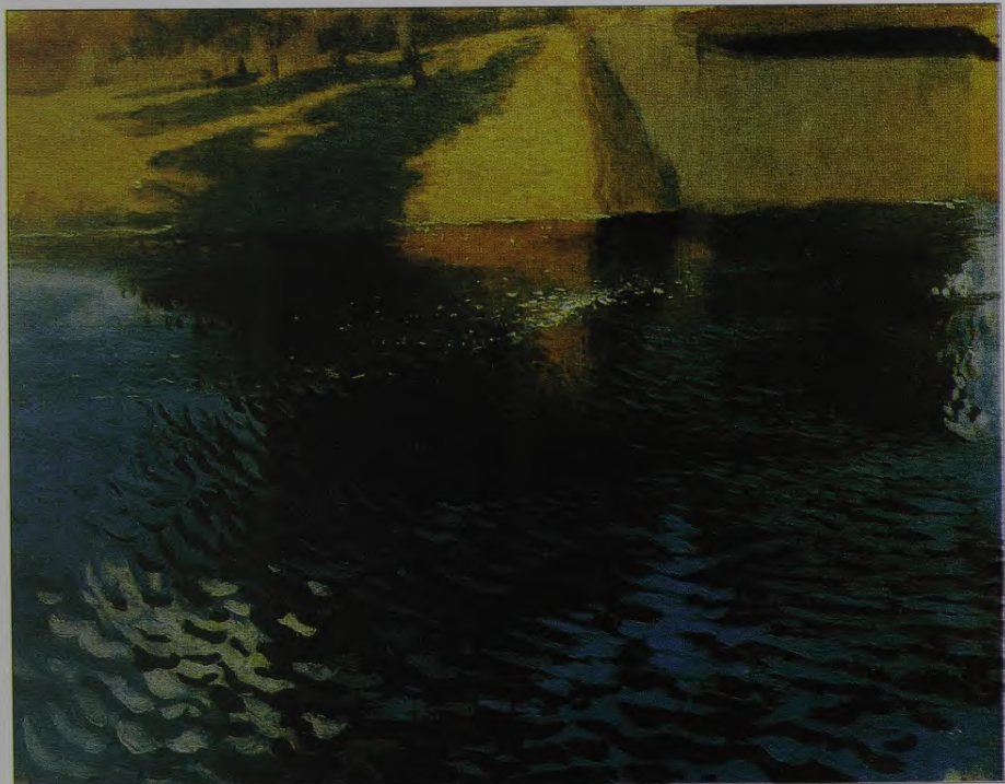
31. J. Valters. Viļņojošs ūdens. Ap 1898