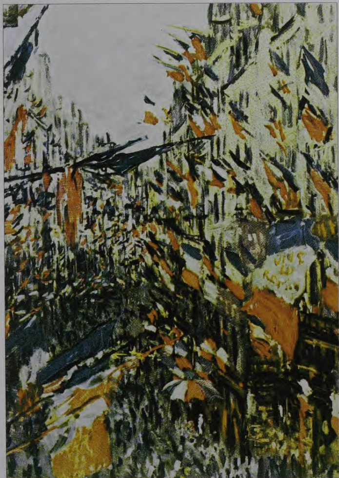
5. K.Monē. Montorgei iela ar karogiem Parī- zē. 1878