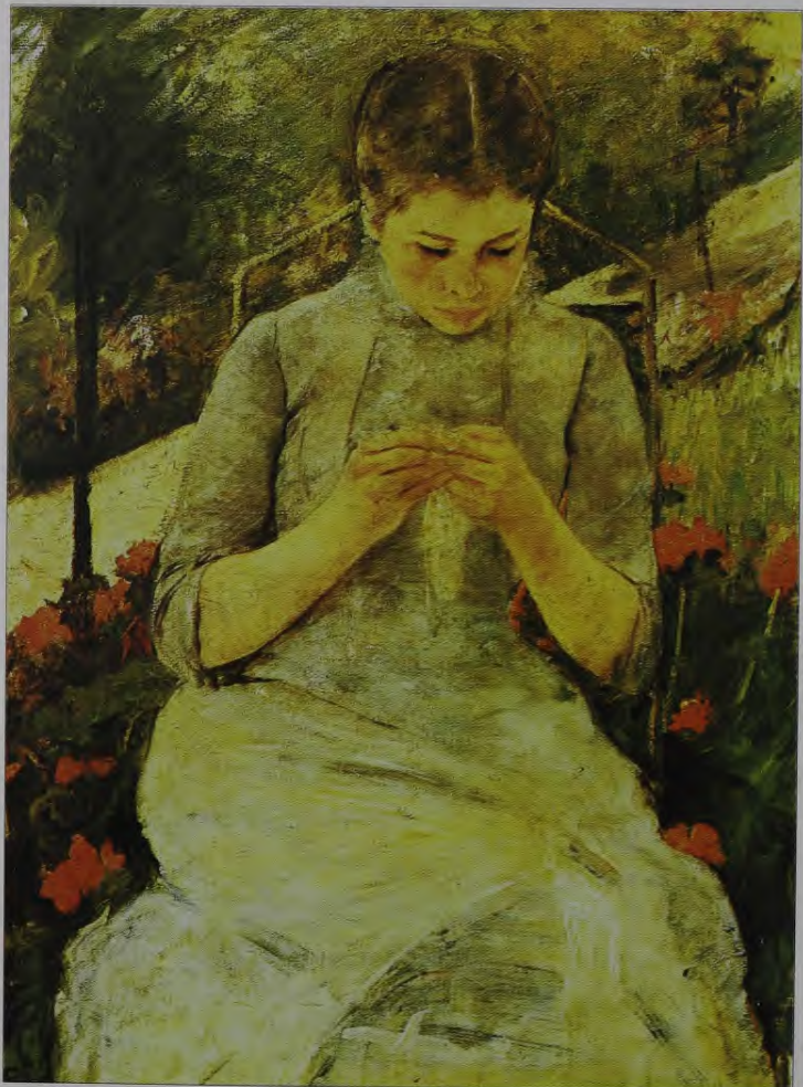
28. M. Kaseta. Šuvēja dārzā. Ap 1886