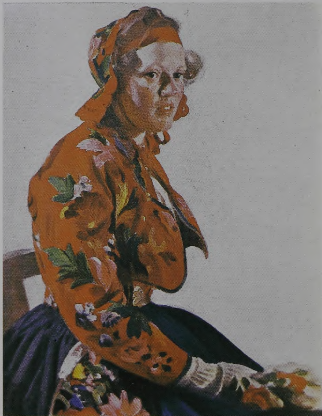
24. A.Corns. Meitene no Flodas . 1908