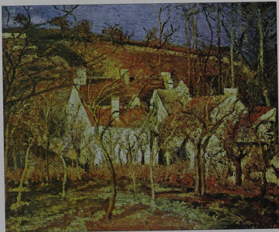
7. K. Pisaro. Sarkanie jumti. 1877