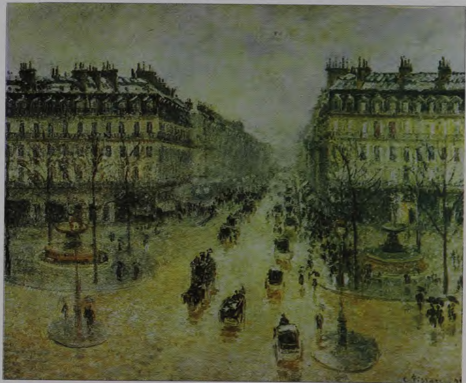
8. K. Pisaro. Operas iela Rarīzē 1898