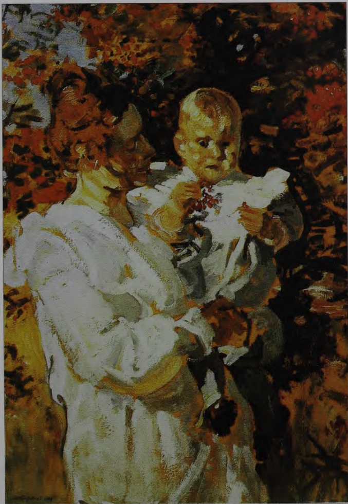
29. J. Rozentāls. Zem pīlādža. 1905