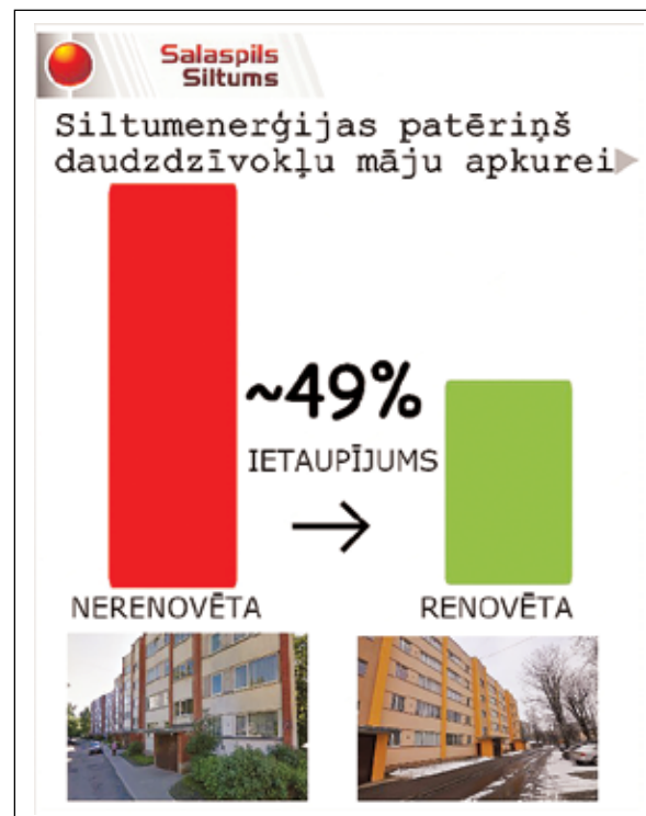
Attēlā: Siltumenerģijas patēriņš apkurei divās līdzīgās daudzdzīvokļu mājās – Skolas ielā 5/2 (nerenovēta) un Enerģētiku ielā 2 (renovēta). Renovētā mājā siltumenerģijas patēriņš (tikai apkure, bez karstā ūdens) ir par ~49% zemāks, nekā nerenovētā mājā. Mājaslapā www.salaspilssiltums.lv sadaļā "Klientiem" – "Siltumenerģijas patēriņš" ir brīvi pieejama informācija par katras daudzdzīvokļu mājas siltumenerģijas patēriņu pa mēnešiem, sākot ar 2012. gadu.

Katra projekta izmaksas ir atkarīgas no veicamo darbu apjoma. Daudzas mājas ir ļoti sliktā tehniskā stāvoklī. Tas nozīmē, ka mājas pirms siltināšanas ir jāatjauno. Lai atrastu katrai mājai finansiāli izdevīgāko risinājumu, tika organizēti gan atkārtoti būvniecības iepirkumi, gan veiktas izmaiņas sākotnējos projektos. Ņemot vērā gan būvniecības izmaksas, gan kreditēšanas izmaksas, gan piešķirto valsts turpinājums 4. lpp.