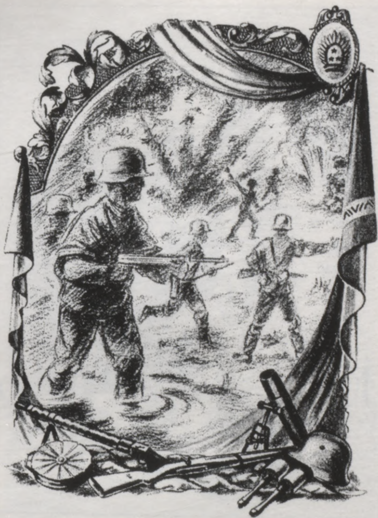
Viļa Ciesnieka ilustrācija grāmatai «Tētis karavīrs»