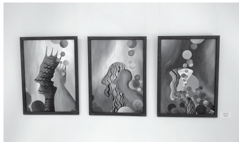
Alūksnes Mākslas skolas jauno mākslinieku darbu izstādē apskatāmi audzēkņu darbi, kas tapuši gan kā mācību procesa darbi, gan skolas nobeiguma darbi

Izstādē apskatāmi skolas audzēkņu darbi, kas tapuši gan kā mācību procesa darbi, gan skolas nobeiguma darbi. Tie ir gleznojumi, grafikas un tekstilkompozīcijas.