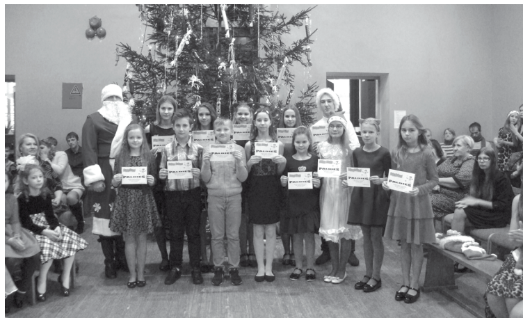
Sekmīgākie Pededzes pamatskolas audzēkņi Ziemassvētkos

Izglītojamo dzīvi interesantāku un saturīgāku darīja dalība projektā "Karjeras atbalsts vispārējās un profesionālās izglītības iestādēs" piedalījāmies Tehnobra nodarbībās un sevis izzināšanas, saprašanas un sajušanas aktivitātēs. 9. klases skolēniem notika pārrunas ar karje-