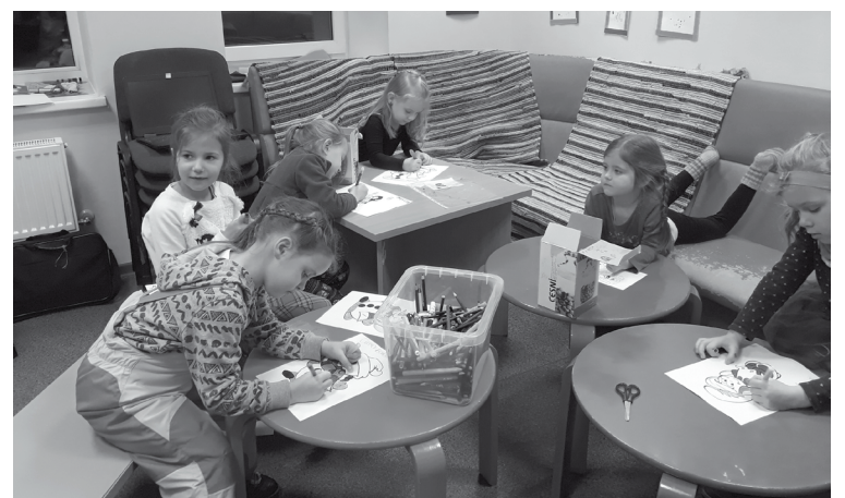
Projekta aktivitātes balstītas uz to, ka māksla ir izpausmes un saziņas līdzeklis starp cilvēkiem