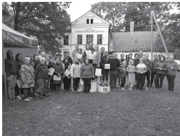
Biedrība “Ilzenes attīstībai” aizvadītajā gadā organizējusi vairākas aktivitātes Ilzenes pagastā, lai vienotu vietējo kopienu, tostarp arī ne-tradicionālas komandu orientēšanās sacensības „Dārgumu lāde Ilzenē”

26. augustā biedrība organizēja netradicionālas komandu orientēšanās sacensības „Dārgumu lāde Ilzenē”, kuru norises laikā tika veicināta starppaaudžu sadarbība, iesaistoties pasākuma organizēšanā un norisē, izzinot Ilzenes dārgumu (iedzīvotāju) dzīves stilu, kā arī kultūrvēsturisko mantojumu. Ar Ilzenes dārgumiem biedrība pozicionējusi Ilzenes muižas un tās apkaimes iedzīvotājus, kuri ir aktīvi sabiedriskajā dzīvē un arī sava amata vai aizraušanās lietpratēji. Kontrolpunktos komandām bija jāizpilda dažādi uzdevumi, kas atbilda Ilzenes dārgumu dzīves sfērām. Ceļā uz kontrolpunktiem komandas varēja iegūt papildus punktus, nofotogra-