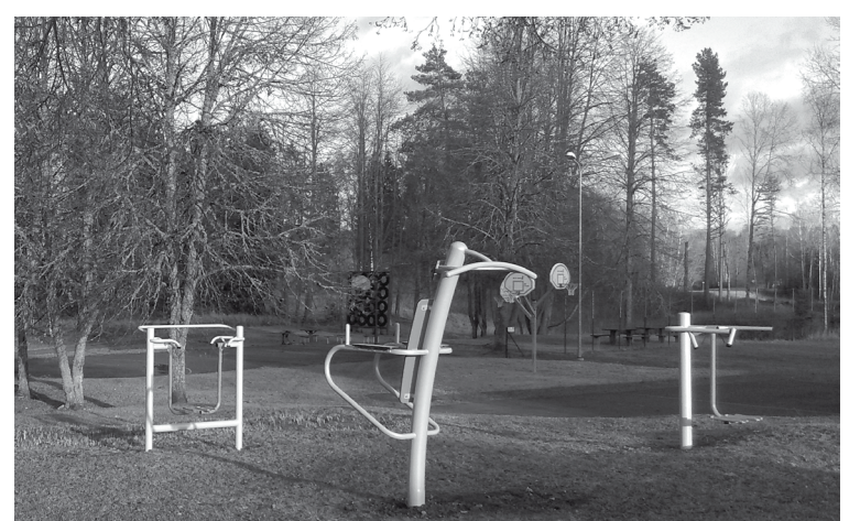
Projektā “Investīcijas ilgtspējīga tūrisma attīstībai Zeltiņu pagastā” uzstādīti āra trenāžieri

Alūksnes novada pašvaldības finan- sējums un 70% valsts finansējums. Lai mazinātu plūdu risku, 2017. gadā kopīgi ar iedzīvotājiem sekojām Melnupes gultnes stā- voklim un rudenī veicām nelielus gultnes tīrīšanas darbus, attīrot to no kritušiem kokiem. Pēc iedzīvotāju ierosinājuma pārvaldes darbinieki ir apkopojuši informāciju par norādēm uz mājām, lai budžeta iespēju robe- žās 2018. gada sākumā tās pasūtītu un pavasarī uzstādītu. Esam sagla-