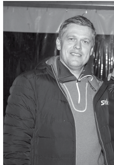
Intars Berkulis Foto no personīgā arhīva

Evita Aploka, Alūksnes novada pašvaldības sabiedrisko attiecību speciāliste