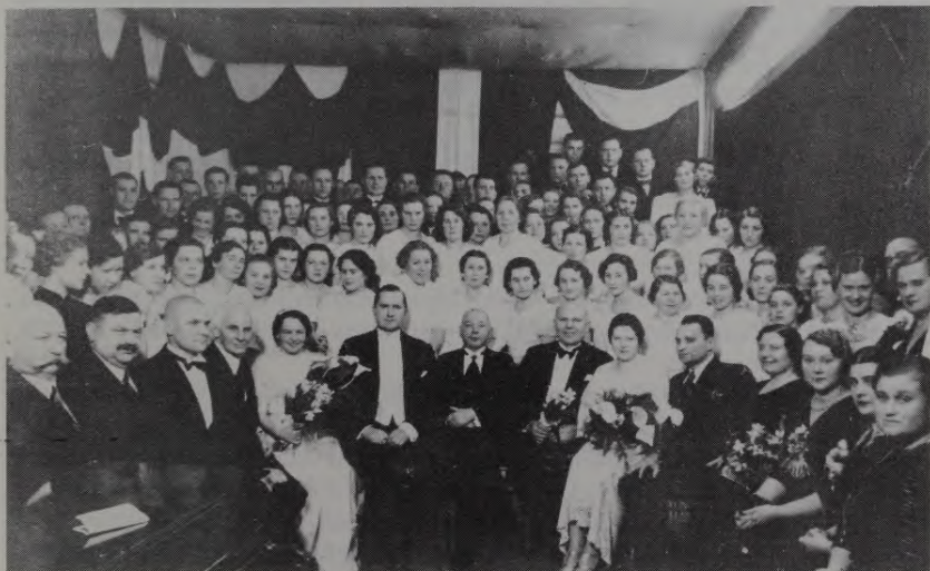
Latvju jaunatnes apvienotais koris Liepājā 1930-tos gados