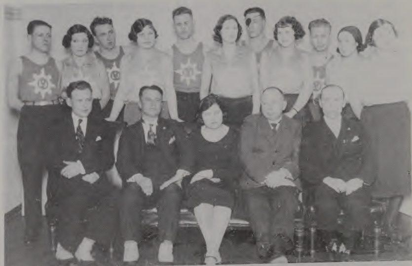
Latvju jaunatnes biedrības sporta sekcija Liepājā