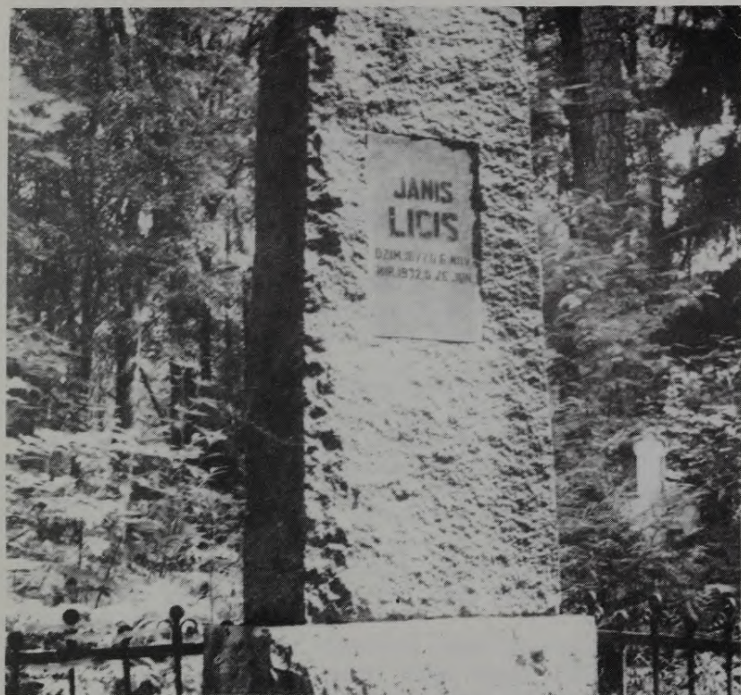
Ed. Līča tēva kapa vieta Rūjienā

seskis alā!» Mans puisītis sāka raudāt, un es vairs nezināju nekā, ko teikt. Mēs gājām uz vārtu pusi klusēdami.