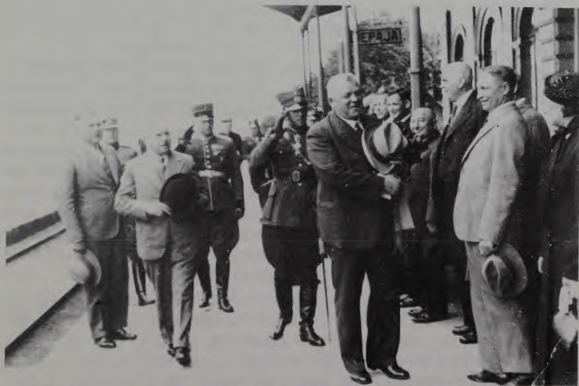
Kārlis Ulmanis Liepājas dzelzceļa stacijā ceļā uz tautas svētkiem Nicā 1937. gadā