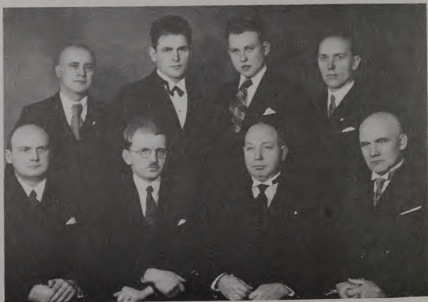
Latvju jaunatnes biedrības valde Liepājā 1938. gadā