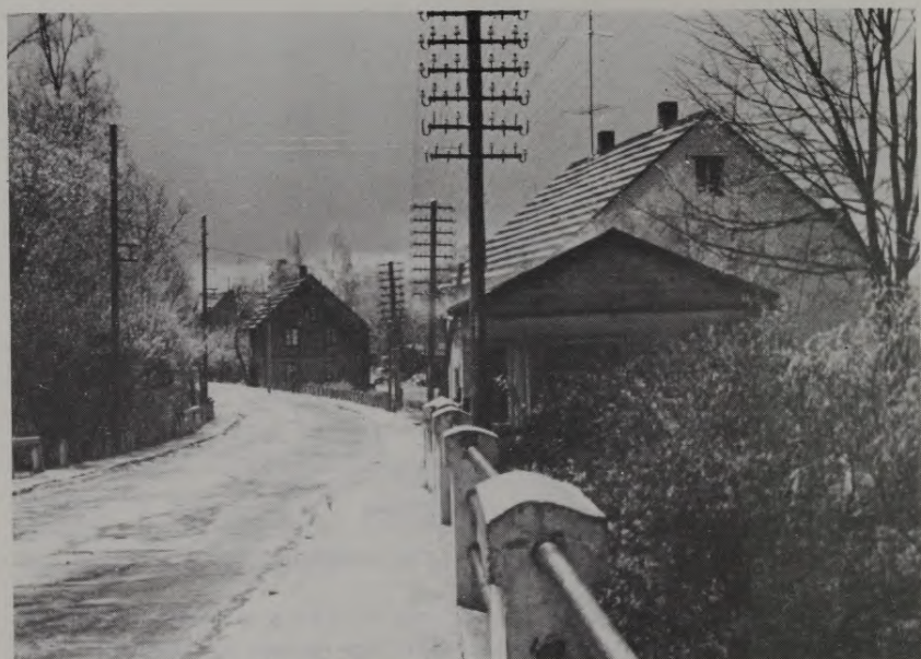
Valdemāra iela Rūjienā