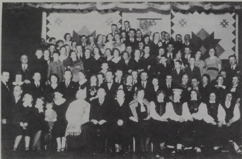
Ed. Līča 50 gadu jubilejas svinības Liepājā 1934. gadā