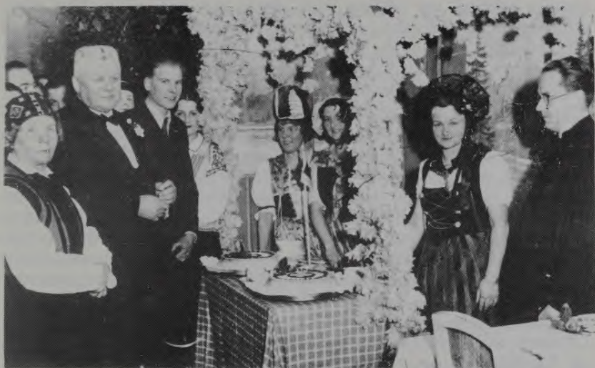
Kārlis Ulmanis JSKS sarīkojumā Rīgā 1936. gadā