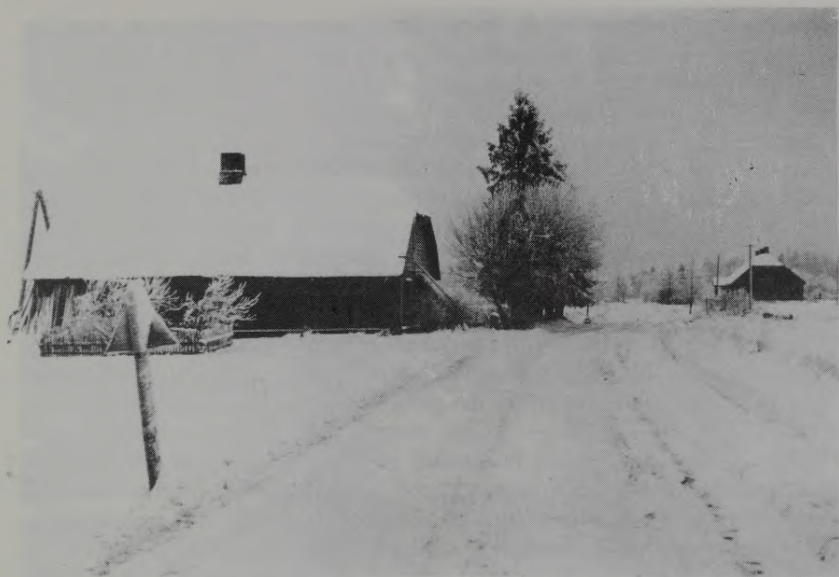
Īdus pagasta nams un nespējnieku mītne ap 1919. gadu

nokārtojis un zvaniķis-kapracis jau divus nespējniekus bija pēc šīs kārtības izvadījis visā mierā. Bet maksāts vēl nekas nebija. Kad bija pieteikta trešā apbedīšana, vecais kapusargs bija atsūtījis uz pagasta namu zīmīti: «Kolīdz pie vārtiem ar liķi piebrauc, tūliņ, tūliņ jāsamaksā . . . » Otrā dienā noteiktā laikā ierados pie nespējnieku nama, lai nosūtītu aprakšanas honorāru un parādus. Bet tur nebija ne šķūtnieka, ne bērnieku. Tas jau likās pavisam aizdomīgi. Vai tad jau arī šķūtnieki sāk sabotēt vai streikot? Bet tad man pateica, ka šķūtnieks, kam esot darišanas Mazsalacā, ieradies agrāk, paņēmis savu vedamo un aizbraucis. Bet kas nu būs? Man neizgāja no prāta «kolīdz piebrauc — jāsamaksā!» Bet nauda nav vis pie šķūtnieka, bet pie manis. Tie laiki, kā jau pēckaŗa gadi, bija citādi, un viss kas varēja gadīties. Tas nu bija tiešām par traku! Bet kur viņš zārku liks? Atpakaļ taču nevedīs. Un es nomierinājos.