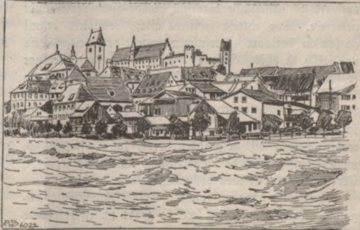
Pluhdu ſtati Waſar-Eiropā.

iſdibinat. Wiſmas ſwaru kungs no peeſchmaulſchanas negribeja neka dſirdet un winam tatſchu gan tas buhtu jaſin labati nekā jebkuram zitam.