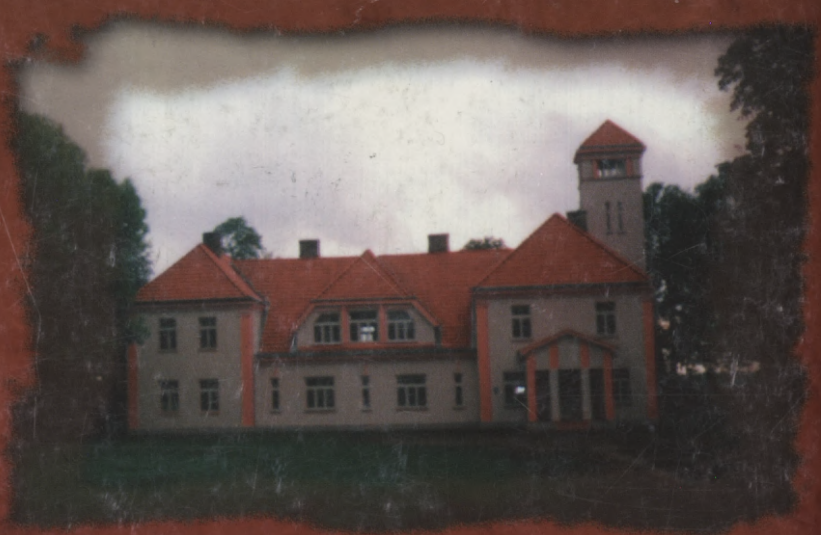
Jāņa Čakstes dzimtas nams "Auči"