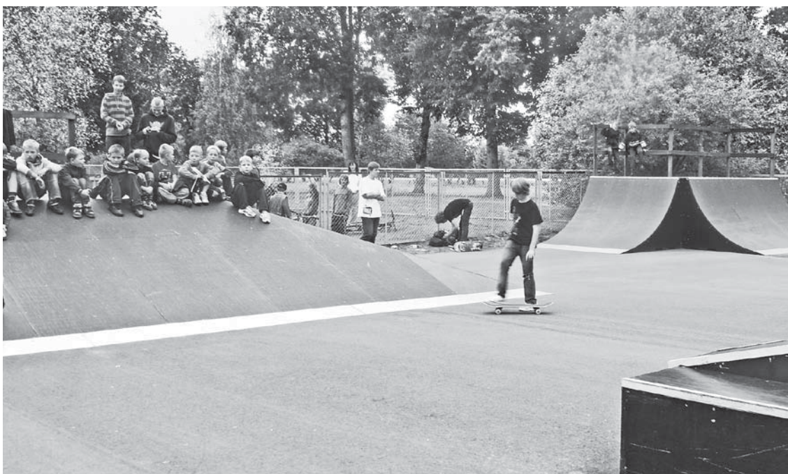
Skeitparkā valda rošība.