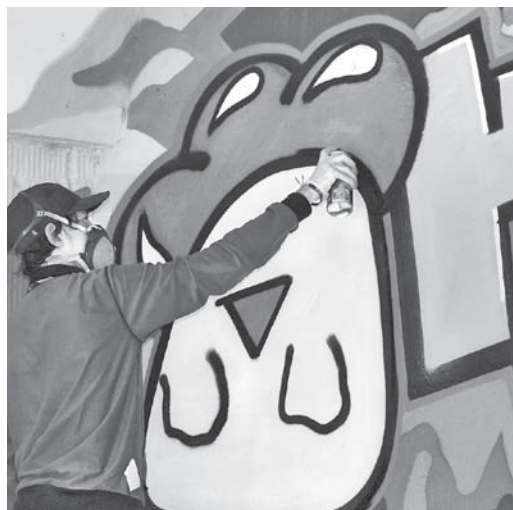
Graffiti arī ir māksla!

26. septembrī Ķekavas novadā sadarbībā ar valsts policiju notika novada Domes, Kultūras un sporta aģentūru rīkotā jaunatnes diena „ACTIVITY”. Tās programmā bija ietvertas trīs dažādas aktivitātes – iepazīšanās ar policijas iestāžu darbu, skeitparka atklāšana un grafiti demonstrējumi.