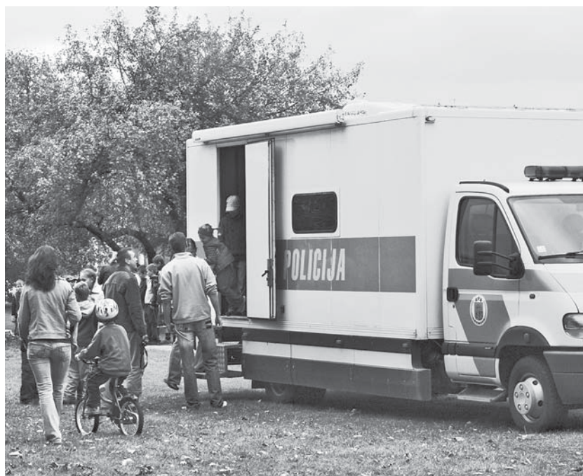
Policijas dienesta tehnika izraisīja vislielāko apmeklētāju interesi.