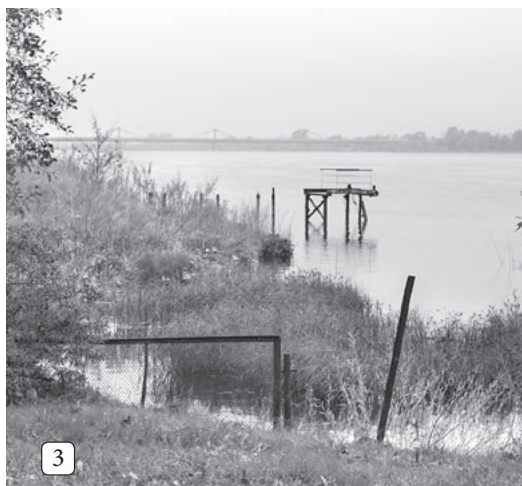
3 Nožogota teritorija un gājēju taka nokļūšanai pie Daugavas pie D/S "Ziedonis".