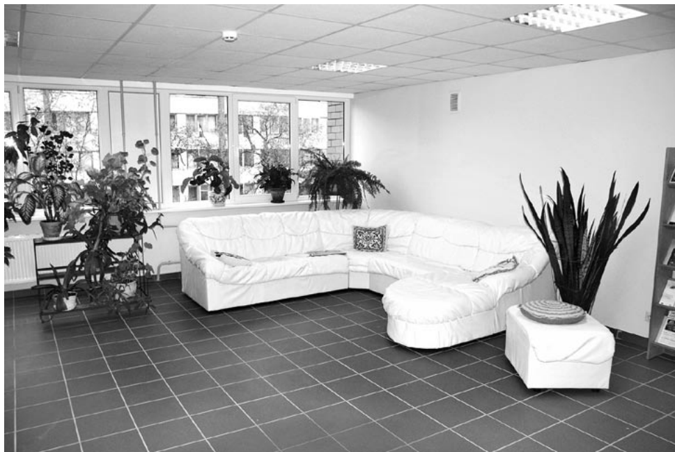
Mājīgs atpūtas stūritis.

Pašvaldības aģentūra „Ķekavas sociālās aprūpes centrs” sniedz sociālās aprūpes pakalpojumus gan pieaugušo ilgstošās sociālās aprūpes centrā (pansionātā), gan klientiem dzīvesvietā – „Aprūpe mājās”. Sociālās aprūpes pakalpojumus var saņemt tās personas, kuru spējas pašiem sevi aprūpēt ir ierobežotas. Pakalpojumi tiek apmaksāti no pašvaldības budžeta līdzekļiem, ja pašvaldībā dzīvesvietu deklarējusi persona dzīvo atsevišķi, ir trūcīga, tai nav likumīga apgādnieka, nav noslēgts uzturlīgums un nav materiālo resursu, kurus realizējot, tā varētu nodrošināt sev aprūpi. Citos gadījumos, ņemot vērā maksātpēju, pilnu vai daļēju samaksu par sociālās aprūpes pakalpojumu veic persona pati vai tās apgādnieks.