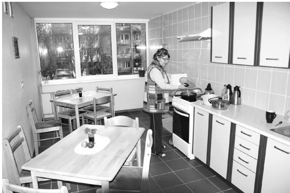
Aprūpes centra iemītņieku rīcībā ir labiekārtota virtuve.