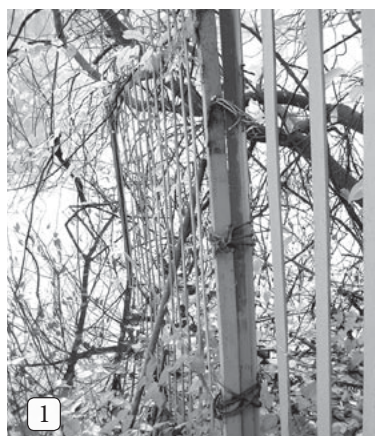
1 Ūdenī iebūvēts nožogojums laivu garāžu kooperatīva "Daugava" teritorijā.