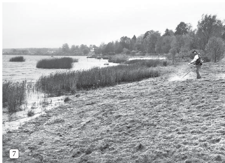
7 Tauvas joslas sakopšanas darbi.