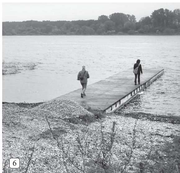
6 Betonēta laipa Daugavā pie Ģipsūstūra.