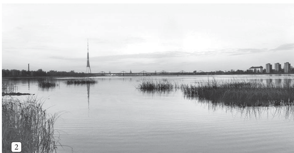
2 Skats uz Rīgu no Katlakalna meža.

Telpiskās plānošanas daļas teritorijas plānotāja