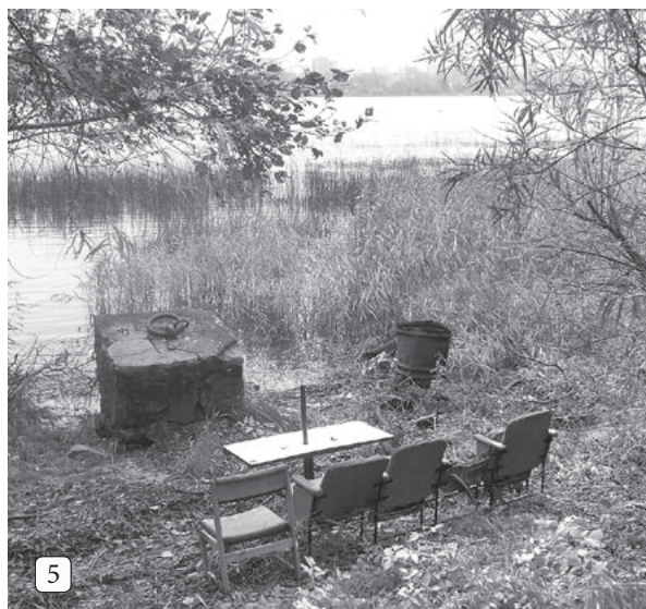
5 Iedzīvotāju iekārtota atpūtas vieta D/S "Ziedonis".