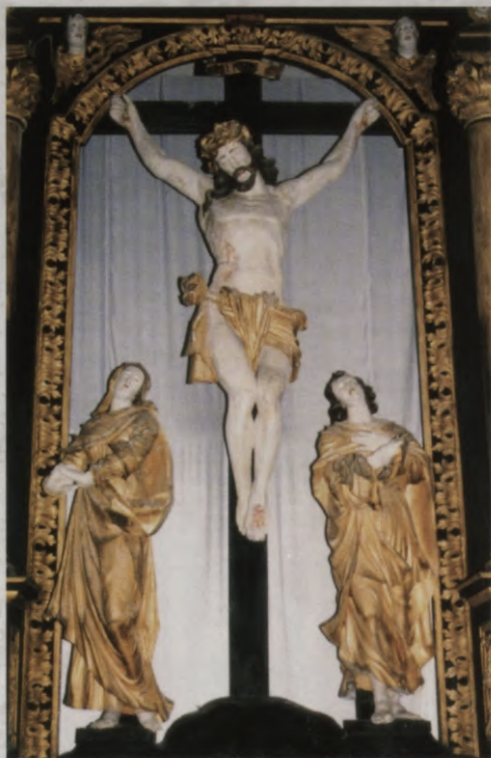
2.att. "Kristus pie krusta" - skulptūru grupa altāra vidusdaļā.

Vienlaikus ar baznīcas celtniecību, muižu īpašnieku pienākums bija radīt ekonomisko bāzi mācītāju algošanai darbam savās draudzēs, kas bieži bija divvalodīgas. Mācītāja pienākums bija apkalpot muižnieka dzimtu, tās locekļiem sniegtot garīgo aprūpi vācu valodā. Savukārt, dievkalpojumi un sakramenti zemniekiem tika nodrošināti latviešu valodā. Tādēļ muižnieki bija ieinteresēti piesaistīt savās draudzēs pastāvīgam darbam izglītotus dvēseļu ganus. Viņu atalgošanai tika radītas ievērojamas saimnieciskas vienības - mācītājmuižas, kas nodrošināja šim sabiedriskajam slānim pienācīgus ienākumus, pašus mācītājus uz vairākām paaudzēm piesaistot dvēseļu kopšanas darbam muižu draudzēs. Ugāles mācītājmuiža atrodas apmēram 2 kilometrus uz dienvidaustrumiem no baznīcas. Tā ir bijusi 106 ha liela. Mācītājmuižas ienākumus palielināja tai piešķirtās trīs zemnieku saimniecības ar kopējo apstrādājamo platību 250 ha. Pati ēka ir skaista 18. gadsimtā celta vienstāvu ķieģeļu garenbūve ar Kurzemei raksturīgajiem pusšļauptiem gala zelmiņiem un 19. gadsimta beigās piebūvētu lieveni. Apjomīgs manteļskurstenis muižas iekšienē liecina par arhaisku telpu plānu un vaļēja pavarda esamību dūmainsajā virtuvē. Bet plašās istabas ar dēļu grīdu un gaišiem logiem radīja mācītāja sociālajam statusam atbilstošu dzīves komfortu.