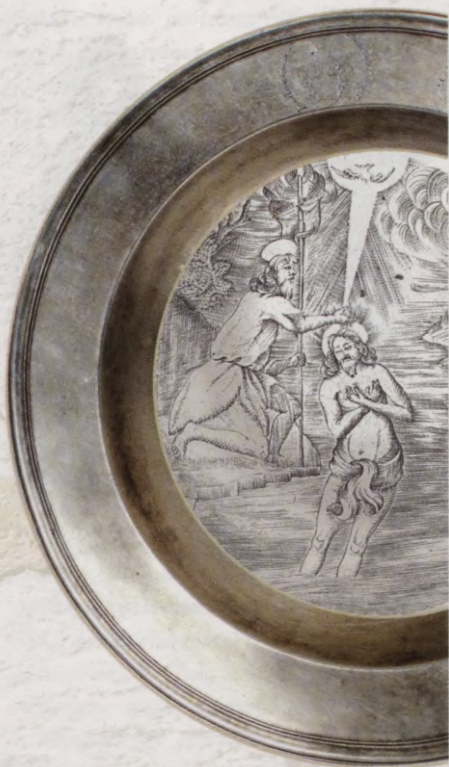
19.att. Kristāmtrauks. 1699.gads.