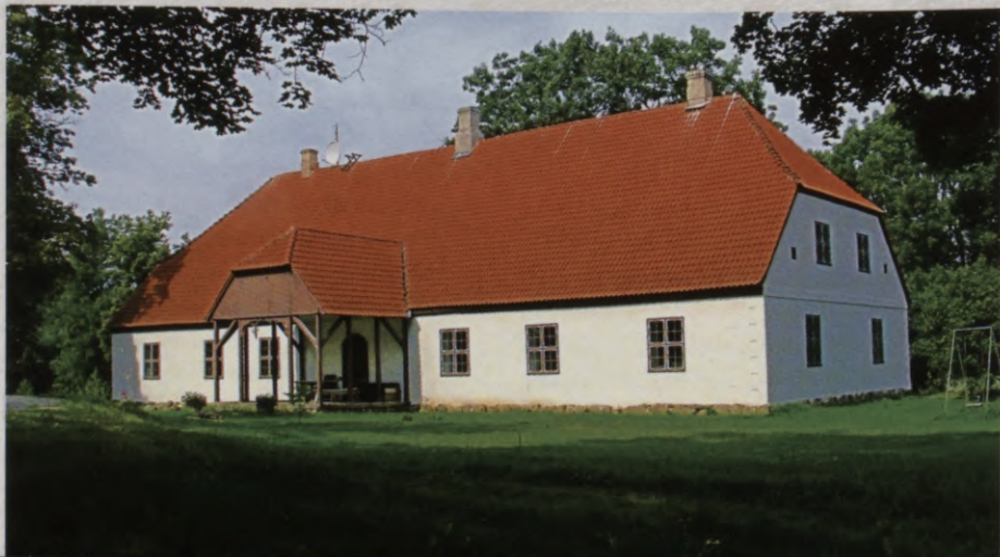
1.att. Ugāles mācītājmuiža

Es zināju to, mans brālēns Rās Kārlis garākā augumā, tad es bi tāds neliels puika. Un remontēja to baznīcu un krāsoja to ārpusi un apmetumu remontēja un tā, un tad bi vaļā tie lodziņi pie zēm no veikal puses. Es turēju pie rokām to Ras Kārlī un laidu iekšā pa to lodziņi un viņš nevarēj zemi sniegt un tad bi jālaiž atpakaļ - viņš netika tur iekšā. Viscaur apakšā ir lodziņi tai baznīcai. Un remontēj to grīdu virs tām pagrabi velvēm. Vietām i biežāk smilšu kārt sabērt' un vietām plānāk un ta' bi tās smiltis nosēdušās jeb izbīrušās tad uz pagraba. Grīda bi slikta, ta' to lauza vaļā - to grīd un veda smiltis, pat ar zirgiem brauca iekšā. Un tad kreisā pusē no durvīm bi tāds zārkokfāgs, no dēļiem tāds. Un apakšā