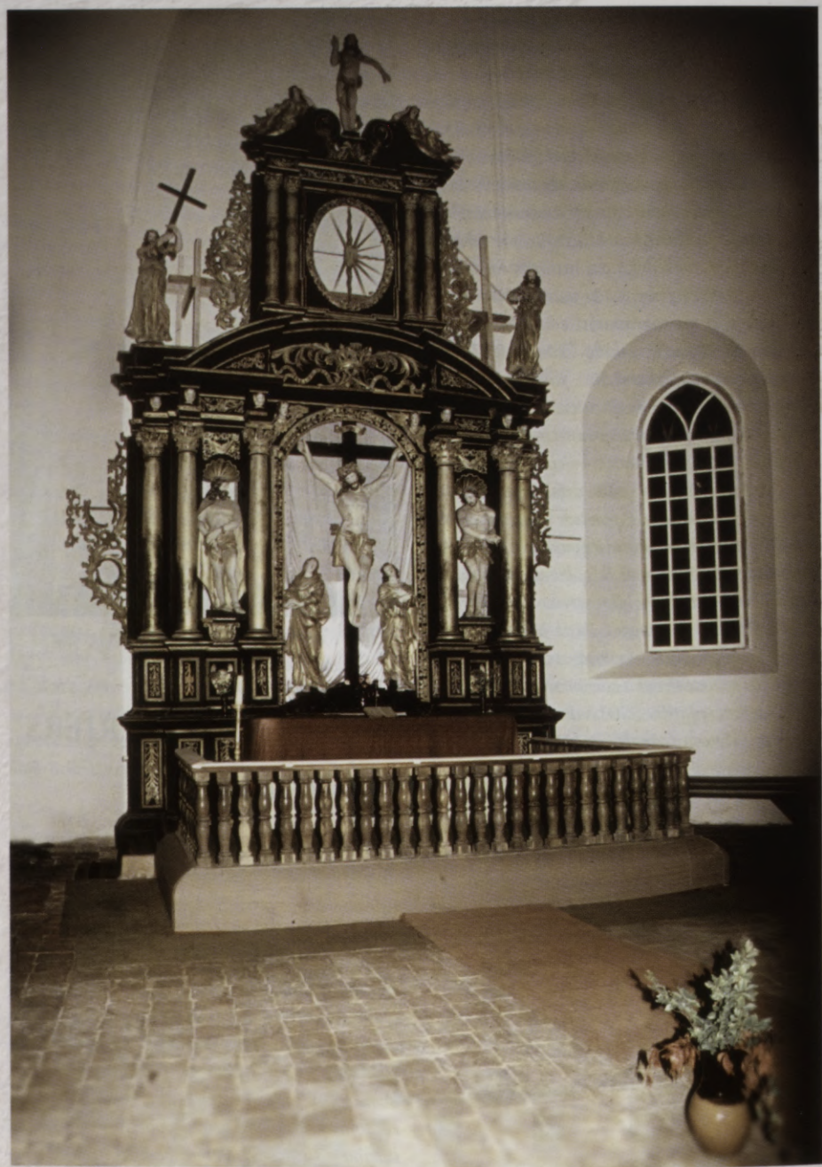
3.att. Altāris Tēlnieks J.D.Šauss, 1697. gads.