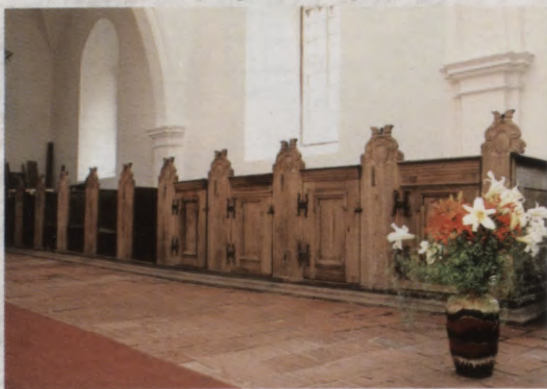
12.att. Draudzes soli. 17. gadsimta beigās.