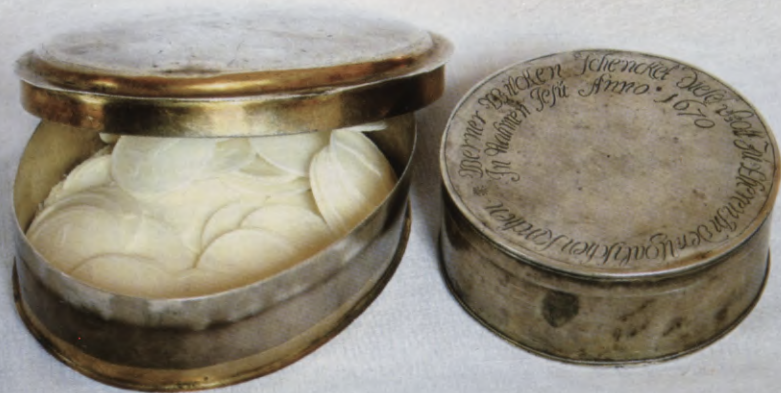
22.att. Ugāles baznīcas dievmaizišu trauki. Pa kreisi 18. gadsimtā, pa labi 1670. gadā dāvinātās kārbiņas