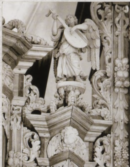
16.att. "Enģelis ar flautu" - Ērģeļu prospekta skulptūra.

Divu manuāļu instrumentu ar 28 stabuļu reģistriem 1700. gadā darinājis Liepājā dzimušais