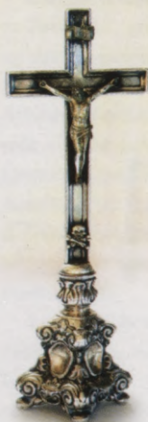
24.att. Altāra krucifikss. 19. gadsimta vidus.