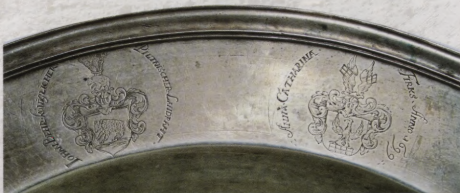
20.att. Fon Bēru un fon Firksu dzimtu ģerboņi uz kristāmtrauka malas.