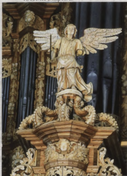
14.att. "Ēnģelis ar takts zizli" - Rikpozitīva virsotnes skulptūra.

Tādejādi arī vizuāli ērģeles sastāv no it kā divām daļām – galvenās fasādes, aiz kuras slēpta lielāka daļa stabuļu un balkona margas priekšpusē pārkares formā izveidotas ērģeļu mazākās daļas – rikpozitīva. Kompozicionālās uzbūves ziņā abas ērģeļu daļas ir līdzīgas. No instrumenta fasādes plaknes izvirzītie trīs stabuļu torņi atgādina it kā smagnējas, ar kokgriezuma skulptūrām un ornamentiem blīvi apkrautas kolonnas, kas grupētas piramidālā kompozīcijā. Ērģeļu fasādes gludās daļas veidotas kā mēbeļu pildīņi ar dažāda lieluma skanošu stabuļu rindām viduci un grezni aplikatīvām augļu un lapu virtenēm to malās. Gan lielākajai, gan mazākajai ērģeļu fasādei, stabuļu torņu augšgalā atrodas saskanīga lieluma muzicējošu ēnģeļu skulptūras. Lielā prospekta centrālā stabuļu torņa virsotnē novietota ērģļa skulptūra, kas ar īpašu virvju pievadu ļauj ērģelniekam ar paminu kustināt ērģļa spārnus. Rikpozitīva vidējā stabuļu torņa virsotnē novietota kokā griezta ēnģeļa skulptūra, kurai ērģelnieks ar pievadmechānisma palīdzību var cilāt roku ar takts zizli. Savukārt zvaigzni pie ēnģeļa – kapelmeistara kājām griež vēja rotors.