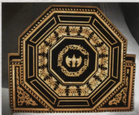
5.att. Kanceles jumta apakšpuse ar Svētā Gara atveidu, J.D. Šauss, 1697. gads.