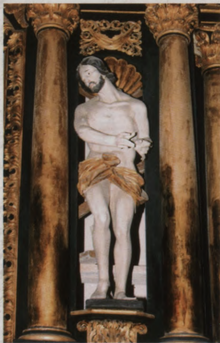
4.att. Altāra skulptūra "Šaustītais Kristus" J.D. Šauss, 1697. gads.

kailā, šaustītā un zaimotā Kristus skulptūras. Tajās Kristus attēlots ar atlētisku augumu, kura galvenais ekspresijas līdzeklis ir stāja, galvas pagrieziens sāņus un daiļrunīgi žesti. Ķermeņa atveidojums koka skulptūrās jau pēc gludās virsmas apstrādes atgādina darbu akmeni, bet gaišpelēkais krāsojums vēl vairāk pastiprina līdzību ar marmoru. Retabla pirmā stāva antablementa stūros redzam vēl divas pilnā apģērbā attēlotas, domājams, Kristus skulptūras – viena ar krustu rokās, kā Golgātas ceļu ejot, otra – ar draudzei vērstu skatu un līdzcietības žestā uz priekšu pastieptām rokām. Virs altāra otrā stāva antablementa redzamas divu guļošu eņģeļu skulptūras ar palmu zariem rokās, bet pašā retabla virsotnē starp šīm skulptūrām novietots triumfējoša Lieldienas rītā augšamcēlušā Kristus tēls.