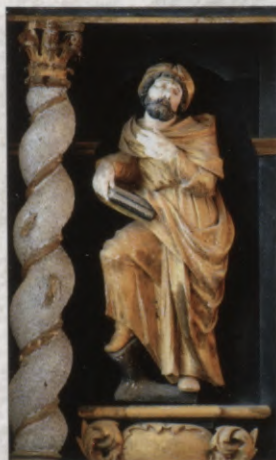
7.att. Apustuļa skulptūra kanceles korpusā, J.D. Šauss, 1697. gads.