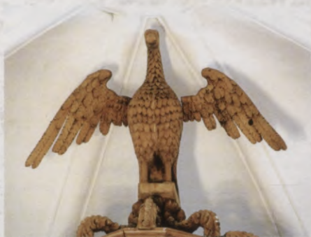
17.att. Ērģļa skulptūra ērģeļu prospekta vīrotnē.