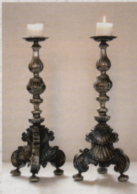
23.att. Altāra svečturi. Sudrabkalis Z. Grēve, 1743. gads.

Mūsdienās mazāk, bet agrāk ļoti plaši dievkalpojumu noslēgumā Ugāles baznīcā ticis izmantots no sudraba skārda izgatavots ziedojumu trauks – gara kāta galā piestiprināms vāzes vai maisiņa formas priekšmets. Ziedojumu vācējs šo trauku pastiepa preti ikvienam no solos sēdošajiem baznīcēniem, kurš savu līdzdalību kolektē apliecināja ar skaļu monētas iesviešanu. Šo astoņpadsmitā gadsimta otrajā pusē kalto 15 centimetrus augsto ziedojumu trauku papildina fon Bēru dzimtas alianses ģerbonis. Ļoti ticams, ka tas ir saistīts ar kādu mūsdienās nezināmu, bet dzimtas vēsturei nozīmīgu notikumu.