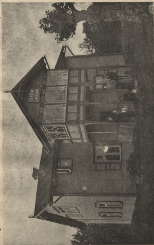
Vasarnica „Leukadija“ (Uzņemta 1905.).